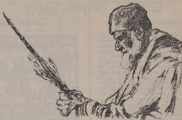
Hermann Struck. Lulaw