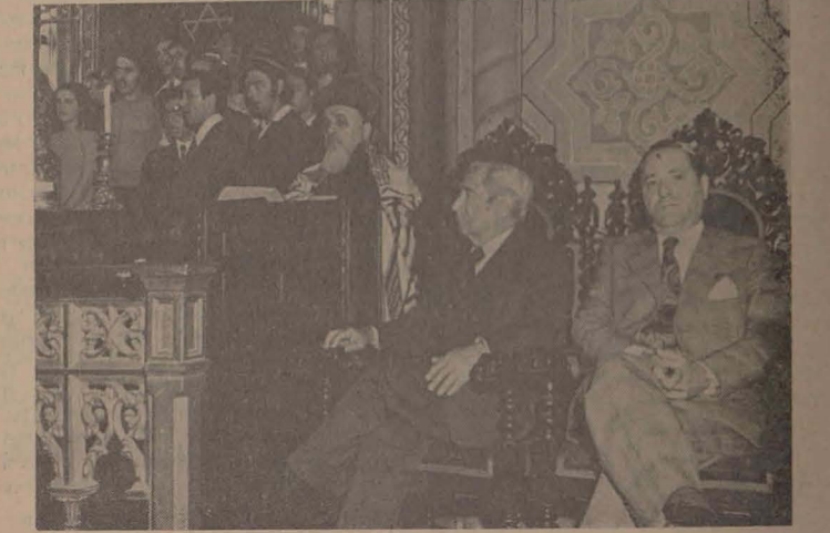
אין בוקארעשטער קאָראל-טעמפל בעת דעם קבלת פנים.

דער פרעזידענט פון דער סאָציאליסטישער רעפובליק רומעניע, הער ניקאָלאַע טשאַושעסקו, האָט אויפגענומען דעם 24 סעפטעמבער ד"י, דעם פרעזידענט פון יידישן וועלט-קאָנגרעס, נחום גאלדמאן, וועלכער געפינט זיך אויף א פרייוואטן באזוך אין אונדזער לאנד. אַלץ צו דעם אונדזערשטן האָט זיך באטייליקט דער דירעקטאר פונעם דעפארטאמענט פאר די אינטערנאַציאָנאַלע באציאונגען פון יידישן וועלט-קאָנגרעס, ארמאנד קאפלאן.