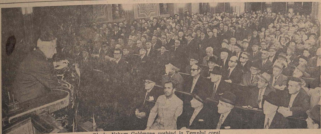
D-l. dr. Nahum Goldmann vorbind la Templul coral

Întrevederea s-a desfășurat într-o atmosferă cordială.