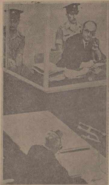
Eichmann în fața justiției