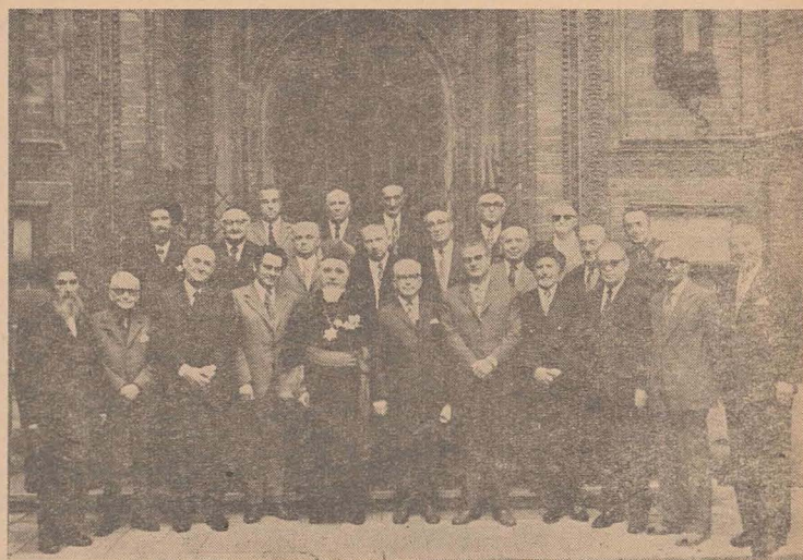
Participanții la ședința solemnă a Comitetului de conducere al F.C.E. (20 august 1974)

● INSTITUTUL de învățămînt Eduard Ludwig, externat și internat, fondat în anul 1864, anunță că noul an școlar a început la 15 august, și că se mai primesc băieți în vîrstă de 3—12 ani.