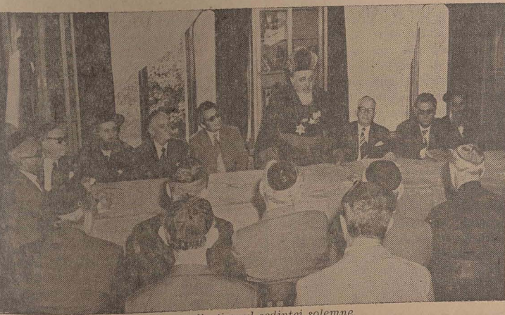
Aspect din timpul ședinței solene