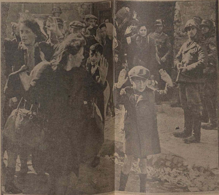
Copii, femei, bătrîni, cu toții sînt mînați spre cuptoarele de la Auschwitz

Îată deci că Eichmann încerca din nou să se prezinte în postura unui simplu executant.