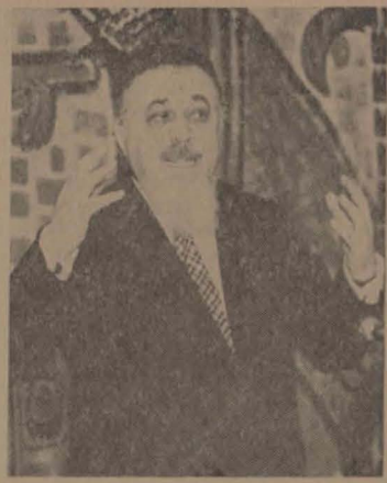
א דעהויבענע שטימונג שאפט די פיינערעכע רעדע פון רב חסדא-יאל

איך קוק זיך צו דעם אלבום און באגען די בליק און די היינטיקע שטייכלען פון אונדז דערשט פריינט, די אקטאריז, די וואס ארבעטן דריי הדישם כדי זי זאלן אונדז אנבאטן דריי דערהויבענע שעה און אן אונטן, איך קוק זיך צו אן איך דערמאן זיך, דאס מאל האב איך שוין נישט מירא פאר די זכרונות... איך דעמאן זיך אן עטוואל פאסטאר, אט די מאדע און ספעציעלע אקטריסע מיט גרויסע אייגן, טיפע און טראגישע, וואס האבן נישט