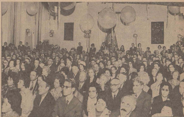
Aspect din sală

Mezuza este menționată în primul paragraf din Șema: „Și aceste obligații pe care ți le spun eu azi să le ai în inima ta... le vei inscrie pe pervazul casei tale și pe porțile tale” (Deut. 6, 4, 9). Pe pergamentul din interiorul Mezei sînt scrise de mîna primelor două paragrafe din Șema: „Ascultă, Israele, Domnul Dumnezeu nostru este singurul Dumnezeu...” (Deut. 6,4—9 și 11, 13—21). Ea trebuie să cuprindă 22 de rînduri. Pergamentul este rulat și strîns într-un toc cu o deschizătură care lasă să se vadă o bu-