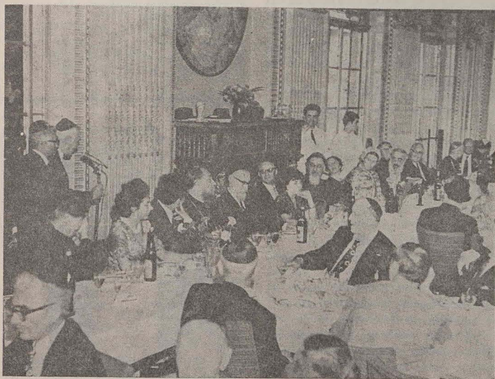
Aspect de la masa oficială oferită de F.C.E.M.

Casele rituale ale F.C.E.M. constituie încă o expresie a libertății religioase depline din Republica Socialistă România.