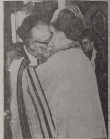
רב הכולל דר. דוד משה רוזן רב הראשי דר. נחמיה

דער אָנוועזנדיקער פון פראַנצאָסן דומיטרו דאָ-נאָר, פרעזידענט און נעמלעך גענעראל-היינטיקע, פֿרעזידענט פון קאָלומביע-דעפארטמענט. עס האָט אויך געהאַלטן בייזונדערע, דעם דעמאָנסטראַציע פון דאָר אַינזעלע, פֿרעזידענט פון נאציאָנאַלע קאָמיטעס פון דער