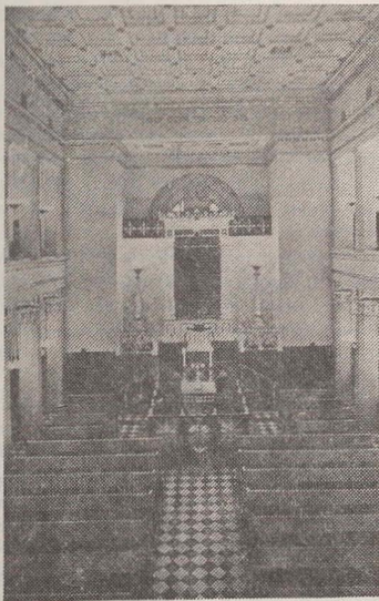
Interiorul sinagogii din Copenhaga

În țara noastră, noua ediție a fost pînă acum semnalată și adnotată în „Buletinul de informare științifică — Lingvistică, Filologie”, 1972, nr. 1, p. 158.