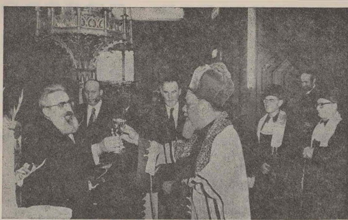
פיירלעכער מאַמענט... רב הראשי שלמה גורן גיס איבער אלס מתנה א כוס דעם בעל היוכל

קשה להיות יהודי פתגם שנור בפי הסוגי העם. ולמה קשה ל על שאינם משיגים האצילות והעדינו שבחורה והיא נשארת אלט חזר טעם וסחומה. בעדט אין היא תורת ד' המתימה ומ- שיבת נפש ואין היא עדות ד' הנאמנה ומחכימת פתי ורוחק מחס ההזדמנות לראת אור התורה מתוך משקפיים לא בהירות שקי- פות ערפול וסבך אמתם ישנם יהודים אשר מודים ומאמינים בכל לבם שהתורה היא מטיי ושווא תורת ד' ברם גם הם אינם מקבלים על עצמם ליה- עול על שכמם זאת אומרת לא חאים המעשים ולסדר ענפי החיים לפי התורה ולכן מתחת להכרה הם באים לידי מסקנה שהתורה היא נאה רפה אבל לפי דעתם היא לא דורשת שהאדם יהיה אסיר בובלים ולפי התפלותם הרי התורה מתרמת על דעות ומדות אבל מי שמתבונן בריצ- נות ולאמיתות הדבר אין התורה מעמסת על ומשא, המצות והחוקים מתורתי הדרד וישר ללכת בו ויפה נביטיו של רבו- תינו "ארון נבטיו נושא" (מסות לה) ברם אפילו אם הנם לא היה בכל פעם ורק לפרקים נשא מארון את נבטיו" הרי