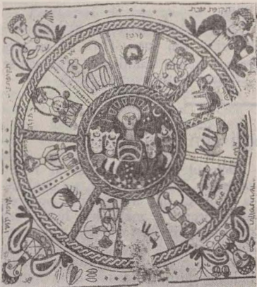
Semnele anului (veche pictură murală)

Despre calendarul pechilor iudei, de la patriarhi și pînă în perioada primului templu, se știe foarte puțin. „Calendarul țărânilui”, descoperit la Gezer, indică doar succesiunea lunilor după muncile agricole, începînd cu toamna. Astfel, se pomeneste despre culesul recoltei, despre semănatul