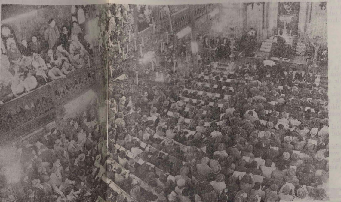
Templul coral din București în zi de sărbătoare.

Baal Sem văzuse și înțelese totul și-și făcu rugăciunea într-o stare de nespusă bucurie. După ce trecu sărbătoarea, chemă copilul la el și-l învăță să se roage și să înțeleagă lumina și adevărul... Sosită zilele judecării, zilele înfricoșătoare. Din sate, evreii se adunau la oraș pentru a-și face rugăciunile la sinagogi, pentru a-și mărturisii păcatele și a le arde în vîlvătaia evlaviei și a pocăinței. Nahum stătea la poarta casei, privind în tăcere cum trec căruțele una cîte una, vedea bărbați și