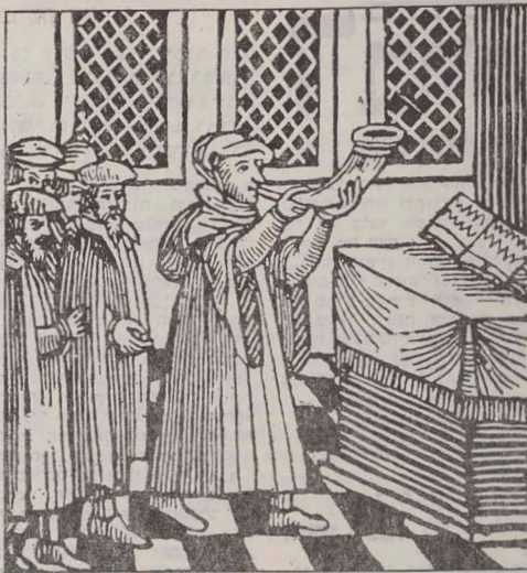
ובשופר גדול יתקע

די בני ישראל קומען אין דער ערשטער ריי אָפצוגעבן די וואָס פאר זייערע מעשים. נאָך זיי קומען די אומות העולם. זיי, די בני ישראל, האָבן דאָך געוואלט די זיך צו רעדן ווערן די תורה נסיון, אזוי אז זיי האָבן נער התחיבות, און