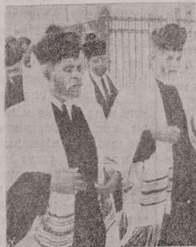
Rabin din Harlem

Ducele de Beauford a oferit grădiniile zoologice biblice din Ierusalim 4 ciute pentru completarea familiei de căprioare. Această grădină cuprinde animale ce trăiau în Țara Sfîntă în perioada biblică. Majoritatea căprioarelor a fost născută în timpul cruciadelor.