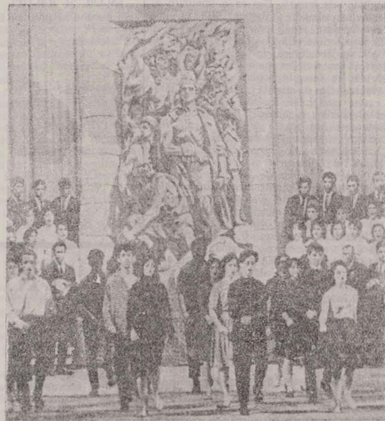
Marșul partizanilor evrei executat de o formație artistică din Vilna.

că nu sînt în măsură să mă transpun în situația lor și să-i judece. Fiecare încercare din partea noastră, care am rămas în viață, de a-i judeca, reprezintă după mine o împlietate.”