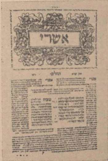
Prima pagină din „Cartea Psalmilor”, din cea de a doua ediție a Bibliei editată de Daniel Bomberg (Veneția 1524—1525).

conținutul rămîne mereu același: „Căci su-flețul meu este sătul de obidă și viața mea este aproape de mormînt”. Acest psalm nu este numai un protest împotriva sule-riinței dar și un aspru dialog cu Acela care îngăduie permanențizarea nedreptății: „Oare în mormînt va istorisi cineva mila