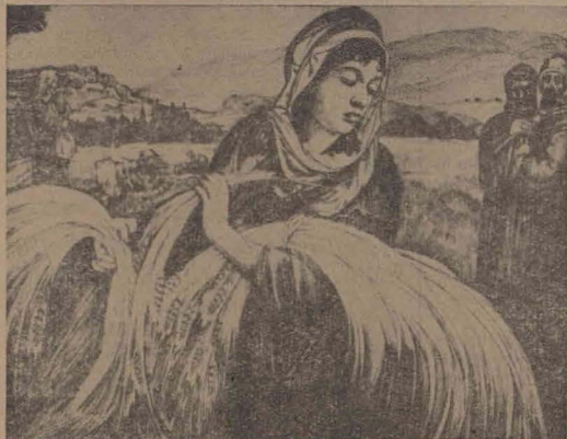
RUT desen de S. Raskin