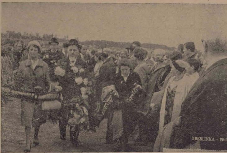
Eminența Sa dl. Șef. Rabin și D-na Dr. M. Rosen depun o coroană de flori la mauseul de la Treblinka