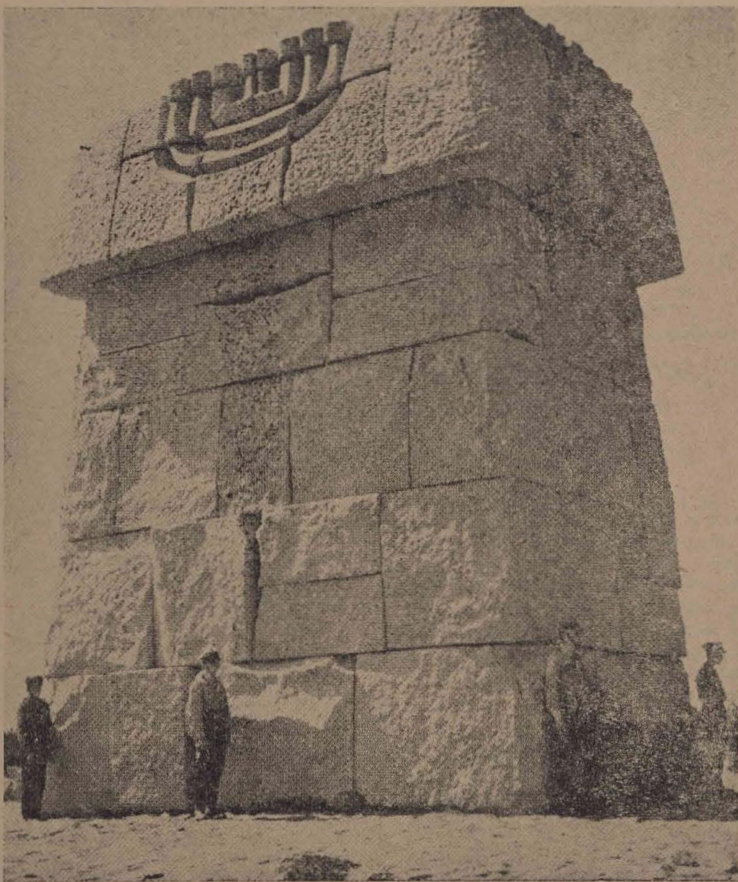
Monumentul de la Treblinka II ridicat în memoria celor 800.000 de evrei victime ale nazismului.

Eminența Sa dl. Șef Rabin și d-na dr. Moses Rosen au depus coroane de flori în numele Federației Comunităților Evreiești (M.) din R.P.R.