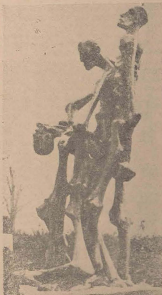
Monumentul în memoria martirilor de la Buchenwald. Sculptură de L. Bancel, la cimitirul Pere Lachaise, Paris

se va face prea mult, niciodată nu se va putea spune deajuns, căci nazismul prin antisemitismul său, prin cultul forței, prin cinismul și diabolismul politic, prin negarea sfărnată a oricăror principii umane, reprezintă o concretizare a tot ceea ce poate produce obscurantismul, sovinișmul, primitivismul și frica. Demascarea nazismului nu va putea înceta niciodată, așa cum niciodată nu va putea înceta lupta împotriva nedreptății și întunerului.