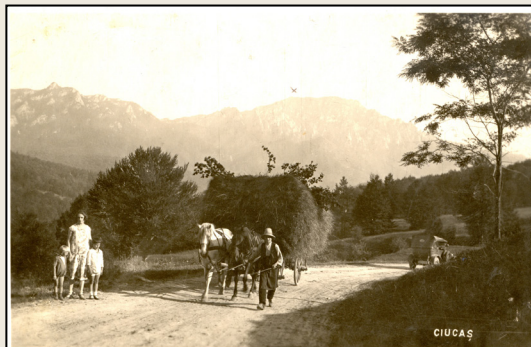
Car încărcat cu fân, venind de la un laz