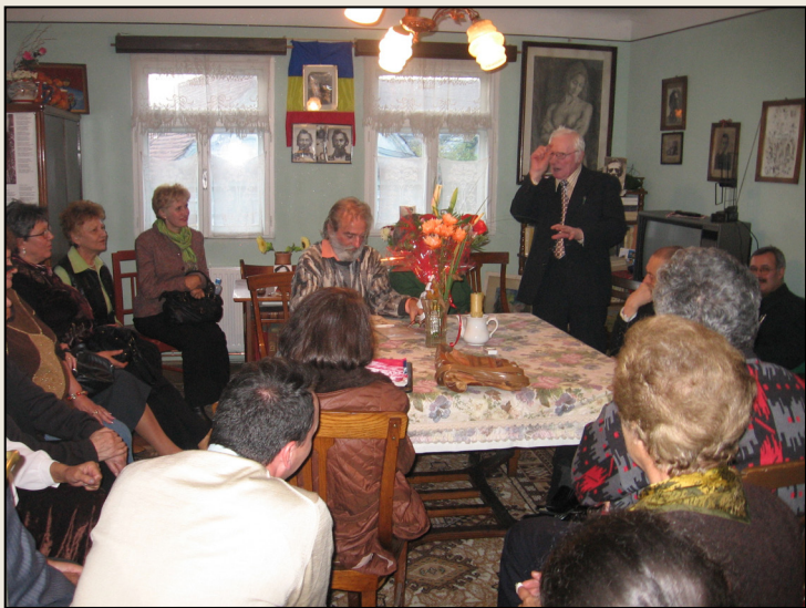
O altă șezătoare literară la comemorarea scriitorului