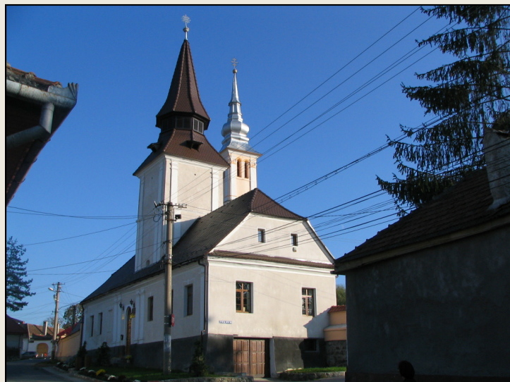
Sediul fostei Bănci Populare ”Săceleana”

Pornind de la aceste principii, Victor Jinga va sprijini și în practică cooperația. Va lua parte activă la înființarea de cooperative în orașele și satele României, va antrena studenții de la Academia de Înalte Studii Comerciale și Industriale Cluj la o serie de acțiuni cooperatiste. Neuitând locul unde s-a născut și a făcut primii pași în viață, economistul săcelean a fost unul dintre