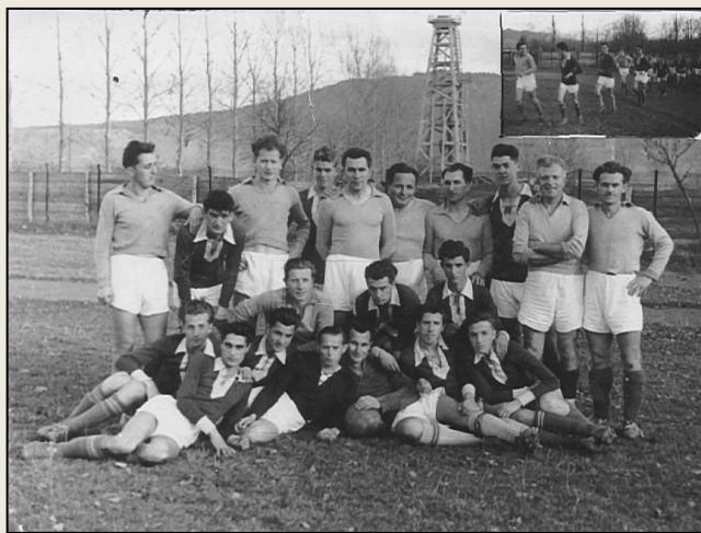
Echipa “Izvorului” în anii: ← 1957 / 1997 ↓

Arbitrii erau cu adevărat «cavaleri în negru», erau integri și se impuneau prin corectitudine. Când te chema un arbitru la