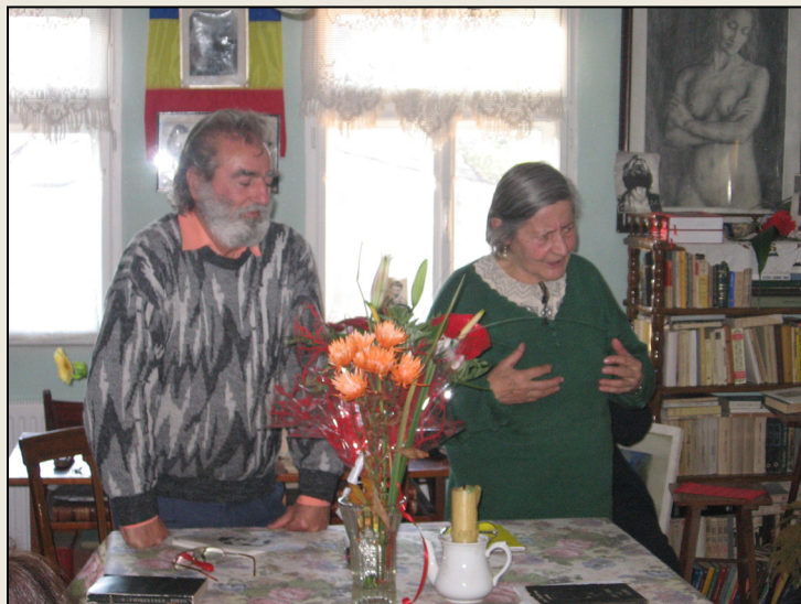
La o șezătoare literară în casa memorială "Darie Magheru"