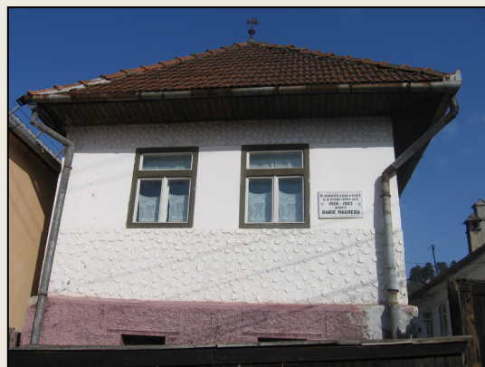
Casa memorială "Darie Magheru" din Turcheș

Cei trei eroi, (Decebal, Ion Vodă și Horia din trilogia „Barbarii”, din care face parte drama „Tragicul domn Ion al Cămilelor” –n.n.) într-o solitudine demiurgică și-ntr-o solidaritate primordială și absolută cu pămîntul acesta, încep lent să se închege telluric din tectonica timpului și-a materiei lui, devenind crescendo mituri, martiri ai unui destin și-și proiectează, pînă la urmă, uriașa lor statură simbolică în orbita cosmică a istoriei, parcă într-o zare de arhetipuri.