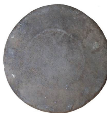
Planșa I. Ulciorul amforoidal de la Tâmburești, jud. Dolj: 1. Desen; 2. Foto; 3. Urme de angobă.