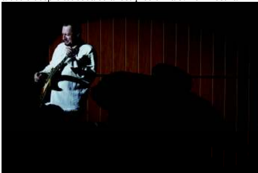
9. Festivalul-concurs de muzică folk "Ziua de Mâine" (ediția a IV-a; 14-16 noiembrie 2008; Alba Iulia)

"Bilă albă" la capitolul PR: pentru prima oară în cadrul Festivalului a existat un Centru de Presă, bine dotat și bine intenționat. Adică interesat să discute spectacolele zilei anterioare, invitați fiind înșiși autorii acestora. Și, tot în premieră, a văzut lumina zilei ziarul Povești , o publicație specială în care găseai articole despre tot ceea ce a fost și ce urma să fie în festival.