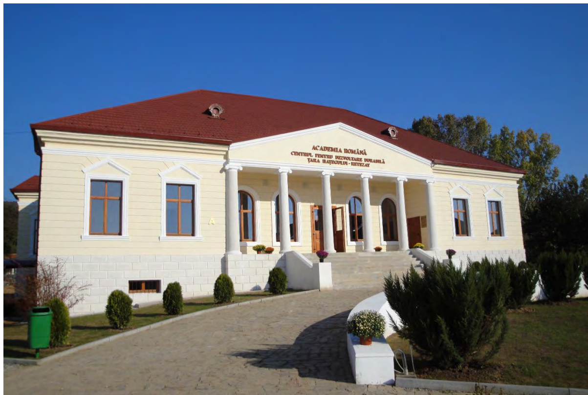
Centrul de dezvoltare durabilă Țara Hațegului – Retezat, proprietate a Academiei Române în fostul conac al generalului H.M. Berthelot.