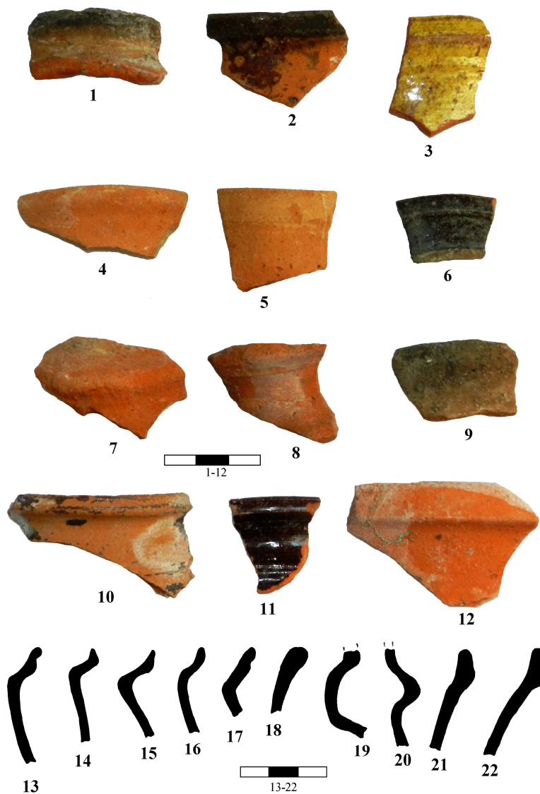
Fig. 5. Oglinzi-„Fântâna Corugea”: 1-22 – ceramică descoperită în apropierea izvorului de apă sărată.