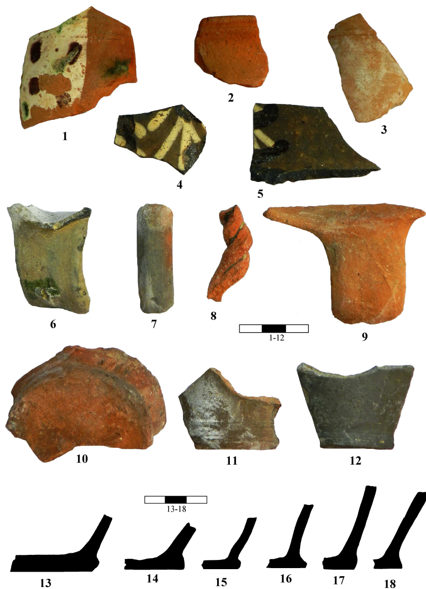
Fig. 4. Oglinzi-„Fântâna Corugea”: 1-18 – ceramică descoperită în apropierea izvorului de apă sărată.