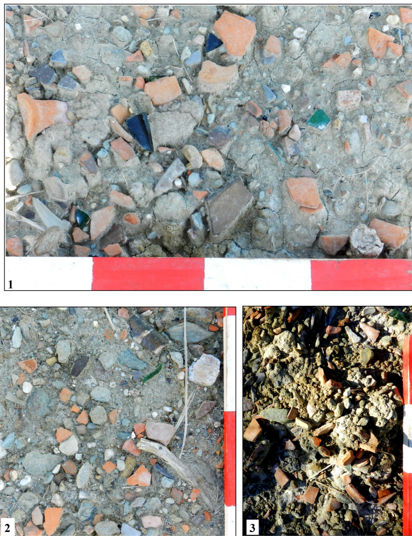
Fig. 3. Oglinzi-„Fântâna Corugea”: 1-3 – ceramică răspândită în jurul izvorului.