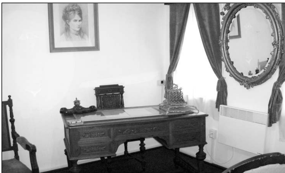
Fig. 2. Imagini din expoziția permanentă