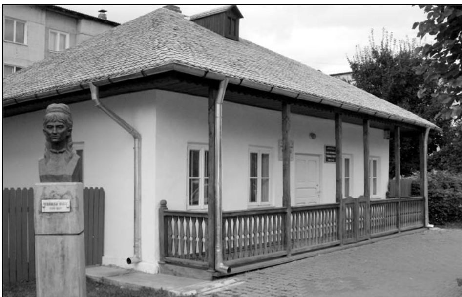
Fig. 1. Casa memorială Veronica Micle, înainte și după restaurare