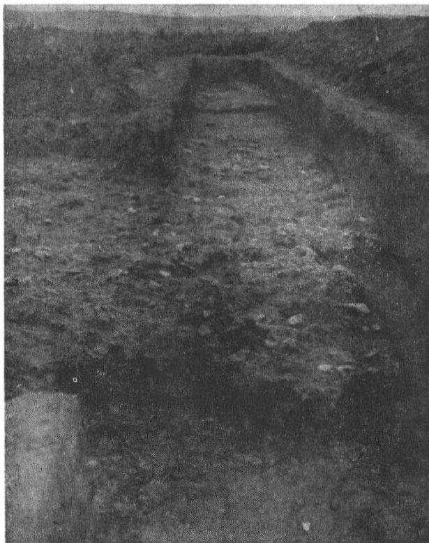
Fig. 3. Aspectul de la intrarea în Petricani.