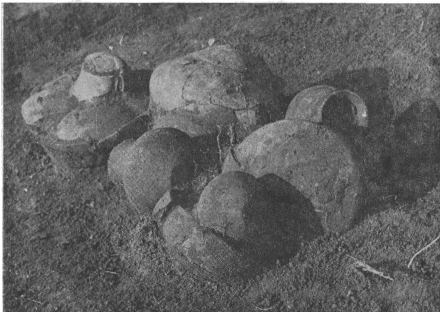
Fig. 1 — Aspect „in situ” de pe șantierul Ghelăiești-Nedeia.