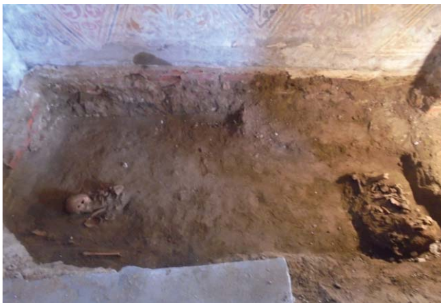
5. Caseta din zona de sud a pronaosului. Cripta cu osemintele lui Fota căpitan Bălăcescu, ale soției sale Stanca și ale fiului lor Ioan.

În caseta executată în sudul pronaosului (dimensiuni 3,2 x 2,4 m) s-a descoperit o criptă cu oseminte umane, aparținând probabil celor trei personaje amintite în inscripția pietrei tombale, precum și a unui urmaș al acestora. Toate osemintele erau deranjate, în urma unor intervenții din secolele trecute, iar osemintele au fost grupate în diferite zone ale criptei. Cripta a fost zidită, cu cărămidă de epocă, încă de la jumătatea secolului al – XVIII-lea.