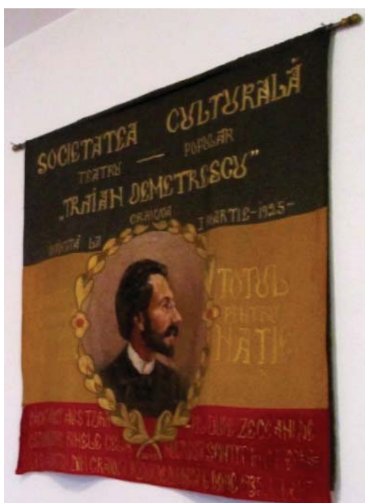
Foto 3 Drapel având în mijloc chipul poetului Traian Demetrescu