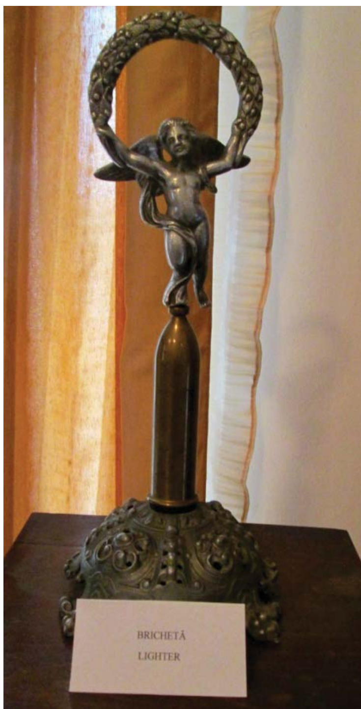
Foto 5 Brichetă expusă în casa memorială "Traian Demetrescu " din Craiova