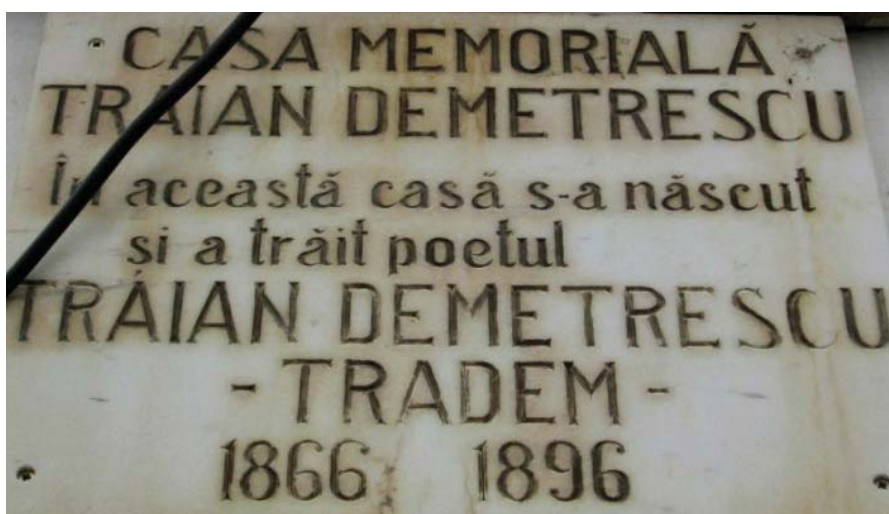
Foto 2 Placa comemorativă amplasată pe casa memorială "Traian Demetrescu"