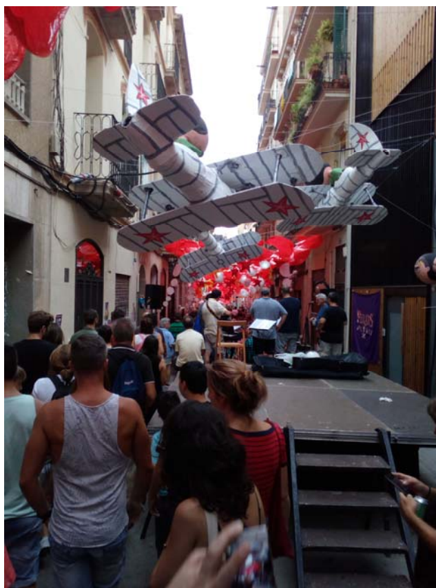
Fig. 3. Fiesta de Gracia 2017 – Politica internațională și consecințele ei.