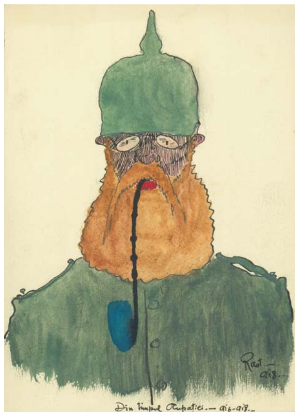
Fig. 7. Rast, Soldat prusian, „Din timpul ocupației 1916–1918”.