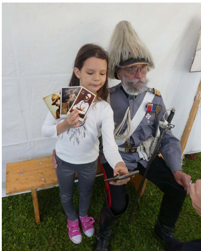
Fig. 5. Mica vizitatoare fotografiindu-se alături de bătrânul sergent din Regimentul de Escortă Regală, ținând în mână cărțile poștale preferate.