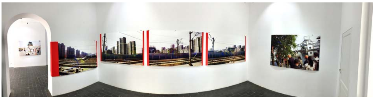
Fig. 7. Imagine panoramică în a doua sală.