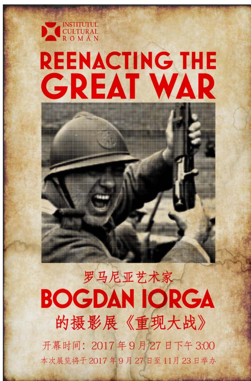
Fig. 1. Afîșul expoziției de fotografie Bogdan Iorga.