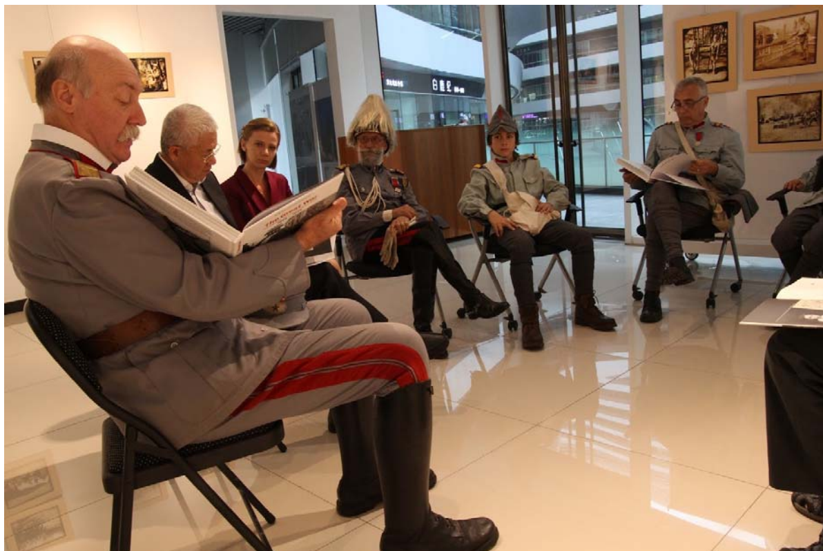
Fig. 4. Prezentarea cărții Războiul cel Mare. Fotografia pe frontul românesc 1916–1919 (Ed. ICR, București, 2014).