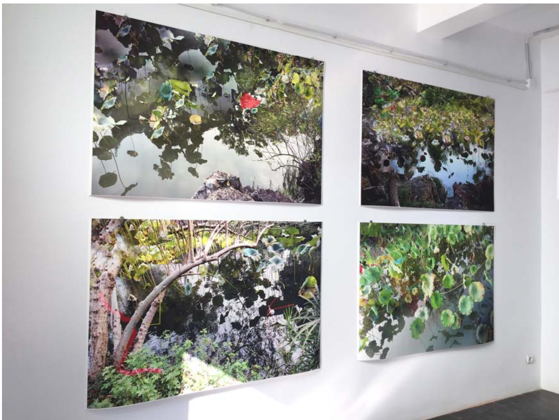
Fig. 4. Suzhou, Humble Administrative Garden.