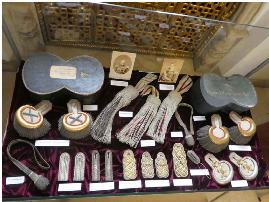
Fig. 7. Epoleți și eșarfe prusiene – unele au aparținut regelui Carol I.

de un colecționar de la Smithsonian Institution din Washington, D.C. Toate acestea erau copii contemporane după clișee originale aflate la Arhiva Națională Antropologică de la Smithsonian Institution, din Washington, D.C.