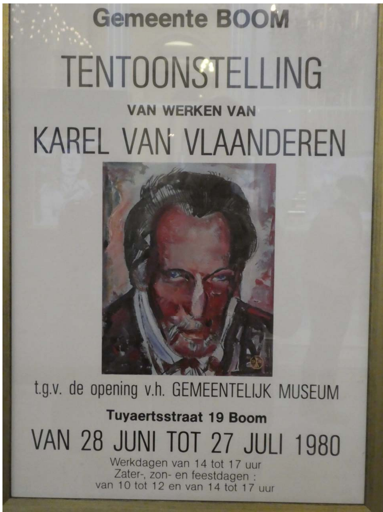
Fig. 3. Afişul unei expoziții din 1980.