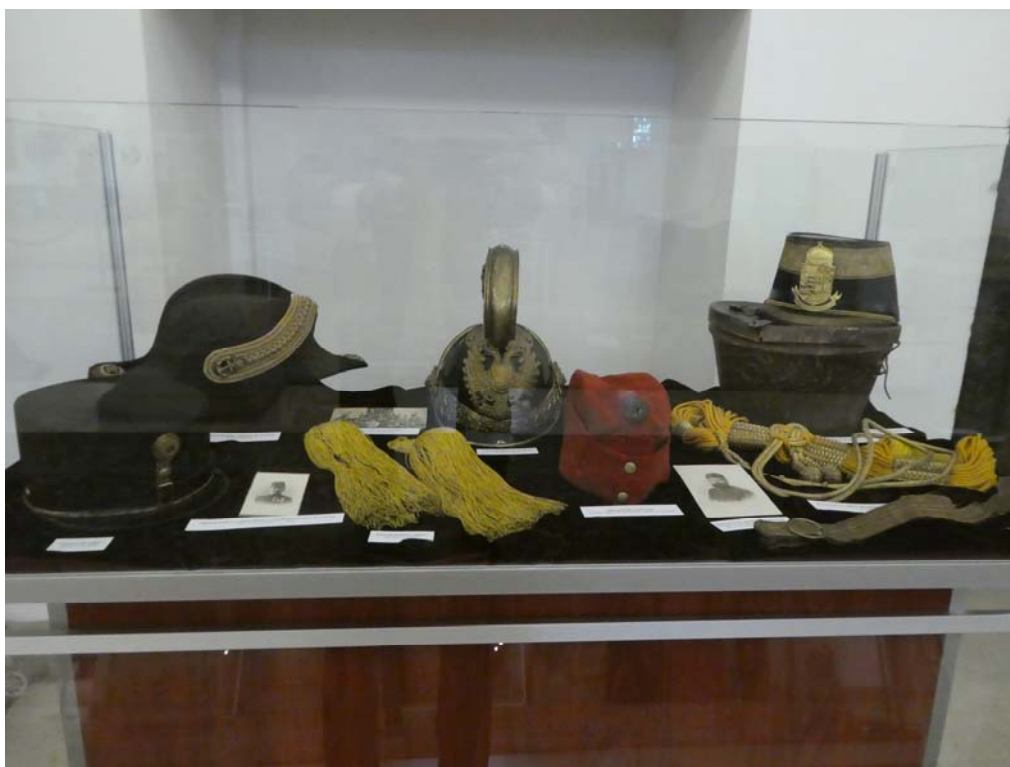
Fig. 8. Efecte ale trupelor austro-ungare: bicorn de marină, cască de dragon, bonetă de mică ținută pentru cavalerie, ceacouri de infanterie, eșarfă și brâu.