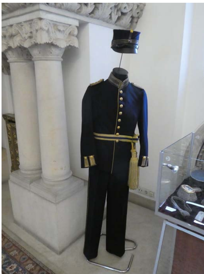
Fig. 11. Uniformă de căpitan din infanteria suedeză.