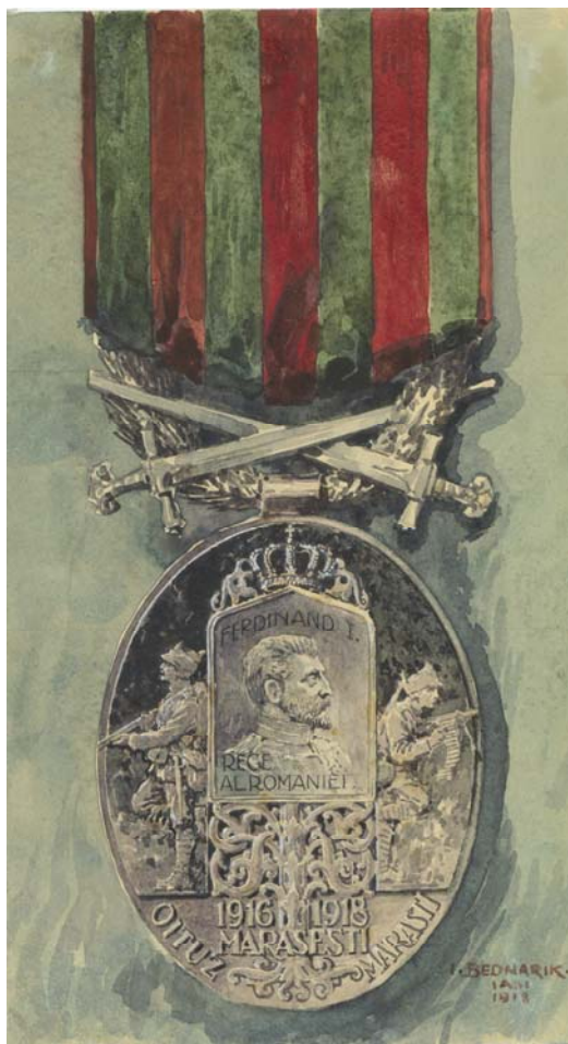
Fig. 1. Ignat Bednarik, Proiect de medalie (avers).