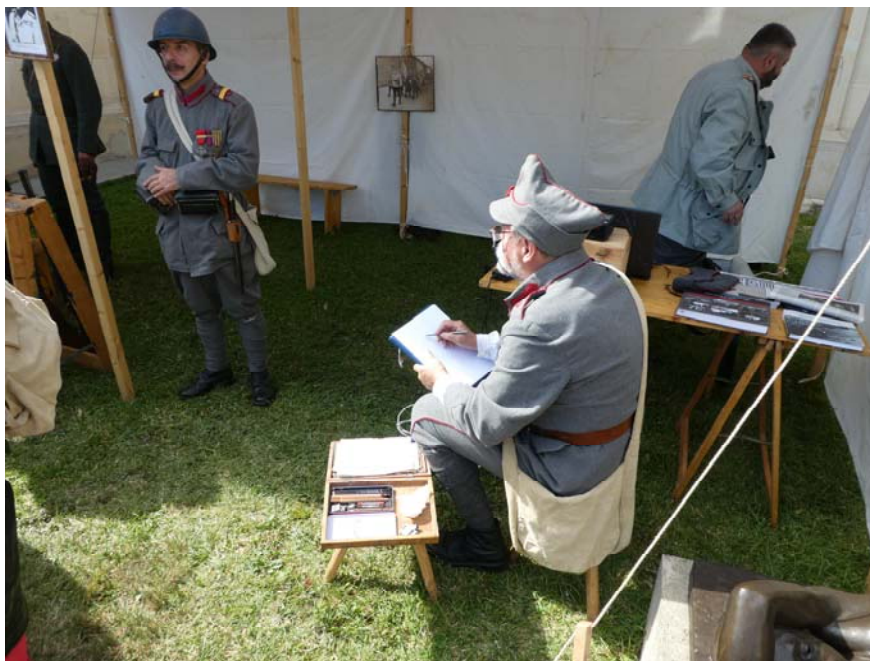
Fig. 6. Artistul de front și modelul său.