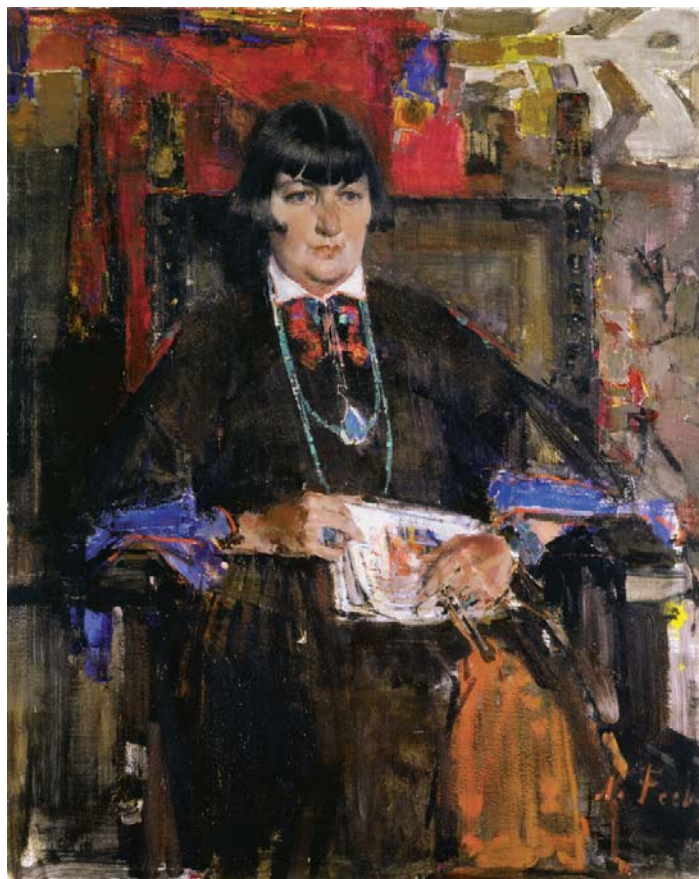
Fig. 1. Nicolai Fechin, Mabel Dodge Luhan, 1927, ulei pe pânză, American Museum of Western Art – The Anschutz Collection, Denver.