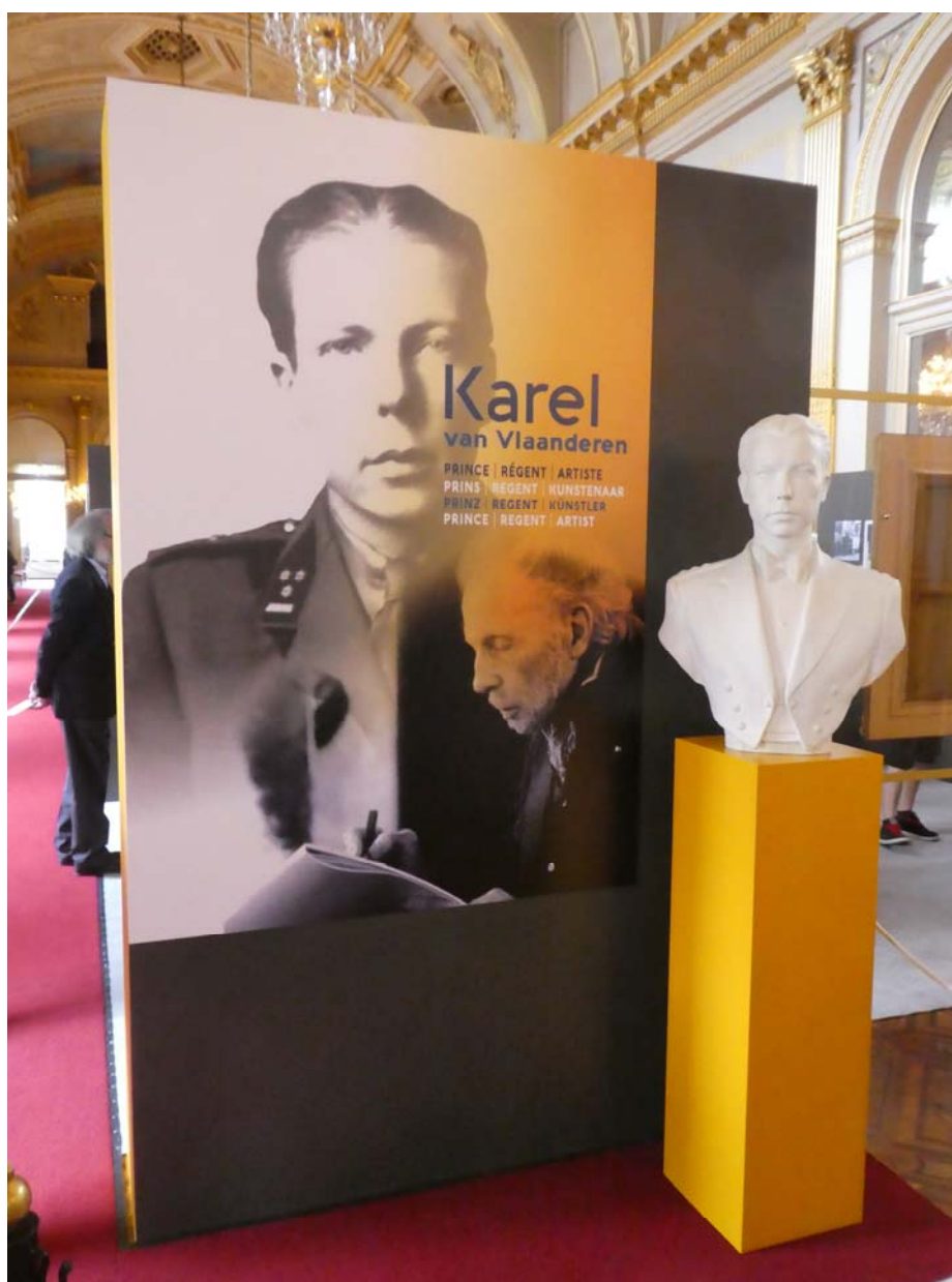
Fig. 1. Afișul expoziției și bustul prințului Charles.

La Palatul Regal din Bruxelles a fost organizată, în timpul verii lui 2017 – atunci când edificiul este deschis publicului – expoziția Karel van Vlaanderen: Prinț-Regent-Artist (Fig. 1). Dedicată unuia dintre membrii familiei regale dotat cu mult talent și pasiune pentru artele plastice, manifestarea contura o personalitate puternică, prolixă, atrăgătoare, misterioasă, puțin controversată din punct de vedere politic, dar care și-a spălat păcatele prin arta ce a slujit-o cu multă asiduitate.