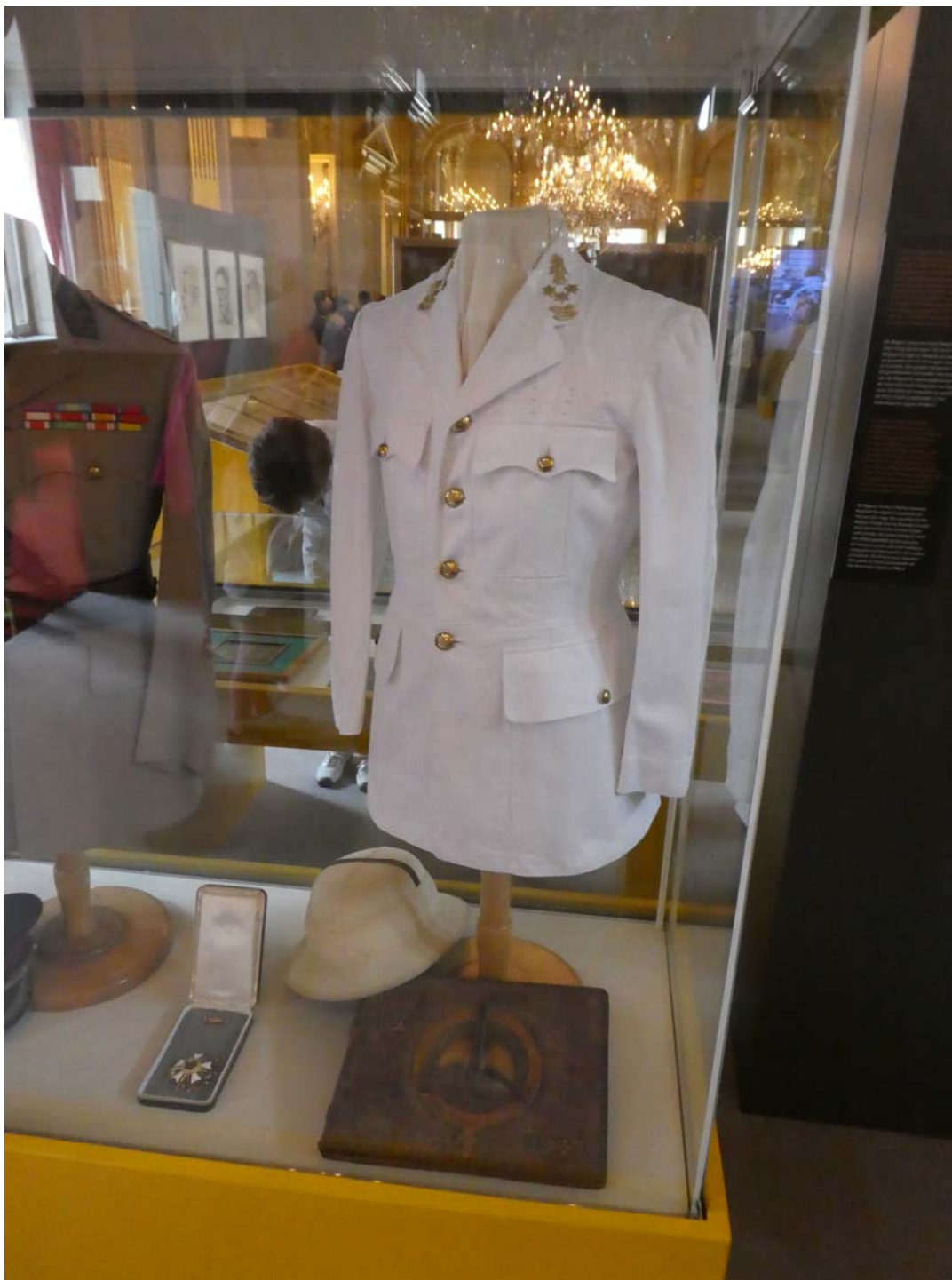
Fig. 2. Uniforma de vară purtată în timpul călătoriei în Congo Belgian.

Un cuvânt trebuie spus despre semnăturile folosite de-a lungul carierei sale plastice. În tinerețe, pe lucrări, așternea inițialele CT care veneau de la prenumele sale Charles Théodore sau simplu Ch. Alteori semna H. R. H., de la His Royal Highness (Înălțimea Sa Regală). Pentru scurt timp, în 1950, a folosit pseudonimul Eddie Sevar care era o anagramă a numelui localității în care trăia, Raversijde. Începând cu anul 1973 a semnat Karel van Vlaanderen (Carol de Flandra) creându-și o siglă în care se împleteau inițialele K și V încadrate de anul execuției picturii. Sub acest nume a expus de 25 de ori în ultimii săi 8 ani de viață (Fig. 3). Își lăsase barbă – care era de o nuanță blond roșcat – și la vernisaje îmbrăca un costum din catifea roșie.