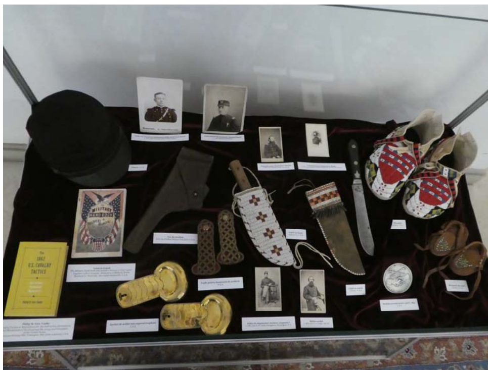
Fig. 12. Piese americane de echipament și obiecte etnografice de la amerindieni.