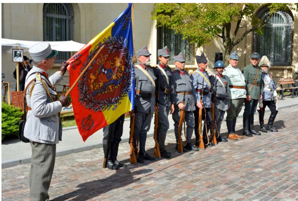
Fig. 3. Prezentarea drapelului și a uniformelor de campanie.