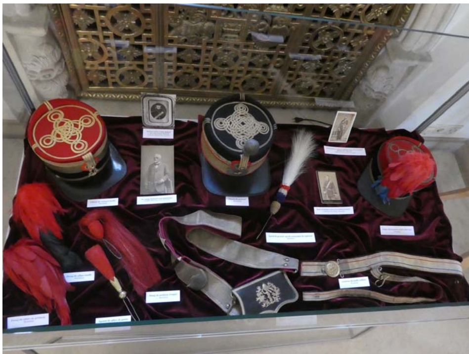
Fig. 6. Chipie, penaje și ledunci românești.