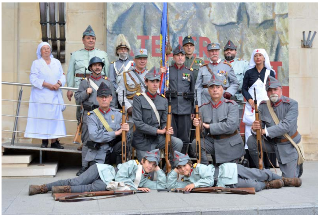
Fig. 8. Am coborât din rame, ne-am desprins din sculpturi.

monitoare, se derulau imagini din portofoliul operatorilor de front din Serviciul Fotografic al Armatei care ofereau o imagine veridică a vieții din campanie: soldați în tranșee, în spatele parapetului, scrutând linia dușmană sau pregătind mitraliera pentru a deschide focul, împingând tunul sau cărând obuze, săpând adăposturi sau morminte pentru camarazii căzuți, dormind pe pământul gol sau mâncând din gamela soioasă, așezați pe un pietroi sau pe un buștean, îngrijiți la ambulanță, vizitați de regele Ferdinand și încurajați de regina Maria „Mama Răniților”, dar și în timpul liber, voioși ca niște copii, jucând popice sau sărind capra, dându-se într-un dulap de bălci, interpretând dansuri populare pe muzică de cobză și de scripcă, făcându-și toaleta sau cârpindu-și uniforma. Astfel, vizitatorul a primit prețioase informații pe care, mai apoi, le-a putut regăsi interpretate pe pânză sau pe coala de hârtie în operele plasticienilor de la Marele Cartier General.