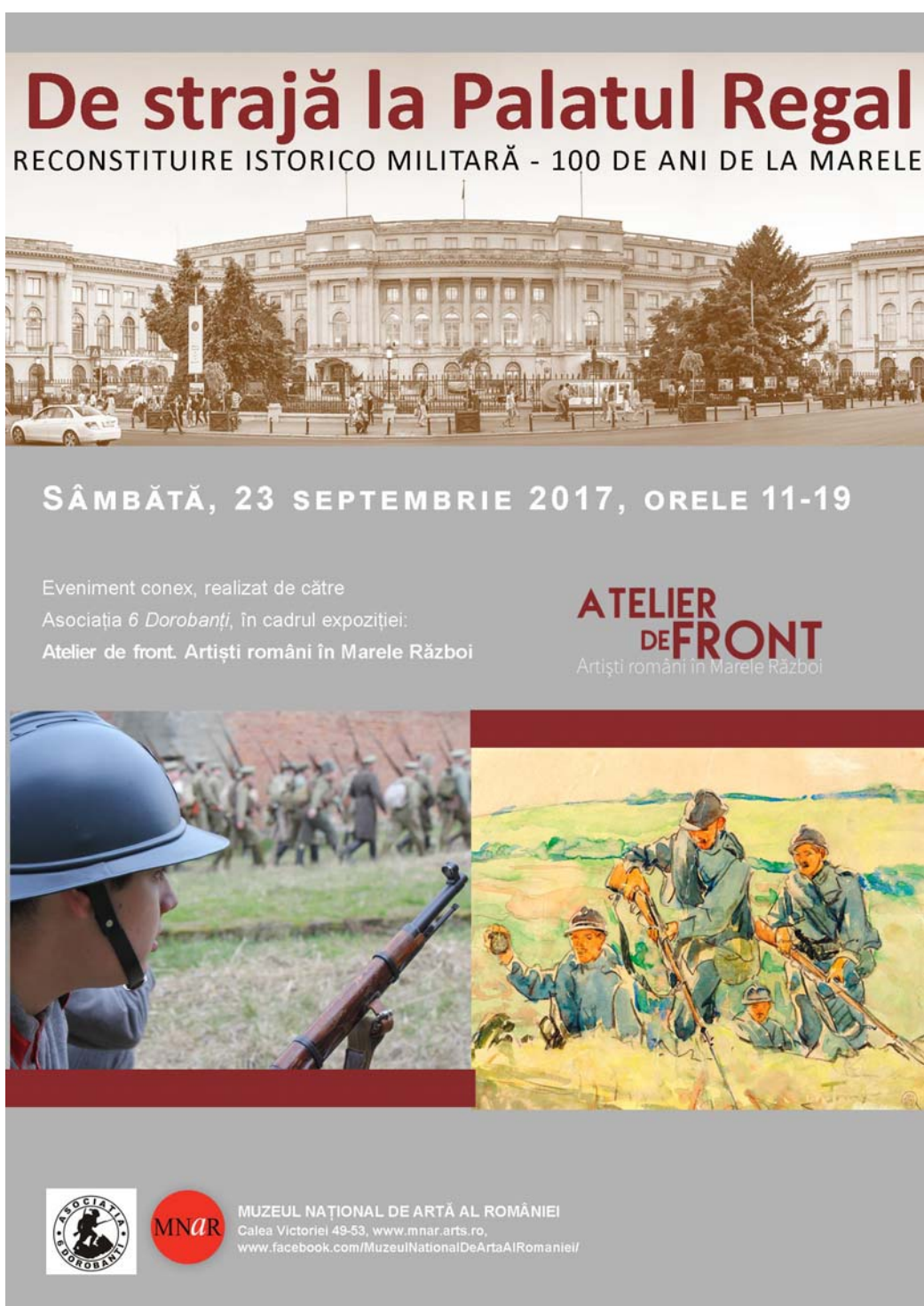
Fig. 1. Afișul manifestării „De strajă la Palatul Regal”.

În vara anului 1917, în armata română, aflată în retragere în Moldova, a fost organizat un grup de plasticieni atașați Marelui Cartier General, Secția a 3-a Adjutantură, cu misiunea de a elabora iconografia participării noastre la conflictul armat, alături de forțele Antantei. Rezultatul eforturilor conjugate urma a deveni nucleul unui muzeu militar. Acest organism s-a constituit ca urmare a emiterii Ordinului Circular Nr. 9400 din 23 iunie 1917, semnat de Șeful Statului Major General, generalul de corp de armată Constantin Prezan. Grupul de plasticieni cu specialități și experiențe diferite, unii deja cunoscuți, alții doar începători, era format din sculptorii locotenent I. Iordănescu, locotenent Ion Jalea, Cornel Medrea, Oscar Han, Dimitrie Mățăuanu, Alexandru Călinescu, Alexandru Severin și G. Stănescu și din pictorii locotenent D. Stoica,