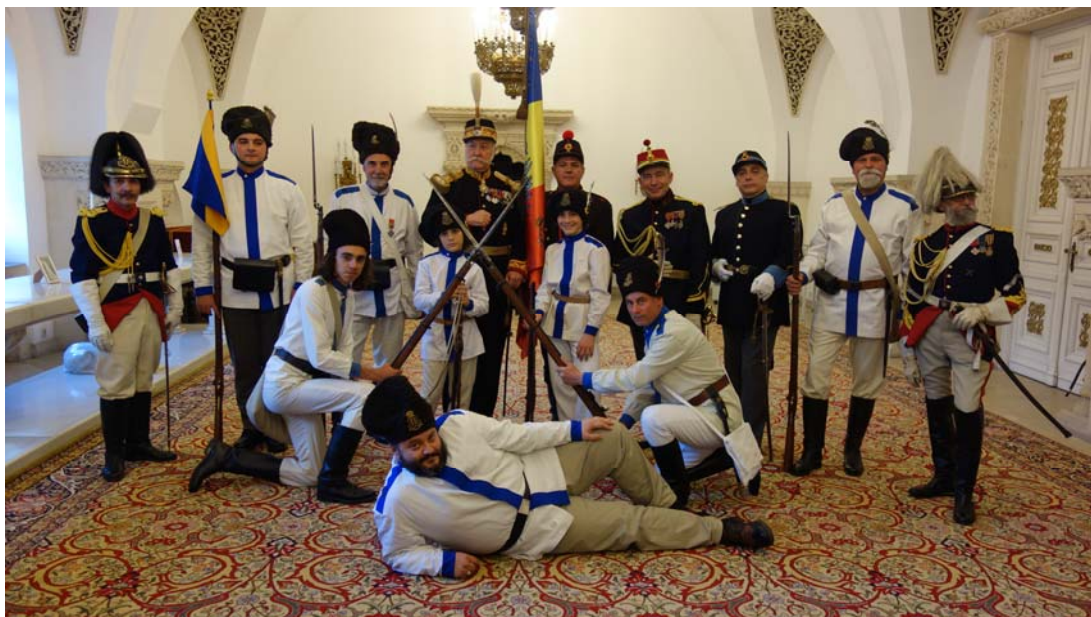
Fig. 13. Asociația „6 Dorobanți” la vernisaj, 10 Mai 2017.