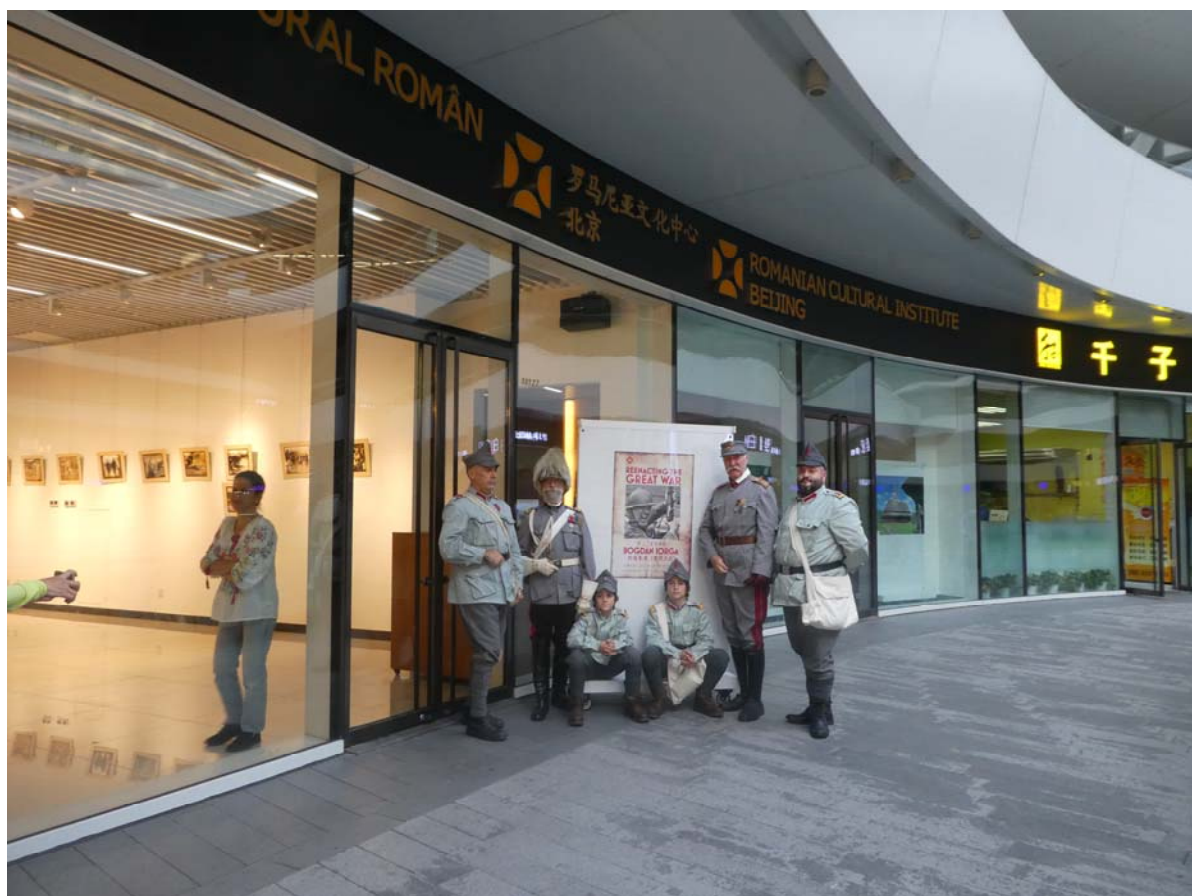
Fig. 5. Membrii Asociației „6 Dorobanți” în fața ICR Beijing.