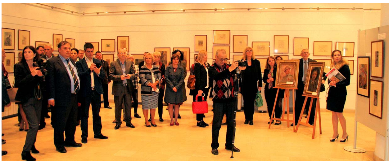
Vernisajul expoziției Mărturii din Războiul cel Mare. Grafică din colecțiile Cabinetului de Stampe al Bibliotecii Academiei Române.