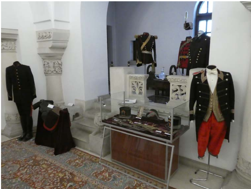
Fig. 1. Aspect din expoziție.

Exponatele au fost judicios organizate, pe țări, și aranjate cu multă atenție chiar de colecționar, care a elaborat și fișele de obiecte după care au fost editate etichetele. În vreme ce uniforme complete au fost expuse pe manechine, în vitrine au fost concentrate piese dispartate de uniformă și echipament (epoleți, centuri, eșarfe, eghileți, chipie, bonete și căști, penaje și egrete (Fig. 6), tocure de revolver, cartușiere și ledunci, ordine și medalii). Printre ele au fost plasate fotografii de dimensiune redusă (carte-de-visite) care ilustrau epoca și suplineau lipsa anumitor uniforme sau specialități militare.