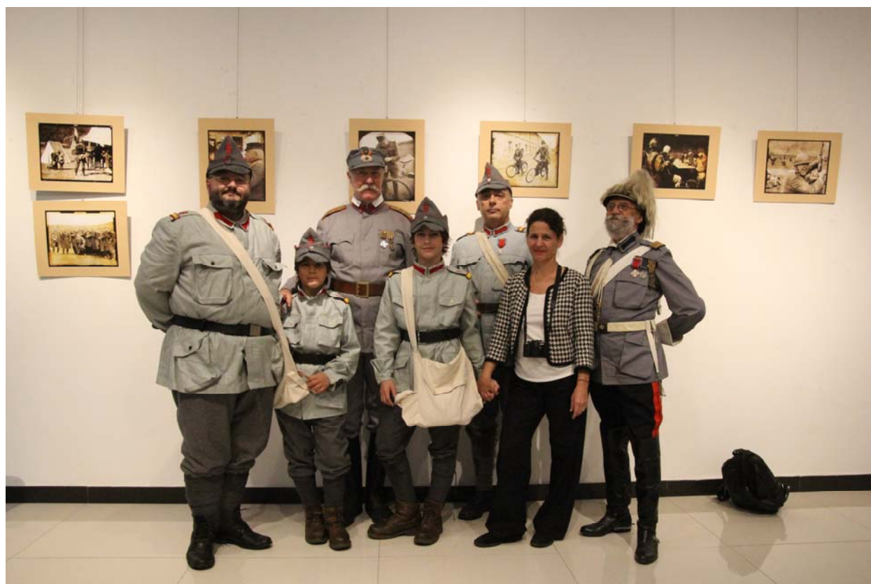
Fig. 3. Membrii Asociației „6 Dorobanți” în expoziția de fotografie de la ICR Beijing.