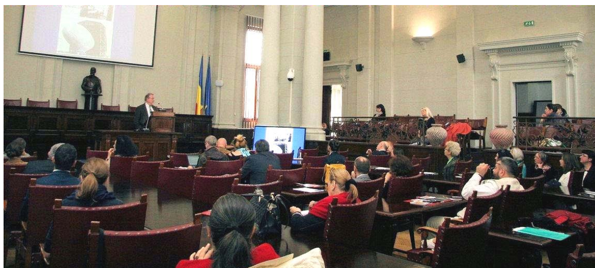
În Aula Magna a Academiei Române.

comprehensibil pentru publicul-țintă, imagini și texte care promovau o cultură a războiului se regăsesc în revistele pentru copii care precedă sau acompaniază cele două conflagrații mondiale. Aplecându-se asupra perioadei 1939–1945, cercetătoarea a analizat variatele modalități imagistice și discursive prin care micilor cititori li se inculcau mitul eroului, ideea de sacrificiu etc. Despre modelele comportamentale pe care le impune o societate aflată în război a vorbit și Simion Câlția ( Heroism and Propaganda. Romanian War Decorations, 22 June 1941 – 23 August 1944 ). Decorațiile militare – a subliniat cercetătorul – au constituit nu doar o recunoaștere a meritelor pe câmpul de luptă, ci și un mijloc de propagandă și de susținere a moralului trupelor. Schimbările efectuate în sistemul decorațiilor militare în cel de-al Doilea Război Mondial, prezentarea în presa oficială a faptelor de eroism răsplătite cu medalii, pe de o parte, și apariția frecventă în fotografii a liderilor politici alături de ofițerii decorați, pe de altă parte, demonstrează că autoritățile au înțeles foarte bine importanța componentei mediatice a războiului.