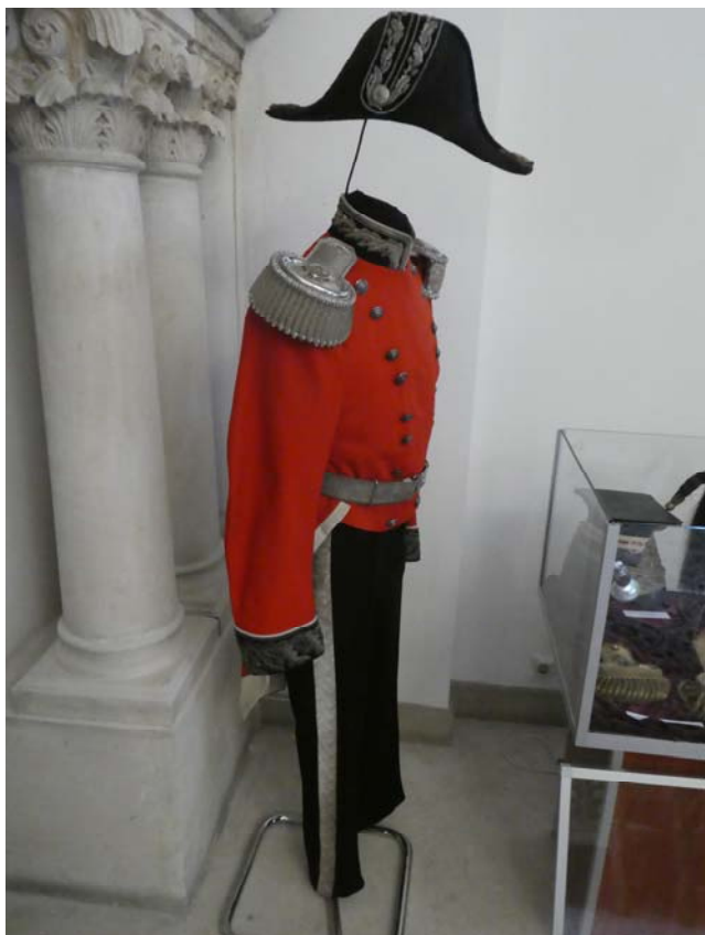
Fig. 9. Uniformă de vice-locotenent de comitat britanic.