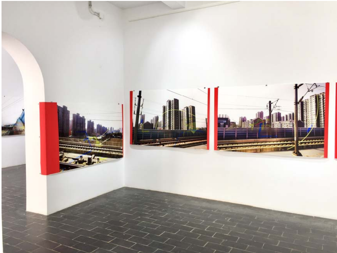
Fig. 3. Quartet China – Beijing to Shanghai.