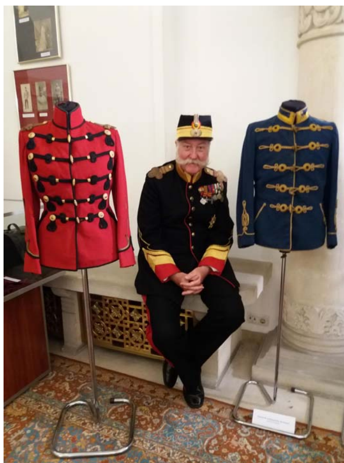
Fig. 14. Colectionarul în pauza unui interviu pentru DIGI 24, 31 mai 2017, foto Ștefania Dinu.

Ne-am putea întreba ce legătură există între armată, uniformă și artă? Și de ce este necesar să scriem într-o revistă de artă despre o expoziție de ținute și efecte militare? Legătura este foarte mare și trainică: de sute de ani tematică războinică a fost abordată de plasticienii din toate țările, luptele și tipurile de luptători au suscitât interesul pictorilor și sculptorilor. Iar pentru a le elabora cu toată corectitudinea cerută de beneficiar –