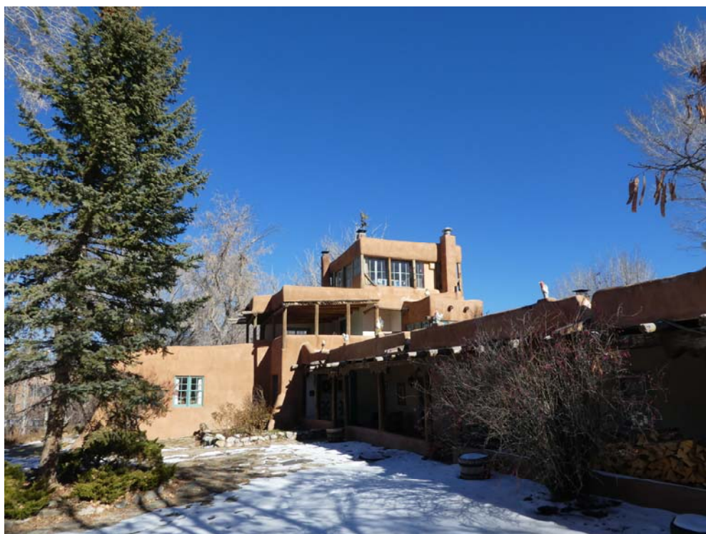
Fig. 9. Casa Mabel Dodge Luhan văzută dinspre curte, foto A. S. Ionescu.

S-a aflat în cercul fotografului Alfred Stieglitz și a publicat articole în revista acestuia, „Camera Work”. A mai colaborat la două periodice de stânga, foarte radicale pentru acea vreme, foaia anarhistă „Mother Earth” și „The Masses” unde unul dintre redactori – ce-i va deveni și amant pentru o vreme – era poetul și gazetarul John Reed ce avea să meargă în Rusia la izbucnirea revoluției bolșevice unde a strâns material pentru volumul Zece zile care au zguduit lumea (1919).