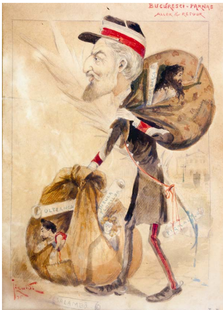
Fig. 1. Constantin Jiquidi, Bucuresci-Parnas, Aller & Retour (Regele Carol I), 1895, Muzeul Național de Istorie a României.

Pe lângă portretele inconfundabile, caricaturiştii se încumetau a realize și compoziții cu multe personaje spre a trata chestiuni stringente ale zilei, precum problema țărănească, animozitățile partinice din parlament, naturalizarea evreilor (Fig. 6), neutralitatea sau războiul în intervalul 1914–1918, etc.