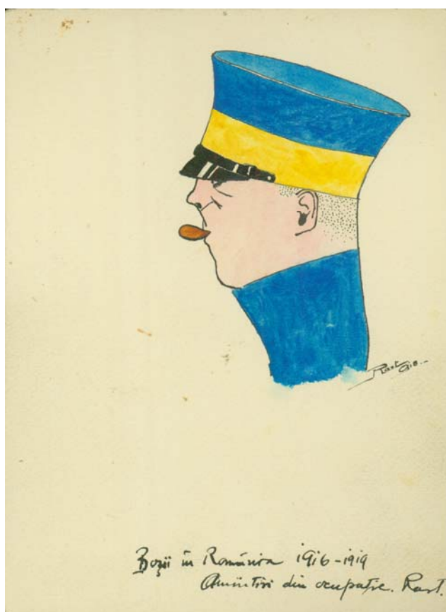
Fig. 8. Rast, Ofițer dintr-un regiment de gardă, „Boșii în România 1916–1918”.