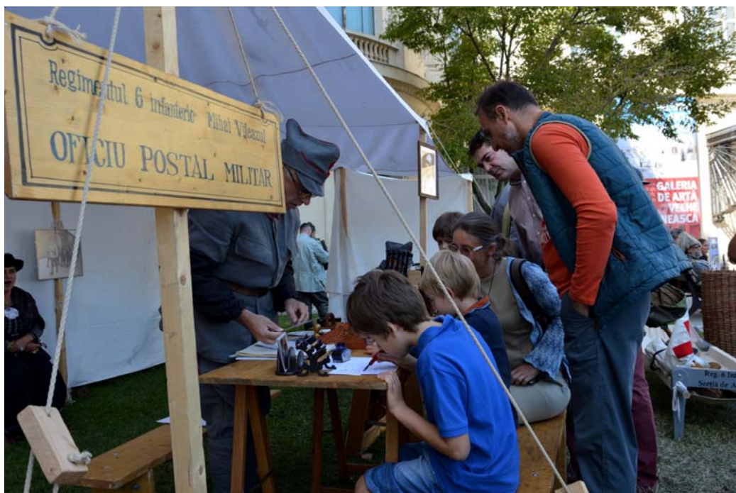
Fig. 4. Oficiul poștal de campanie.