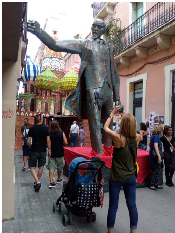
Fig. 1. Fiesta de Gracia 2017 – Utopia marxistă.