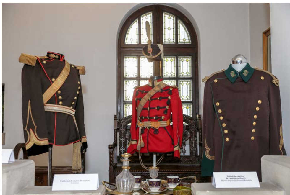
Fig. 2. Tunici de ofițeri de artilerie, roșiori și vânători pedestri.