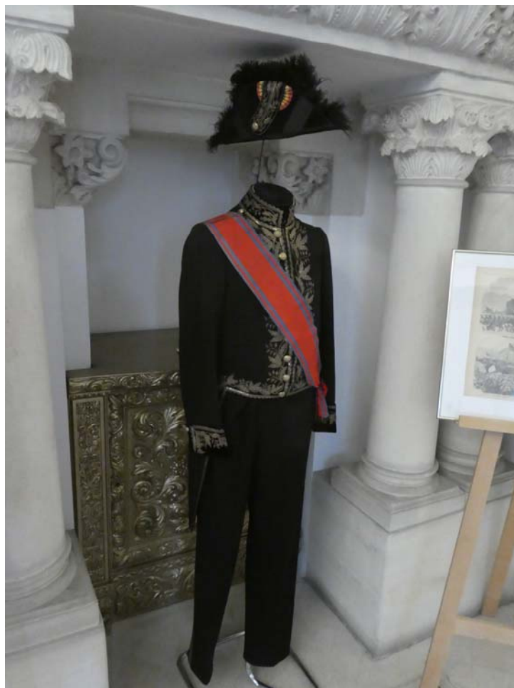
Fig. 4. Uniformă de diplomat ce a aparținut lui Eugen Mavrodi, ministru plenipotențiar la Bruxelles.