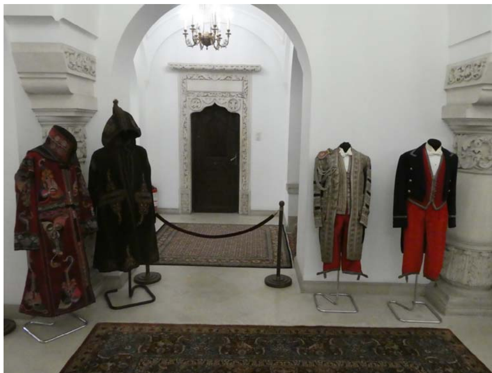
Fig. 5. Ghebe de surugiu princiar și livrele de la Curtea Regală a României.