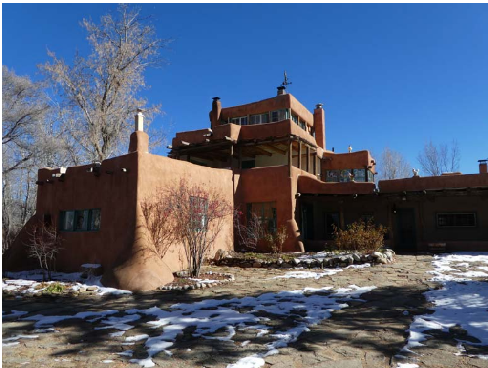
Fig. 8. Casa Mabel Dodge Luhan, Taos, foto A.S. Ionescu.