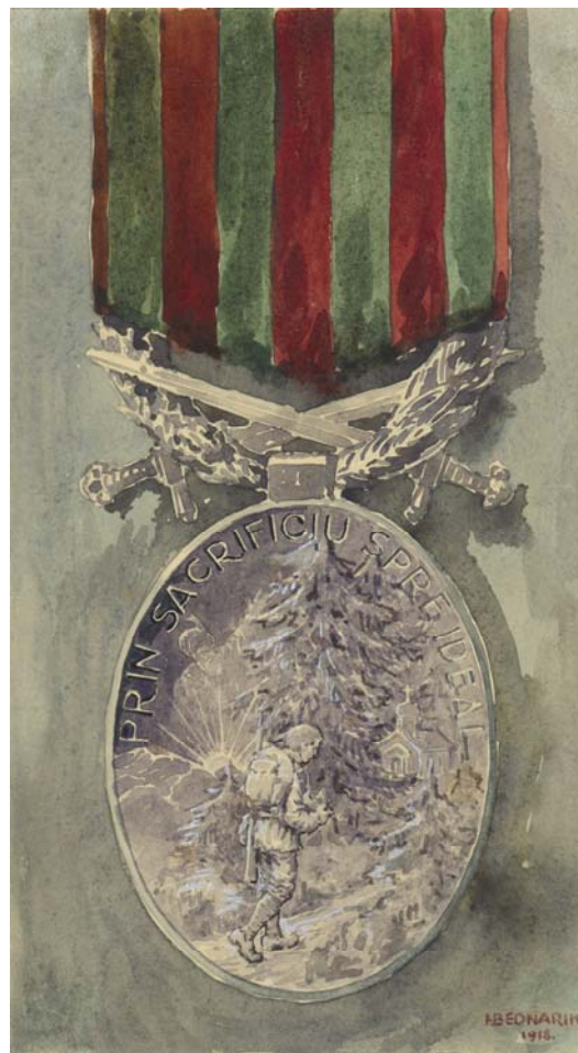
Fig. 2. Ignat Bednarik, Proiect de medalie (revers).