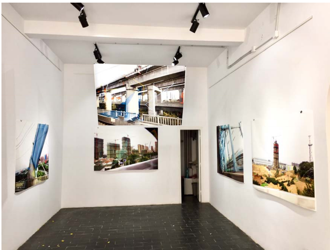
Fig. 1. Bridges și Mono Structure.