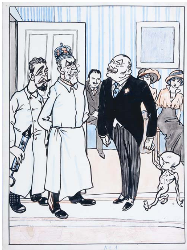
Fig. 2. Ary Murnu, I.I.C. Brătianu, Regele Carol I și Al. Marghiloman la consultație, Muzeul Național de Istorie a României.