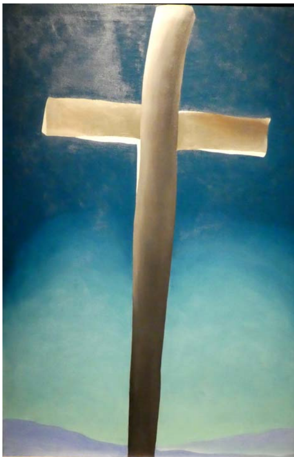
Fig. 5. Georgia O'Keeffe, Cruce gri cu albastru, ulei pe pânză.