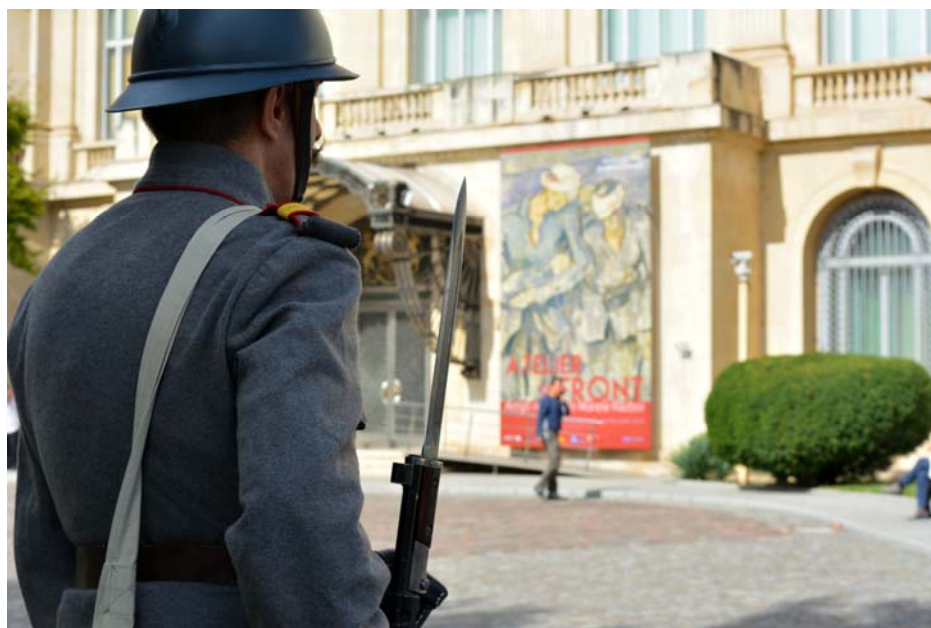
Fig. 2. Santinela.