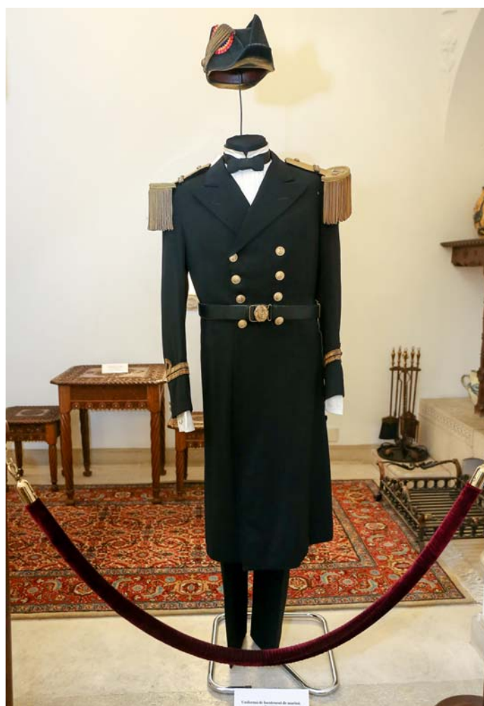
Fig. 3. Uniformă de locotenent de marină ce a aparținut comandorului Eugeniu Botez care, ca scriitor folosea pseudonimul Jean Bart.