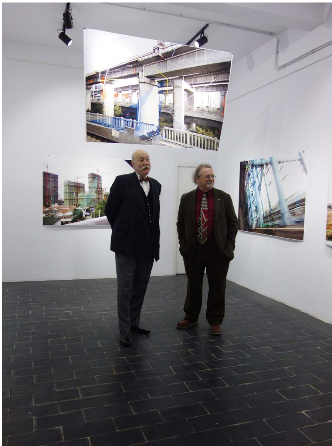
Fig. 9. Imagine din timpul vernisajului, foto Marius Mihăiță.

face interesante conexiuni în spațiu și timp. De aceea și-a și intitulat expoziția „Est/Vest Reconstruit” pentru că el reface un traseu stimulativ vederii și imaginației. La fel cum, în vechime, operele de artă erau narative și publicul putea să desprindă din ele anumite învățăminte utile, și instalația lui Yates propune un excurs în sinologie, cu invitația de a parcurge temeinic fiecare etapă, ca într-un drum inițiativ. Unele imagini sunt de sine stătătoare, în vreme ce altele se urmează, secvențial, pentru a compune un tot cu mare forță evocatoare, precum Quartet China – Beijing to Shanghai .