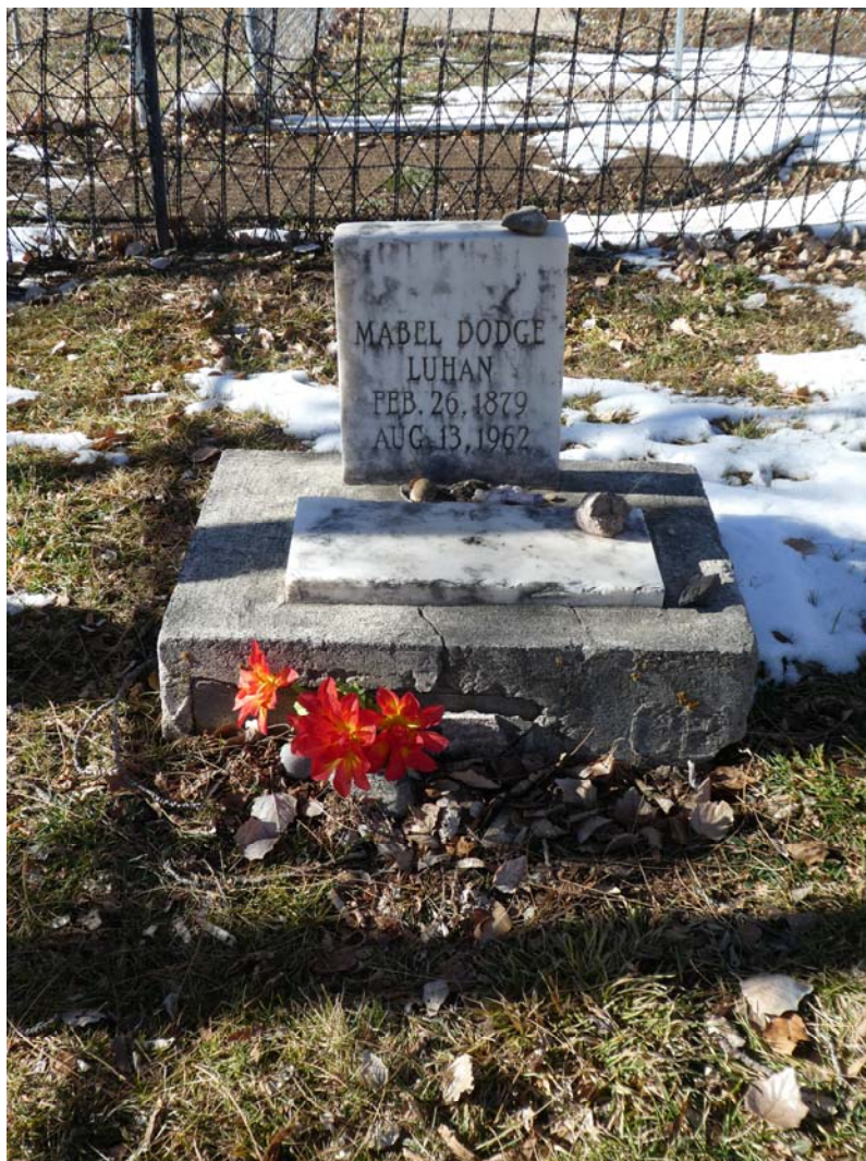
Fig. 10. Mormântul lui Mabel Dodge Luhan în Kit Carson Memorial State Park, Taos, New Mexico