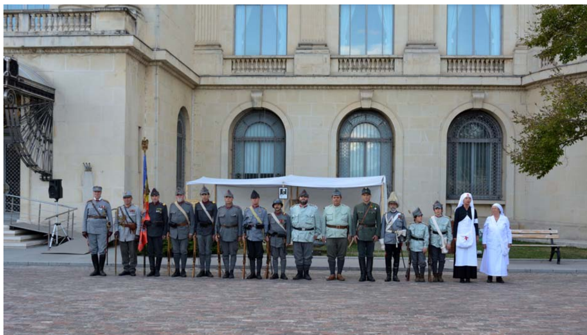
Fig. 7. Asociația „6 Dorobanți” în curtea Palatului Regal.

Manifestarea de la Muzeul Național de Artă a beneficiat de o arhitectură ce dorea să amintească de spațiul strâmt și întortocheat al adăposturilor și tranșeelelor, cu parapete vopsite într-un gri apăsător, de navă, cu o lumină slabă menită a evoca eclerajul modest al felinarelor și al lămpilor alimentate de electricitatea difuzată cu economie la vreme de război. Expoziția a fost evocatoare și mișcătoare prin lucrări și prin mesaj. Într-un anumit loc, în centrul sălii, a fost amenajat un mic spațiu, cu pereții complet goi, unde puteau fi auzite zgomotele specifice frontului: vâjâitul și bubuiturile proiectilelor, sunetul surd al motoarelor de mașini militare, de avioane, tropăit de bocanci și de copite, strigăte de luptă, de încurajare sau de durere, zăngănit de lanțuri și de arme sau tăcerea grea, apăsătoare, dinaintea atacului general – un mediu anxietant, ce suscita claustrofobia chiar și acelor care nu suferă de așa ceva, dar un loc necesar pentru a te pregăti să vizionezi lucrările de pe simeză. La intrarea în sală și într-una dintre galeriile de „pregătire” a vizitatorului, pe