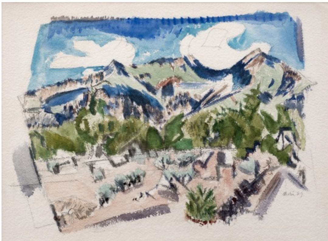
Fig. 3. John Marin, Peisaj din Taos, acuarelă, The Tia Collection, Santa Fe.