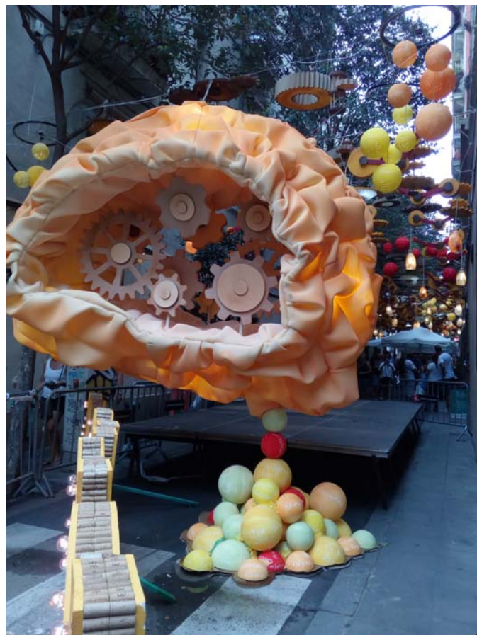
Fig. 2. Fiesta de Gracia 2017 – Mecanismul gândirii.