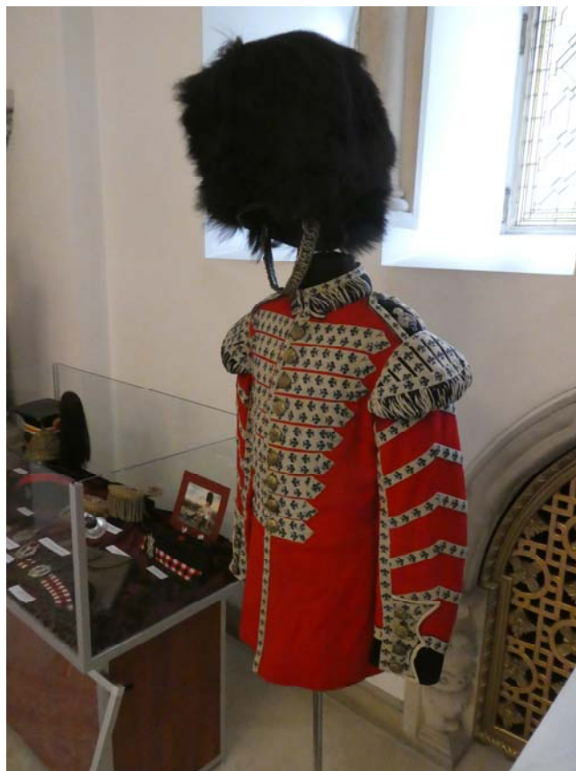
Fig. 10. Uniformă de muzicant din Grenadier Guards, Marea Britanie.