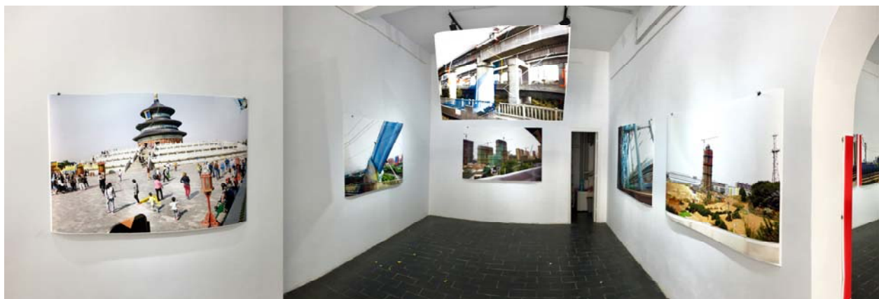
Fig. 6. Imagine panoramică în prima sală.