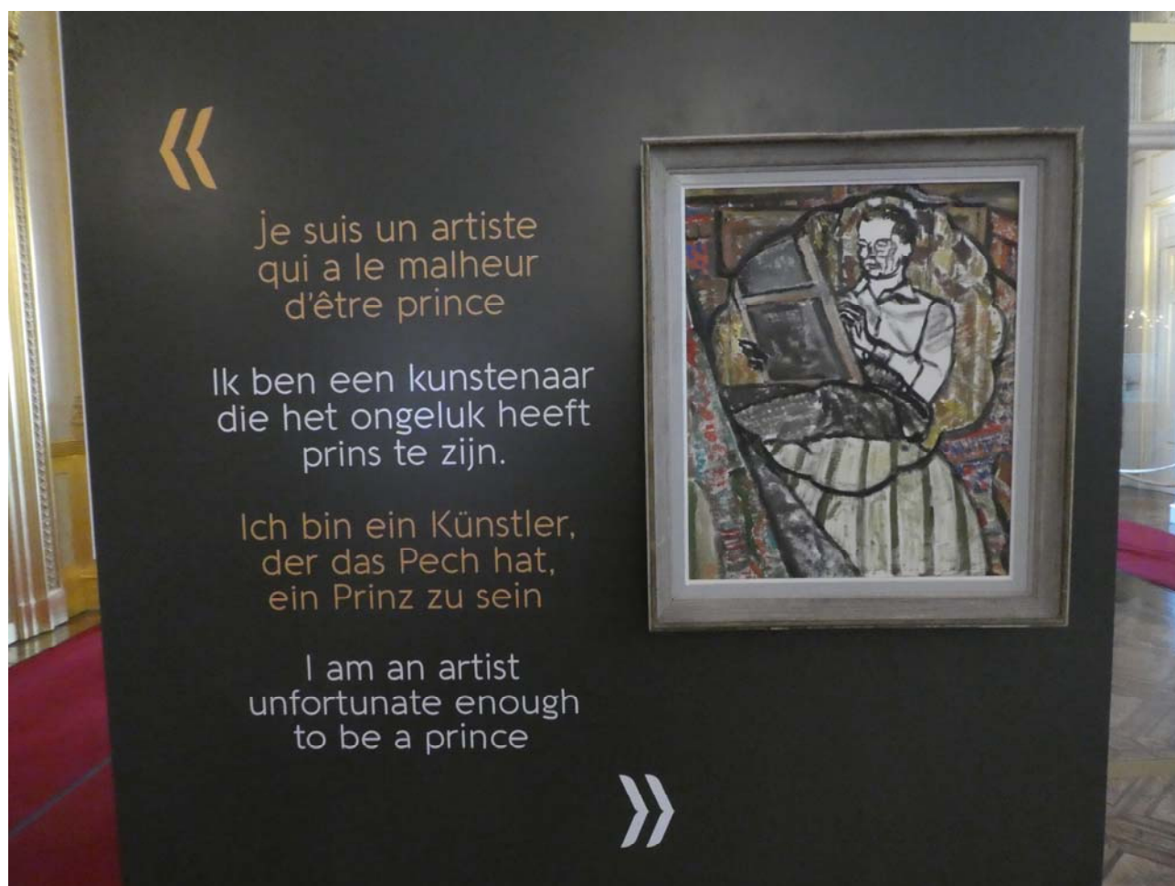
Fig. 4. Autoportret și panseu al artistului.

După o viață de militar și om de stat angajat în administrarea țării sale în vremuri de restriște, pictura a venit ca o eliberare de toate convențiile politico-diplomatice și ale protocolului riguros al curții. Prințul Charles s-a abandonat creației artistice și a lăsat o operă pe care ar putea-o invidia chiar plasticienii profesioniști. În a doua parte a vieții s-a considerat doar pictor și regreta ca trebuia să poarte încă povara sângelui albastru al nașterii sale, atunci când mărturisea: „Sunt un artist care are nefericirea de a fi prinț” (Fig. 4).