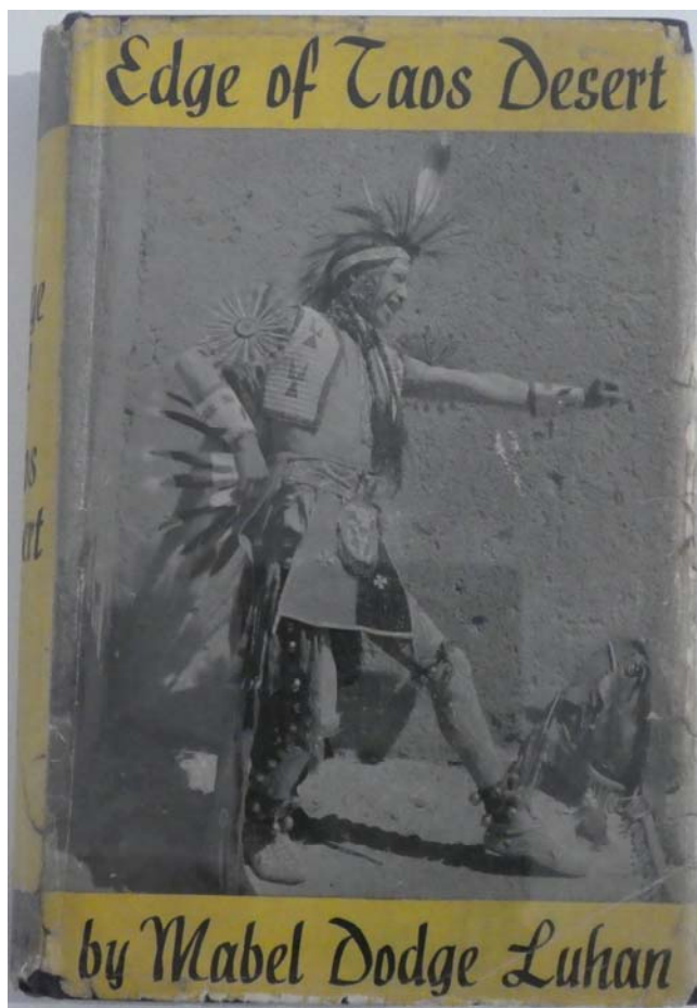
Fig. 6. Coperta cărții Edge of Taos Desert de Mabel Dodge Luhan (Harcourt, Brace and Co, New York 1937).