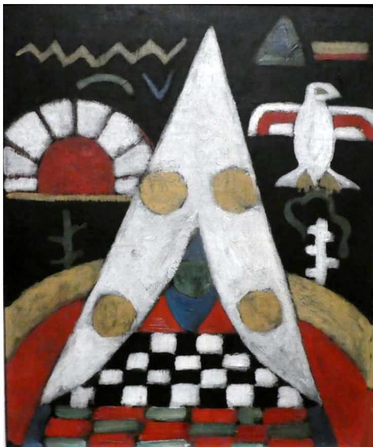
Fig. 4. Marsden Hartley, Un aranjament abstract al simbolurilor amerindiene, ulei pe pânză, Yale Collection of American Literature.