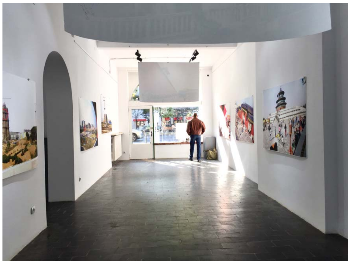
Fig. 2. Forbidden City, Red Triangle; Temple of Heaven.