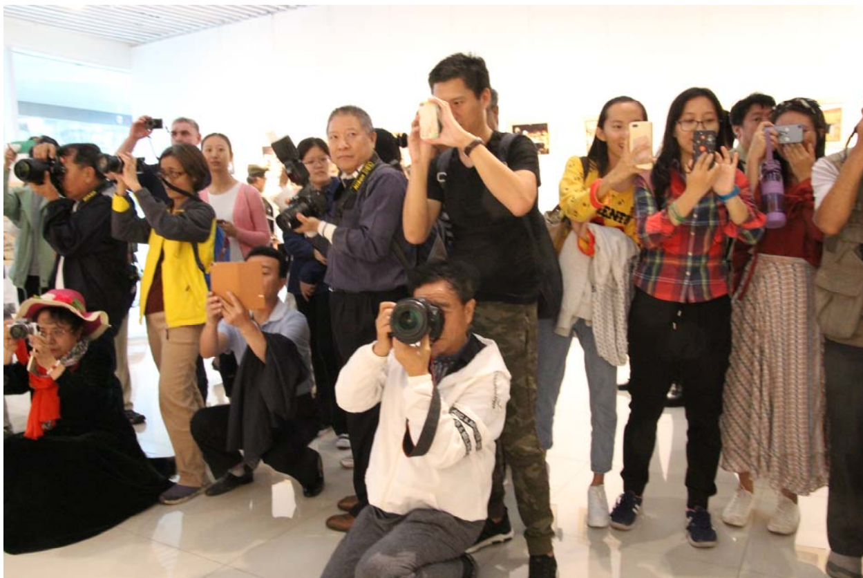
Fig. 2. Publicul chinez entuziasat la vernisajul expoziției.