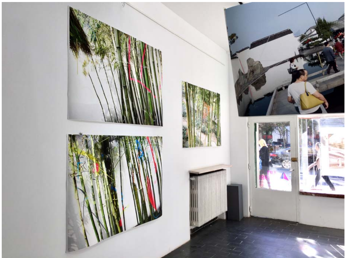
Fig. 5. Bamboo Red, City Museum, Suzhou.