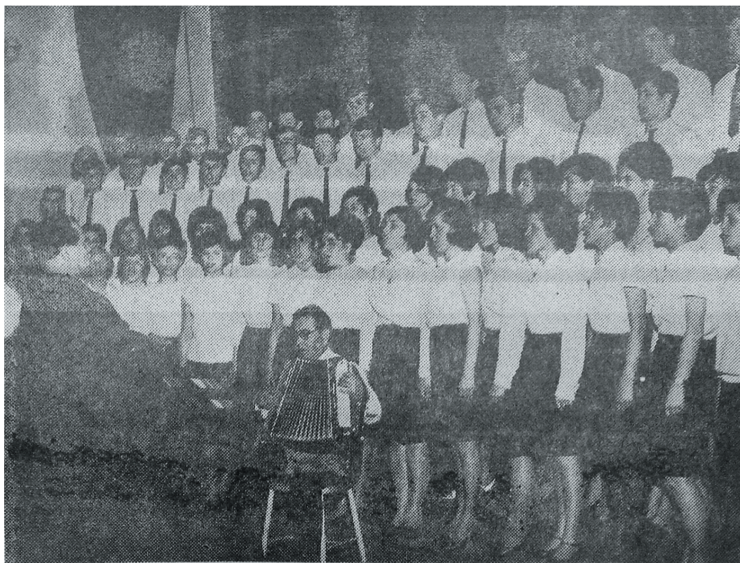
Corul Școlii de construcții.