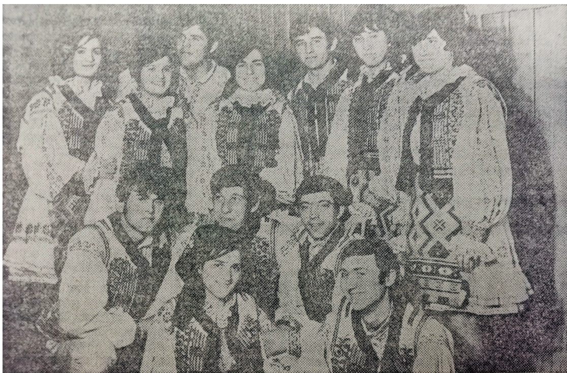
Echipa de dansuri populare a Clubului tineretului din Oradea, se bucură de o bună apreciere din partea publicului din satele bihorene...