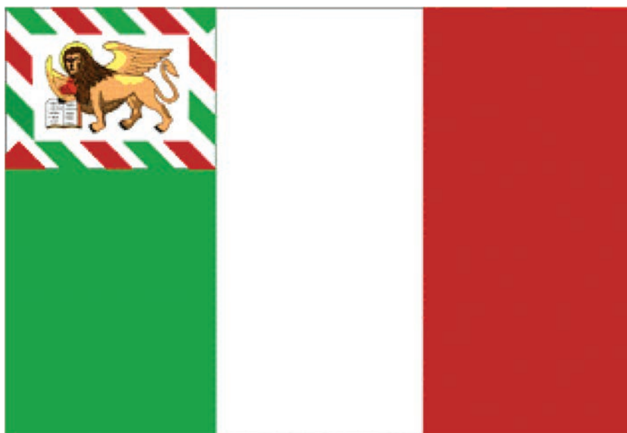
Bandiera della Repubblica di S. Marco, 1848-1849

Key words: Venice, Risorgimento, Serenissima, I.R. Government, Kingdom of Italy.