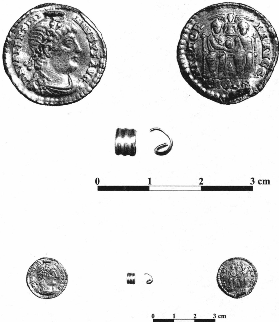
Pl. 3. Medalionul de aur de la Vâlcelele cu toarta aplicată