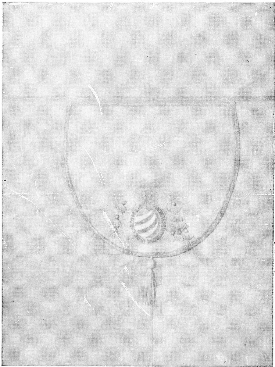
Fig. 3. Pluviala cardinalului Andrei Báthory (sec. XVI): — detaliu de restaurare: zona de mijloc a spatelui piesei cuprinzând porțiunea superioară, medalionul și mijlocul, după restaurare.