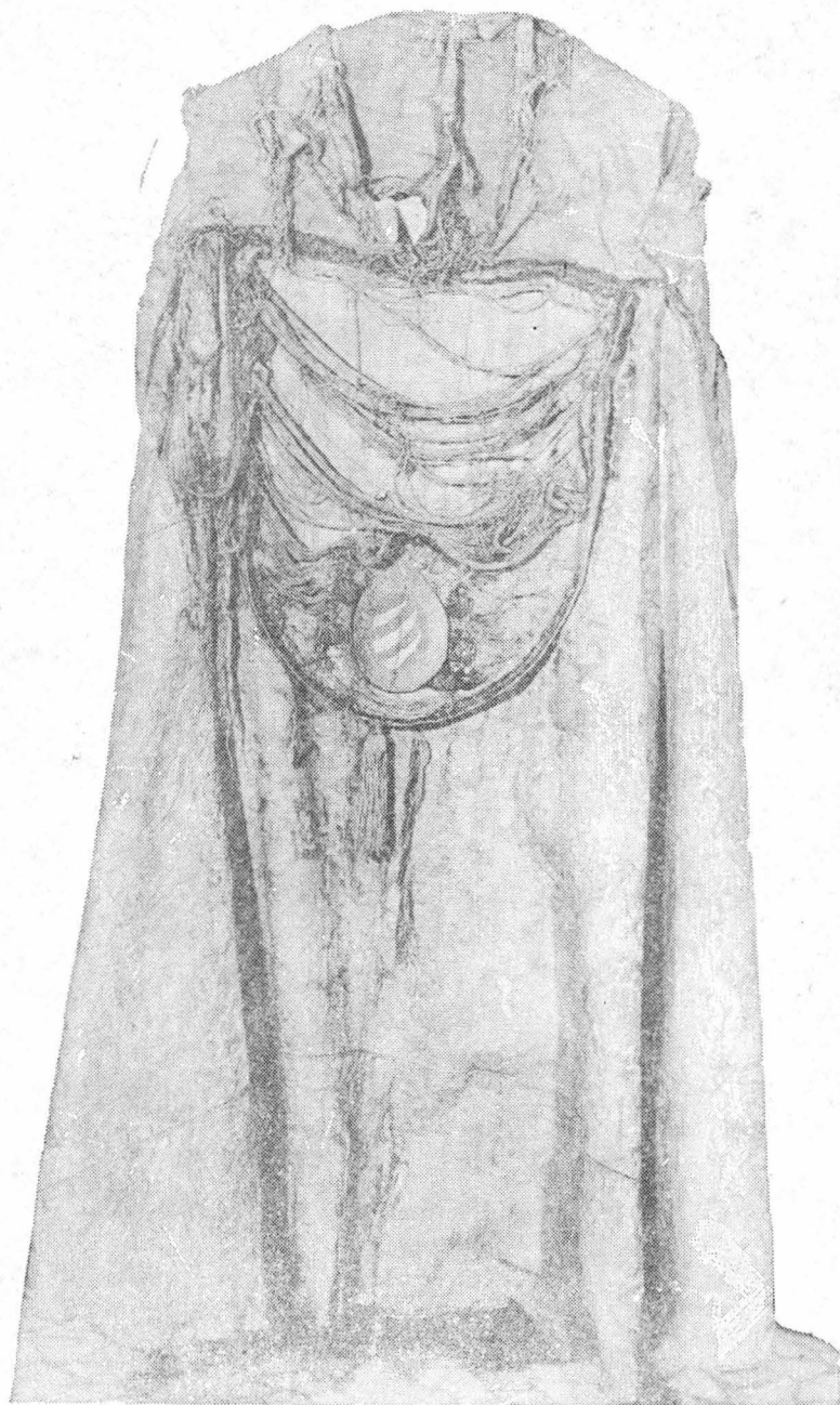
Fig. 2. Pluviala cardinalului Andrei Báthory (sec. XVI): — ansamblu spate, înainte de restaurare.