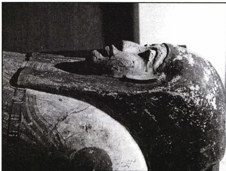
Mumie egipteană cu sicriu din lemn. Capacul sicriului. Momie égyptienne avec cercueil de bois. Le couvercle.

Dorind să atingă, ca principal obiectiv, trăirea unei experiențe colective în care reflecția să implice deopotrivă apropiatul culturii proprii și depărtatul etnologic, actualitatea și trecutul, încercând să formeze un public pentru un domeniu destul de puțin familiar, până în prezent, spațiului muzeistic din România, colectivul departamentului de etnografie universală propune vizitatorilor, deocamdată, un tip de expunere care nu șochează, dar care se detașează de stereotipii. Încă de la deschidere, în 1993, expoziția permanentă Din cultura și arta popoarelor lumii , relua o selecție consistentă din piesele vechi, la care se adăugau și câteva piese din colecțiile recente, oferind spre vizionare într-un circuit în care cunoașterea Celuilalt se realizează prin sublinierea diferenței pe baza subiacentă a sesizării constantelor existenței umane, reușind astfel exotizarea și asimilarea în interiorul aceleiași compoziții vizuale.