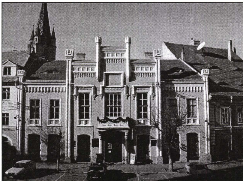
Sediul Muzeului de Etnografie Universală „Franz Binder” Le siège du Musée d’Ethnographie «Franz Binder»