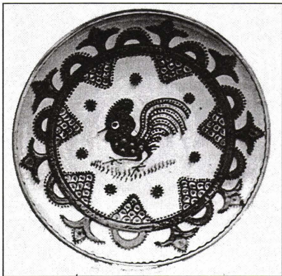
Farfurie - „taier” decorată cu simbolul specific centrului de olărit Horezu, Plate - „taier”, decorated with the rooster, the specific symbol of Horezu Ceramics Centre

Spre deosebire de alte meșteșuguri populare care se practică oarecum izolat, individual, așa cum se întâmplă cu fierăritul sau țesutul, olăritul implică gruparea meșterilor în anumite centre, a căror așezare este determinată, în primul rând, de existența unor surse de argilă de calitate superioară, iar în al doilea rând, de împrejurările social-economice care să îngăduie formarea unei piețe, ca debușeu stabil producției de vase. Ținând cont de numărul destul de mare al centrelor de olari, îndeletnicirea străveche a olăritului, a rămas și azi un fenomen social și economic important în viața rurală românească.