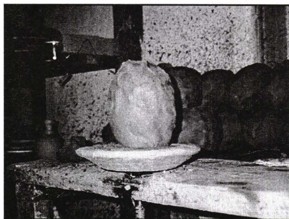
Bulgare de lut (fază de lucru), Ball clay (work stage).

Nu există mărturii istorice privind începutul meșteșugului practicat la Horezu, cel mai probabil acest centru a fost întemeiat prin grija aceluiași domnitor de a aduce aici câțiva olari așa cum s-a făcut și în altă parte. Originea acestor olari nu este cunoscută, însă meșteșugul lor dovedește o vădită înviorare a motivelor și o perfecționare a tehnicii. Ceramica hurezeană are un aspect specific ce ne face să ne gândim la ceramica orientală, care, începând din secolul al XVI-lea a fost importată masiv în țara noastră. „Sub impulsul olăriei orientale care era adusă pentru nevoile unei curți rafinate, olarii de la Hurezu, au căutat să imite vasele străine, decorându-și cu multă îngrijire marfa lor” 1 . În săpăturile făcute la palatele lui Constantin Brâncoveanu s-au găsit cele mai vechi vase de Horezu, lucrate cu procedeele folosite până azi și decorate cu motivele specifice produselor contemporane ale Horezului. Astfel, elementele tradiționale, formele și motivele vechi s-au păstrat în decursul vremii și se regăsesc în cele mai frumoase produse ale centrului. 2