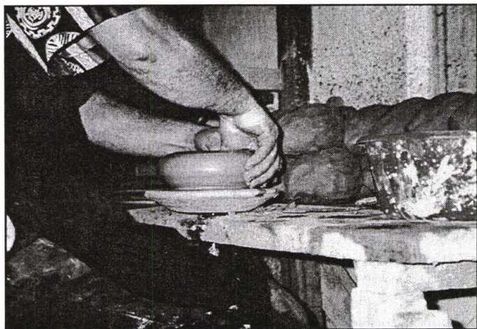
Modelarea vasului pe roata (fază de lucru) Making a pot (work stage)