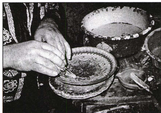
Deorarea cu cornul Process of decoration with the corn

Astăzi se poate observa în ceramica de Horezu, pe de o parte păstrarea filonului tradițional, prin confecționarea unor categorii de vase cu forme și ornamente „din bătrâni” (străchinile și taierile amintite). Producția tradițională mai cuprinzând și o varietate de câni și de cești, ghivece de flori, solnițe, ulcioare și ciorbalăce. Pe de altă parte, se pot observa forme nou introduse, aceasta funcție de influențele exercitate asupra meșterilor de aici precum și de imaginația fiecăruia. De asemenea, se înregistrează transformări funcționale ce constau din trecerea de la olăria cu caracter utilitar la cea cu un caracter decorativ. Atunci când obiectul a ajuns la o valoare artistică maximă, folosința sfârșește prin a fi pierdută din vedere, el devenind strict decorativ. Străchinile și taierile de Horezu, frumos împodobite, și-au pierdut cu totul funcția utilitară în favoarea celei estetice.