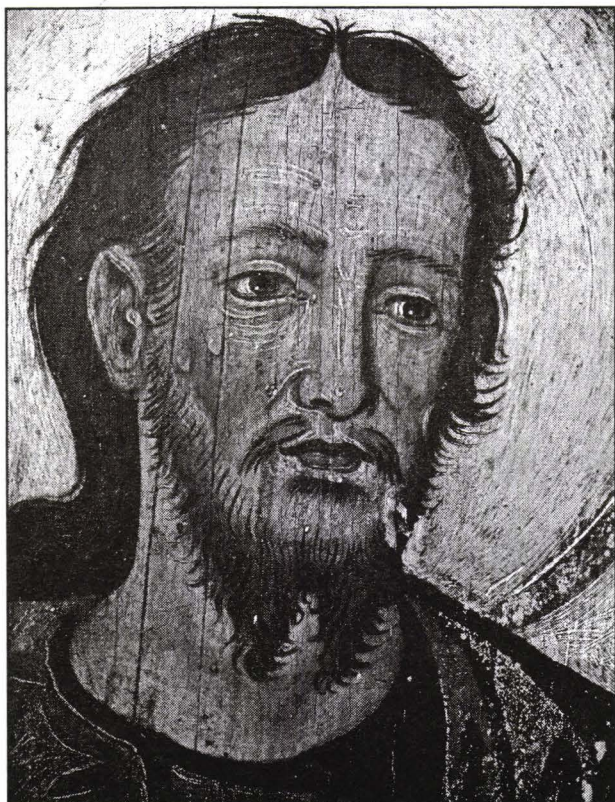
Sfântul Ioan Botezătorul – Iconostasul Bisericii de la Strungari, județul Alba.

Așadar, Muzeul „ASTRA”, la aniversarea Centenarului – 1905-2005, se deschide asemenea unei cărți vechi, cu un parfum seniorial de drumuri lungi de cultură și civilizație, cu ample pagini de artă autentică românească, incandescente prin valoarea inestimabilă a patrimoniului dăruit imaginii .