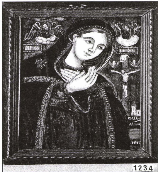
„Maica Domnului Îndurerată”, icoană pe sticlă, Țara Făgărașului. Colecția Muzeului ASTRA.

Gestul în icoana pe sticlă transilvăneană este extrem de puternic în sugestie, elocvent în discursul imaginii.