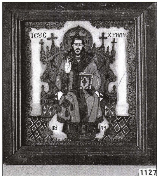
„Iisus Hristos pe Tron, Binecuvântând”, Țara Făgărașului, icoană pe sticlă. Colecția Muzeului ASTRA.

Din valoroasa colecție de icoane pe sticlă a Muzeului „ASTRA”, născută de Cornel Irimie și continuată de Corneliu Bucur, am ales doar cinci icoane pictate pe sticlă, aparținând tezaurului de obiecte de cult, pe care aş dori mult să le ofer citirii interdisciplinare, pornindu-se de la un singur amănunt, aparent insignifiant, din discursul tematic iconografic al fiecăreia.