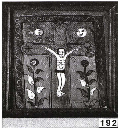
„Răstignirea Lui Iisus Hristos”, icoană pe sticlă, Nicula. Colecția Muzeului ASTRA.

Simbolurile, din această icoană, ce se pot sinapsa axiologic, sunt mâinile rugându-se, crucificate pe negrul mapharionului și crucea, însângărată, împreună cu aripile deschise ale îngerilor primitori. Însuși trupul Maicii Domnului este asemenea unei cruci sacrificate în sine, cu durerea lumii purtate, introvertite, tocmai reversul deschiderii dăruitoare a crucificării Mântuitorului. Mâinile ridicate în rugăciune, păstrătoare de mister dumnezeiesc, ating, expresiv, arhitectura bisericii. Ne amintim de frumoasa întrupare a ideii de catedrală în sculptura lui Auguste Rodin.