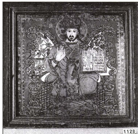
„Iisus Hristos pe Tron, Binecuvântând”, icoană pe sticlă; Țara Făgărașului. Colecția Muzeului ASTRA.

În icoana cea de-a doua, aleasă analizei semiotice, pictată specific școlii Țării Făgărașului și fiind periodizată în secolul al XIX-lea (cu nr. inv. 1128 - O.C.), în care este imaginată aceeași tematică iconografică, cea a „Mântuitorului pe Tron, Binecuvântând”, apare, din nou, simbolul plin de substanță ideatică al tronului împărătesc. De data aceasta, tronul este reprezentat într-o altă manieră, cu elemente decorative mai ample, asemenea unor aripi îngerești. Astfel, Învățătorul Dumnezeiesc primește aripi albe, înflorate, decupate parcă din Grădina Paradisului. Iluzia creată este de deschidere a Cerurilor printr-un ochi de fereastră, observându-se Grădina divină.