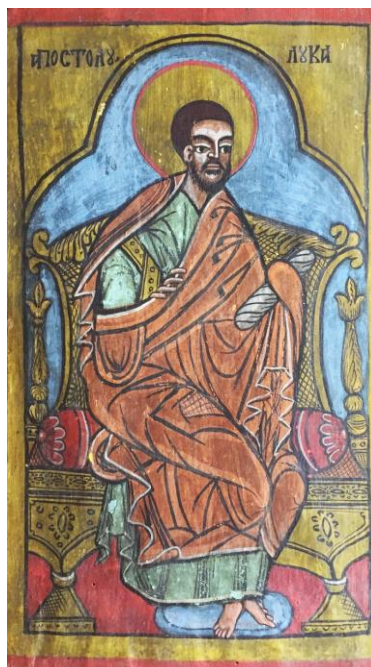
Sf. Apostol Luca