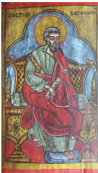
Sf. Apostol Vartolomeu