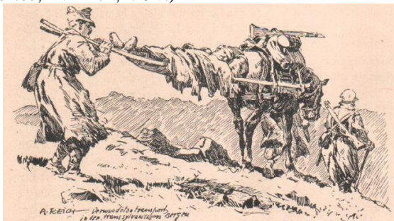
Anexa 2 - Brancardieri transportând răniții la posturile de prim-ajutor (reproducere după Albert Reich, Durch Siebenbürgen und Rumänien , s.a., p. 36)