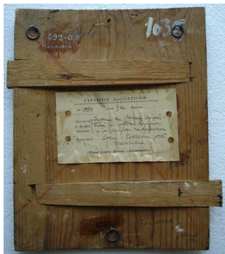
Verso înainte de restaurare