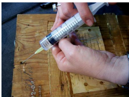
Degresarea orificiilor prin injectare