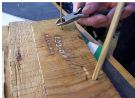
Completare cu cepuri de lemn