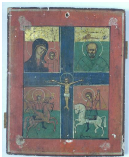
Ansamblu înainte de restaurare