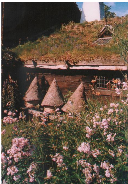
Skansen, Stupi tradiționali