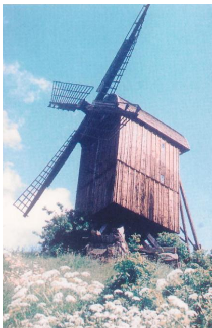
Moară de vânt la Helsingborg