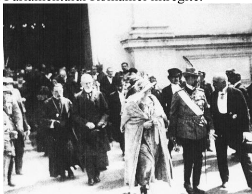
Foto 2. Regele Ferdinand, principesa Elisabeta și prim-ministrul Averescu ieșind din catedrala de la Cernăuți

Drumul spre catedrală, parcurs cu automobilul, în sunetul clopotelor, era frumos pavoazat cu flori, steaguri și covoare. Arcul de triumf ridicat în centrul orașului avea deasupra coroana României, iar alături de steagul românesc fluturau steagurile Marilor Puteri Aliate. În fața catedralei, regele Ferdinand I a fost întâmpinat de mitropolitul Vladimir de Repta, cel care a fost, în calitate de decan de vârstă, primul președinte al Parlamentului României întregite.