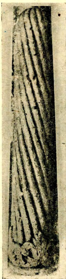
Fig. 1. — Fus de coloană.

și fosta casă Alexandrescu Cafegi-basa 1 , adică peste drum de dărâmata casă cu lanțuri, Cretzulescu, Cantacuzino, Moruzi, s'a găsit în pământ fusul unei