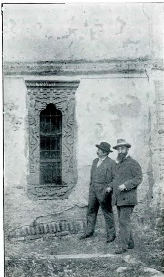
3. Chenar de fereastră de la biserica din Bordești

ricii din Bărbulețu, care, prin silueta ei plăcută și prin dispoziția ingenioasă a înveli-