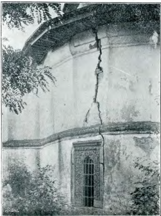
2. Biserica din Bordești.

pronaos. Scara este de lemn de stejar masiv și modul cum acoperișul ei se leagă cu acel al clopotniței contribuie a da o înfățișare foarte plăcută bisericii. Bisericele cu clopotnița peste pronaos sunt rare în Muntenia. Nu cunosc printre cele interesante decât cea dela Vlădești din Muscel și cea dela Vădeni din Gorj; dar aceste două biserici (a doua e monument istoric) sunt departe de a avea proporțiile fericite și aspectul pitoresc al bise-