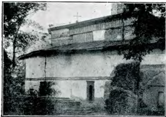
1. Biserica din Bordești.

toarei, capătă o înfățișare cu totul originală și unică în felul ei.