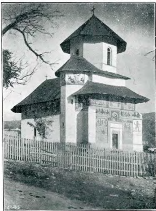
1. Biserica din Bărbulețu.

Biserica din sat este într'adevăr interesantă și cred că este din secolul al 17-lea; din nenorocire nu se găsește nici o inscrip-