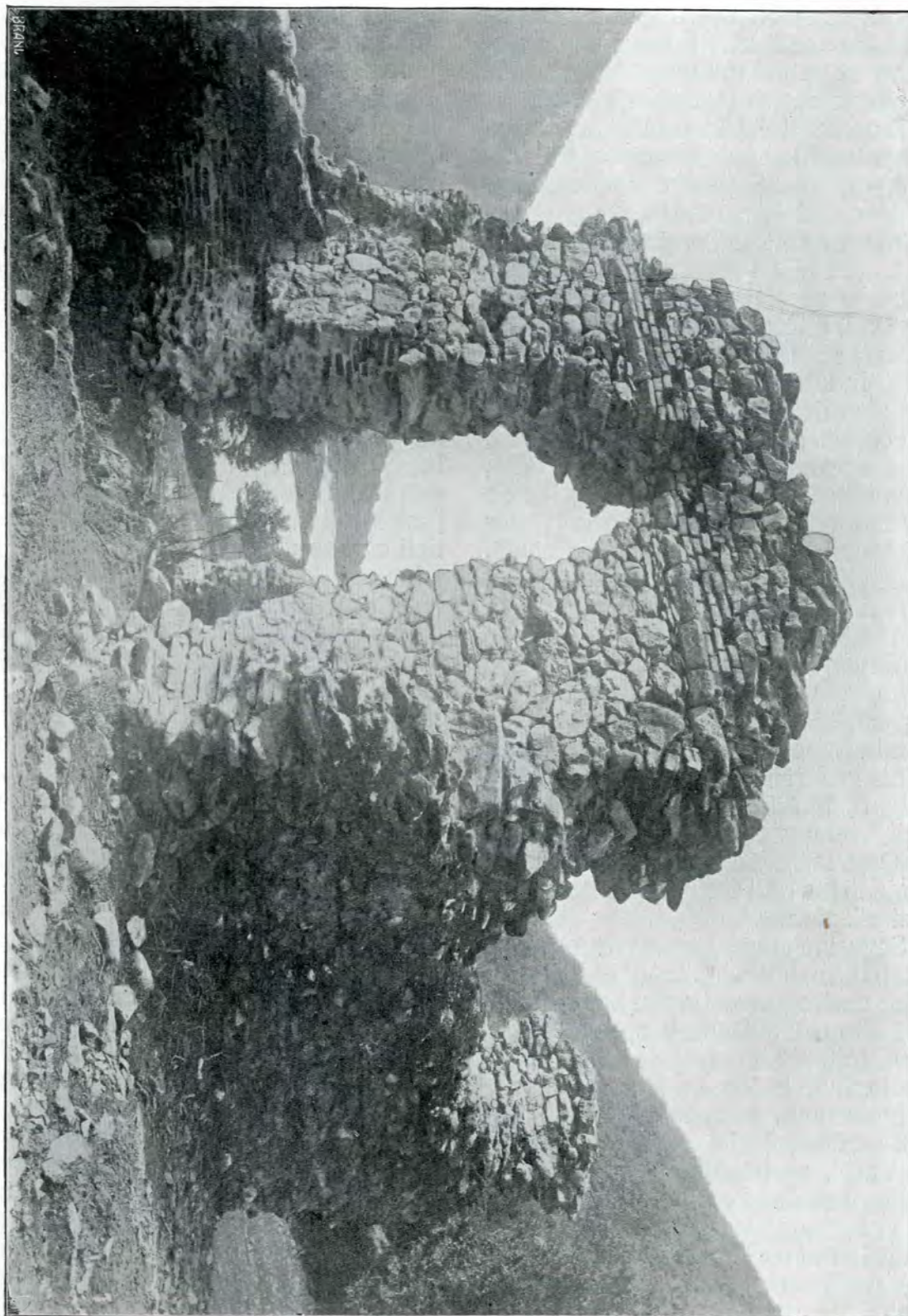
3. Vodita. Ruinele bisericii, vedere din față (vest), cu dărâmurile pridvorului și poarta.

O restabilire a vechiului feud în sensul acelei încercate de Sigismund,