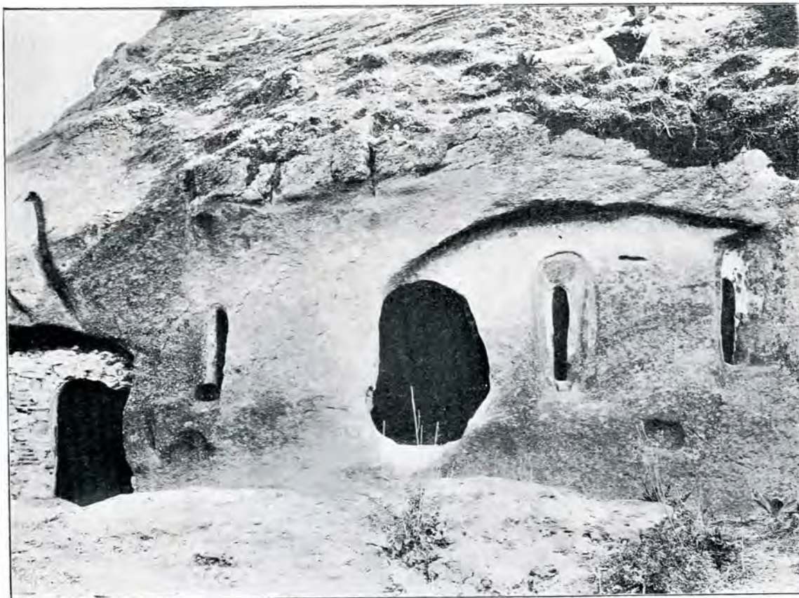
2. Biserica lui Negru-Vodă.

natural, unde colţii ce se ridică sunt paze naturale în contra oricărui atac, nu era ne-