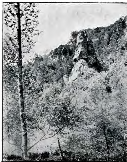
6. Colții Doamnei.

liberalism ce a trecut asupra țării noastre, când