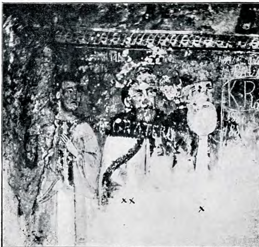
5. Ctitorii schitului Negru-Vodă : Io Radul Negru Voevod și Niculae Alexandru Voevod.

s'au întronat cuvinte ca cetățean ( citoyen ) odată cu introducerea la noi a frazeologiei