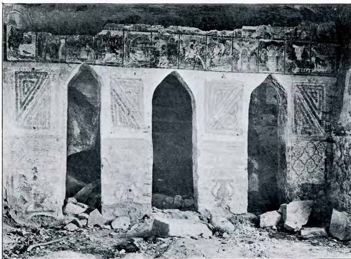
3. Tâmpla altarului românesc din interiorul bisericii lui Negru-Vodă.

Pictura este retușată. S'a trecut cu pensula peste cea vechie. Urme foarte frumoase