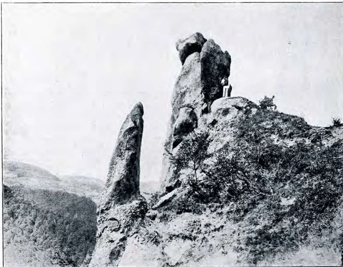
1. Colțul Bisericii.

Rucăr-Drăgoslave-Câmpulung-Mățau la Cetatea lui Negru-Vodă.