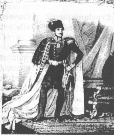
A.Kaufmann, Domnitorul Ghe. Bibescu, litografie, 1843

La București, în luna martie 1848, s-a instituit un prim Comitet revoluționar, din care făceau parte C.A.Rosetti, Ion Ghica, frații Golescu, Ion Voinescu II, având drept principal obiectiv, ca, până la sosirea revoluționarilor ce se aflau în strinătate, să întocmească un plan de acțiune.