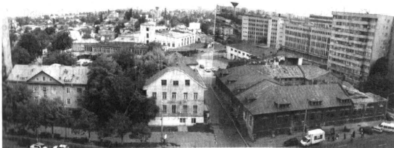
Fabrica „Stella” 2003