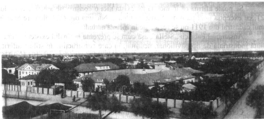
Fabrica „Stella” 1903