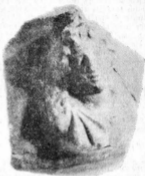
4. Toartă de vas cu o profomă antropomorfă.

acestei populații ritul de înmormintare preferat este cel al incinerății cu mai multe variante. Astfel la prima variantă: resturile cinerare erau depuse în urna special creată; în a 2-a variantă, resturile rezultate din arderea defunctului se puneau direct în groapă, iar ultima variantă se caracterizează prin așezarea resturilor cinerare în groapă, acoperite cu un vas. În București primele două variante amintite au fost în egală măsură dovedite prin descoperiri: la Dămăroala 34 unde s-au depistat două variante de incinerăție cu resturile rezultate din ardere, depuse direct într-o groapă de formă cilindrică. Spre deosebire de această situație la Tel și Popești-Leordeni 35 resturile rezultate din ardere au fost așezate într-o urnă funerară în jurul căreia se aflau vase adiacente. Încadrarea cronologică a tuturor locuirilor getice din București s-a făcut în cele mai multe cazuri pe baza ceramicii, sau în unele situații datorită monedelor, sau a fibulelor descoperite în complexe. Marea majoritate a așezărilor datează din sec. II—I î.e.n. Excepție de la această