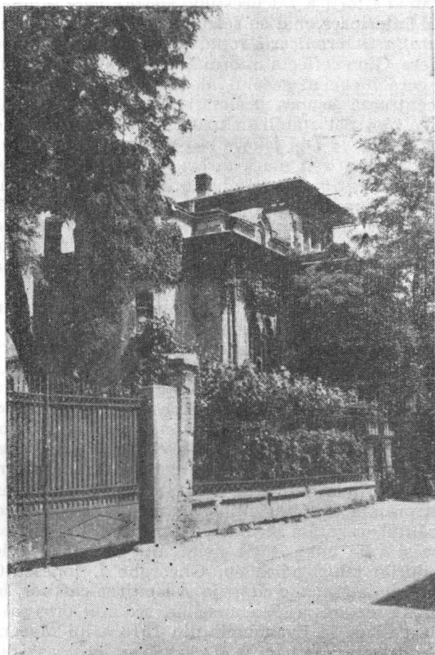
Casa din Str. Logofătul Udriște, 11, în care a locuit G. I. Ionescu-Gion

drept savanți, ceea ce (excluzînd pe D. Cantemir și pe Mavrocordați) nu-i decît o atitudine patriotardă. Aici e locul să amintim și de Doftoricescul meșteșug în trecutul țărilor române 1 , conferință în ton glumeț, dar plină