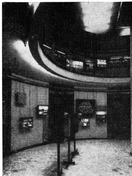
Vedere parțială a sălilor 4 și 5

rului de Interne în care prefectii județelor sînt chemați a sprijini loteria instituită ca urmare a unor mari incendii în cursul cărora se învederase dotarea cu totul insuficientă a pompierilor. Guvernul de atunci găsise deci soluția problemei nu în alocări bugetare și în alte măsuri organizatorice, ci în apelul la bunăvoința și buzunarele particularilor. Era evident, un paleativ. Așa se face că utilajul pompierilor folosit în ajunul celui de al doilea război mondial reprezenta o alcătuire pestriță în care ponderea principală aparținea pompei manuale Knaust model 1882, pompei cu aburi Merryweather model 1895, ca și primelor tipuri auto, învechite, ale firmei Magirus din Ulm. Dealtfel, prima auto-pompă cisternă fusese adusă în țară abia în august 1923. Pe străzile orașelor circulau, pînă spre 1930, sacagii, secundanți ai pompierilor la incendii.