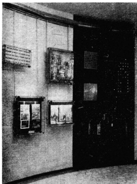
Aspect din sala 6

valoare tocmai această idee fundamentală : pe de-o parte bravura și sacrificiul eroic al pompierilor, pe de o altă parte incapacitatea și dezinteresul regimului capitalist-moșieresc pentru o organizare a prevenirii și lichidării incendiilor care să corespundă noilor cerințe ale dezvoltării urbanistice și, se poate adauga, noilor posibilități bugetare ale statului. Între alte documente expuse în această sală, există și o circulară din decembrie 1926 a Ministe-