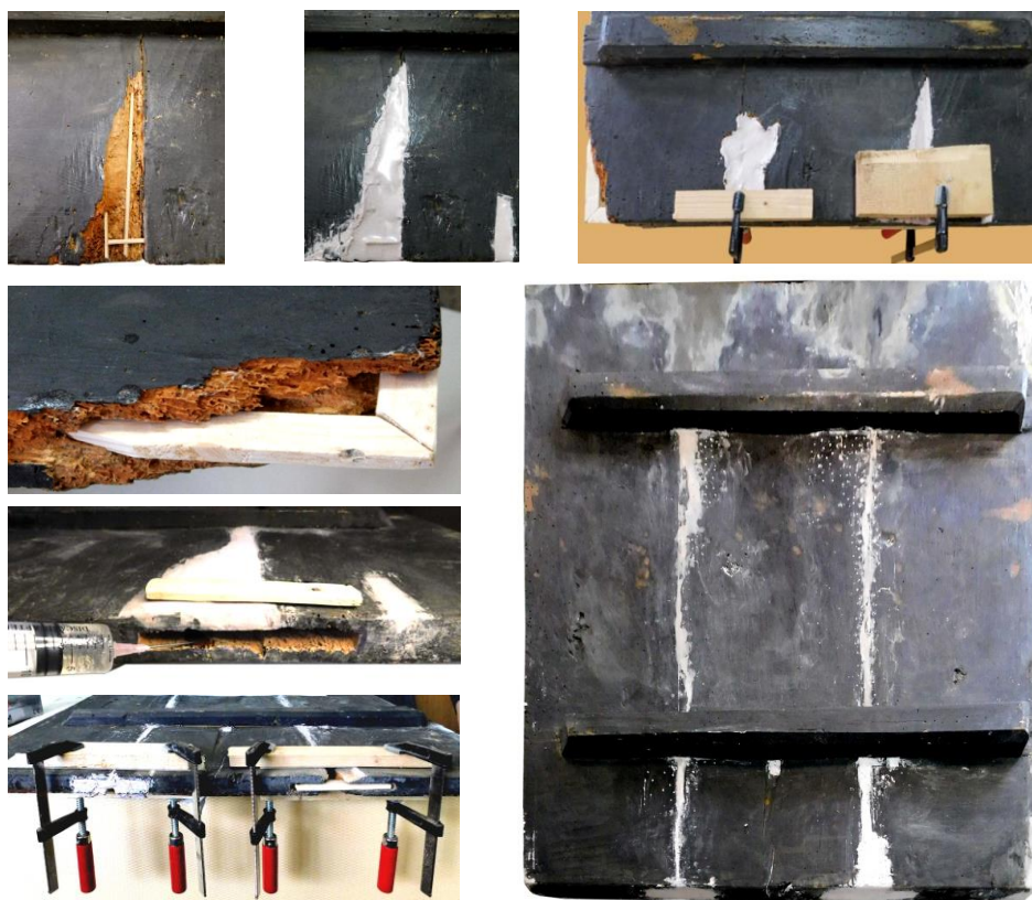
Fig.6. Etapele de consolidare și de completare a zonelor lacunare de la nivelul blatului.