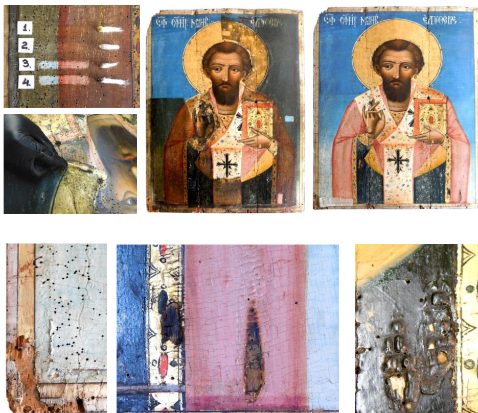
Fig.4. Aspecte din timpul etapei de curățare a suprafeței picturale.