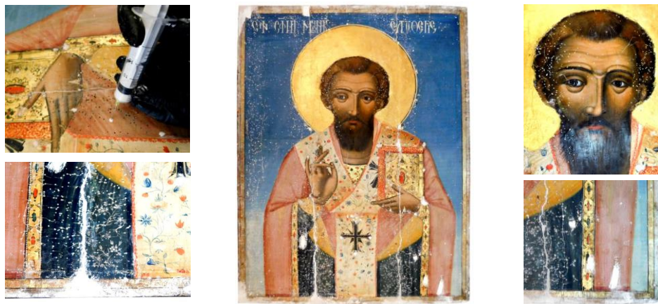
Fig.7. Aspecte din timpul realizării etapei de completare a stratului de grund.