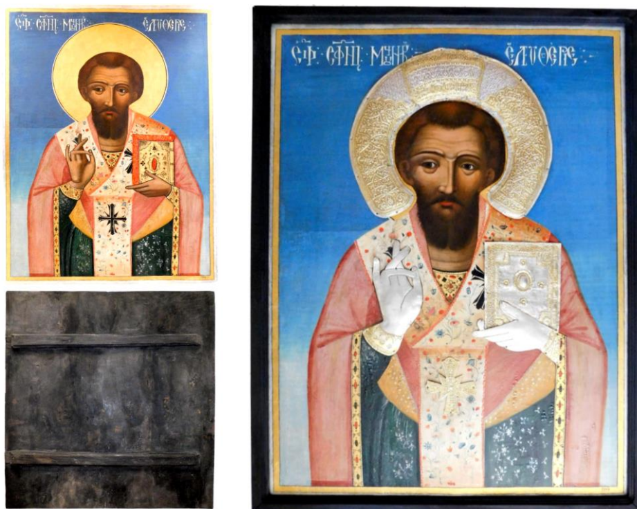
Fig.8 Aspectul icoanei după efectuarea etapelor de integrare cromatică și de aplicare a peliculei de verniss.