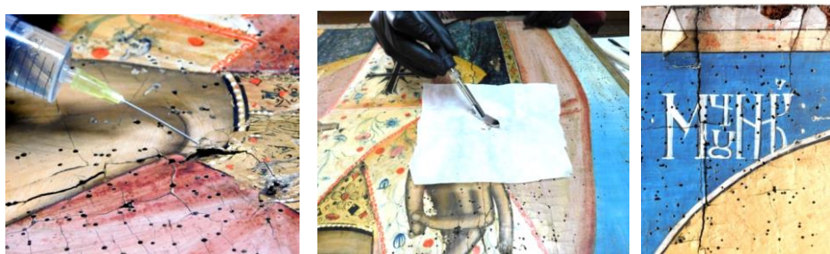
Fig.5. Etapa de re poziționare a stratului pictural desprins.