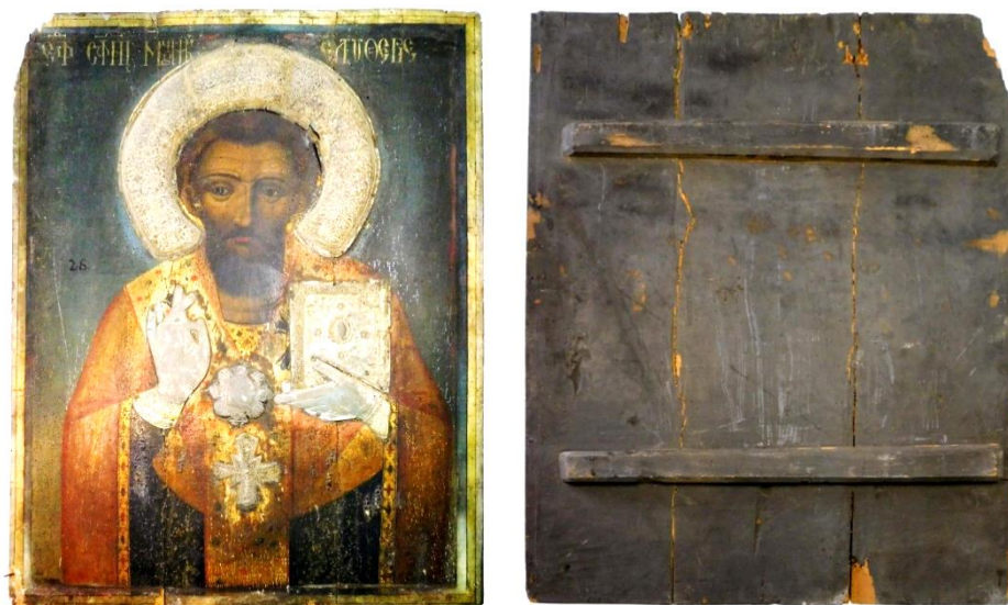
Fig. 1. Icoana împărătească, ansamblu față/verso, înainte de restaurare.

Operațiunea finală care a dus la încheierea tuturor intervențiilor de restaurare, a constat în repoziționarea celor șase elemente ale ferecăturii din argint aurit pe suprafața icoanei. Cunoșcând faptul că structura internă a blatului, deși a fost consolidată prin tratamente succesive, nu prezintă suficientă rezistență mecanică pentru a permite manipularea piesei fără a fi tensionată, am considerat ca fiind necesară conceperea unei rame/suport care să preia toate sarcinile mecanice, inclusiv pe cele privind expunerea icoanei pe simeză/șevalet.