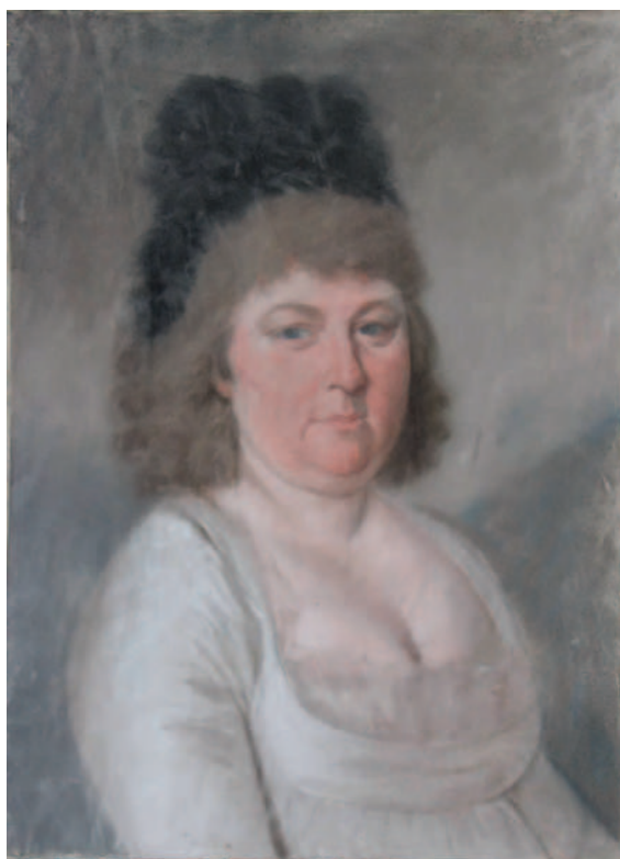
10. Femeie cu bonetă neagră / Woman with a black bonnet