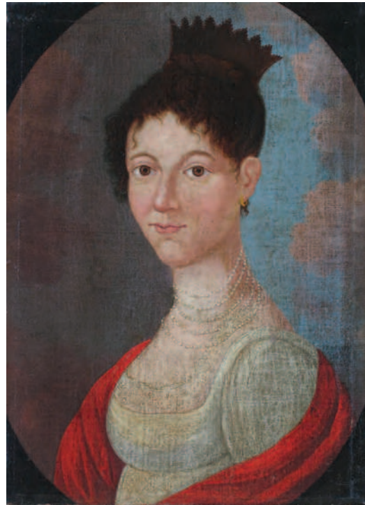
6. Femeie cu șal roșu / Woman with a red scarf