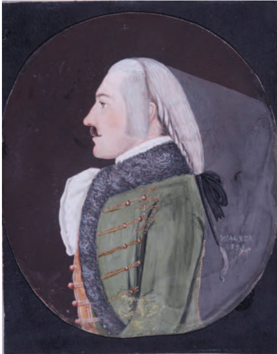
5. Tânăr cu perucă / Young man with periwig