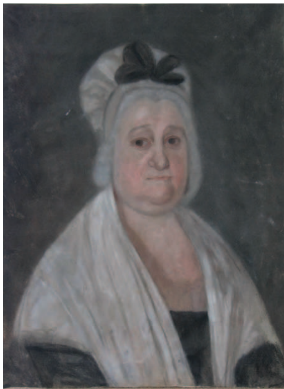
9. Femeie cu șal alb / Woman with a white scarf