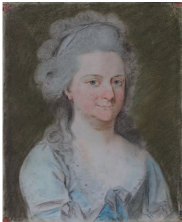
8. Femeie în gri / A gray dressed woman