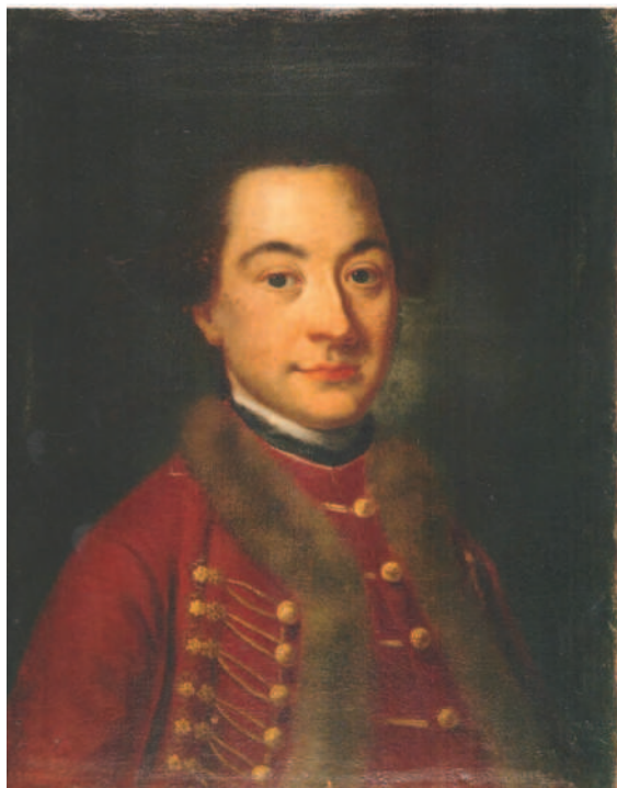
2. Tânăr în haine maghiare / Young man in hungarian costume