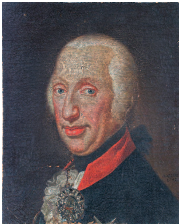
1. Portretul unui ofițer austriac / The portrait of an austrian officer