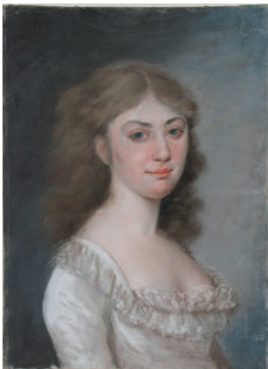
13. Portret de femeie / Portrait of a woman