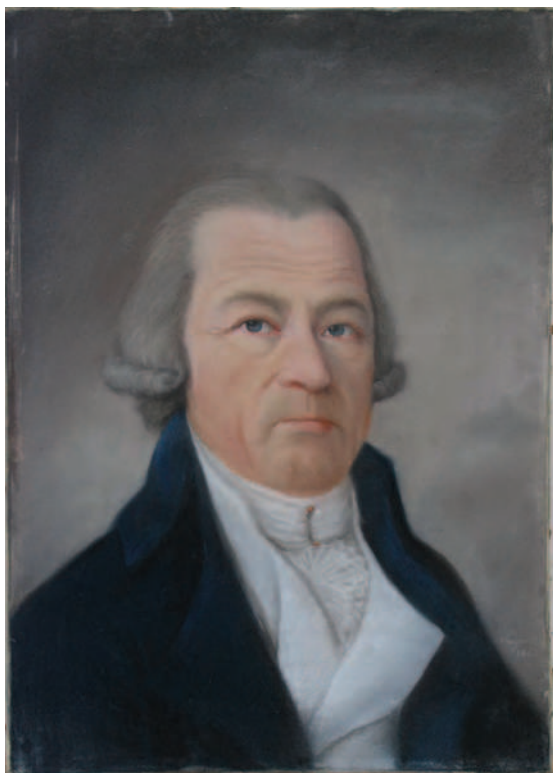
15. Bust de bărbat / Half-length man portrait