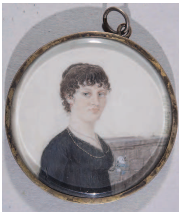
4. Portret de femeie / A female portrait