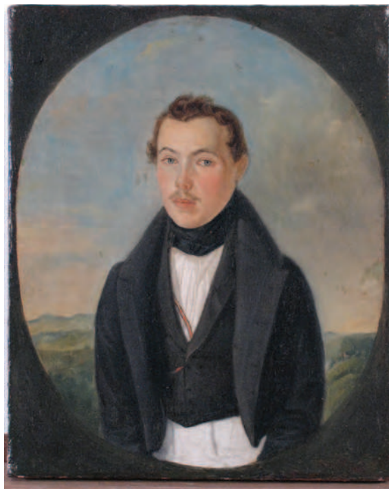
7. Portretul unui bărbat tânăr / The portrait of a young man