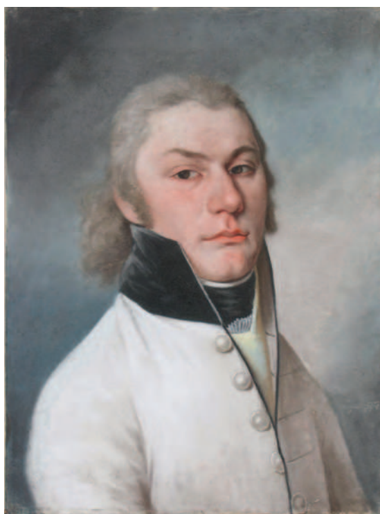
14. Portret de bărbat / Portrait of a man