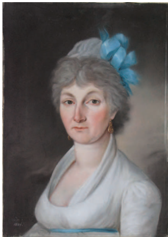
16. Bust de femeie / Half-length woman portrait