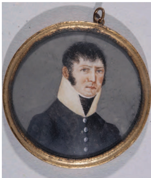
3. Un general austriac / An austrian general