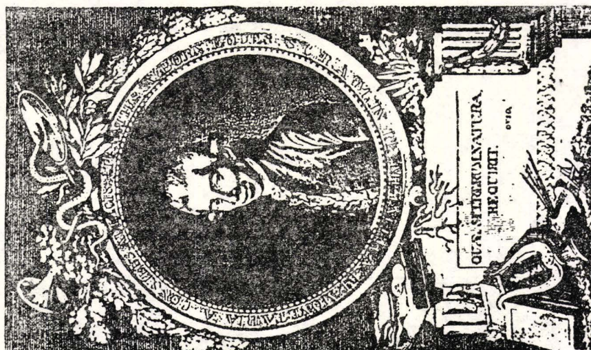
Fig. 2. 1. I. von Born — gravura de Iakob Adam (Vienna 1782); 2. Versiunea poloneză a pamfletului lui I. von Born „Specimina monachologiae”; 3. Tabelul I: categorii de călugări, ilustrate la pamfletul lui I. von Born