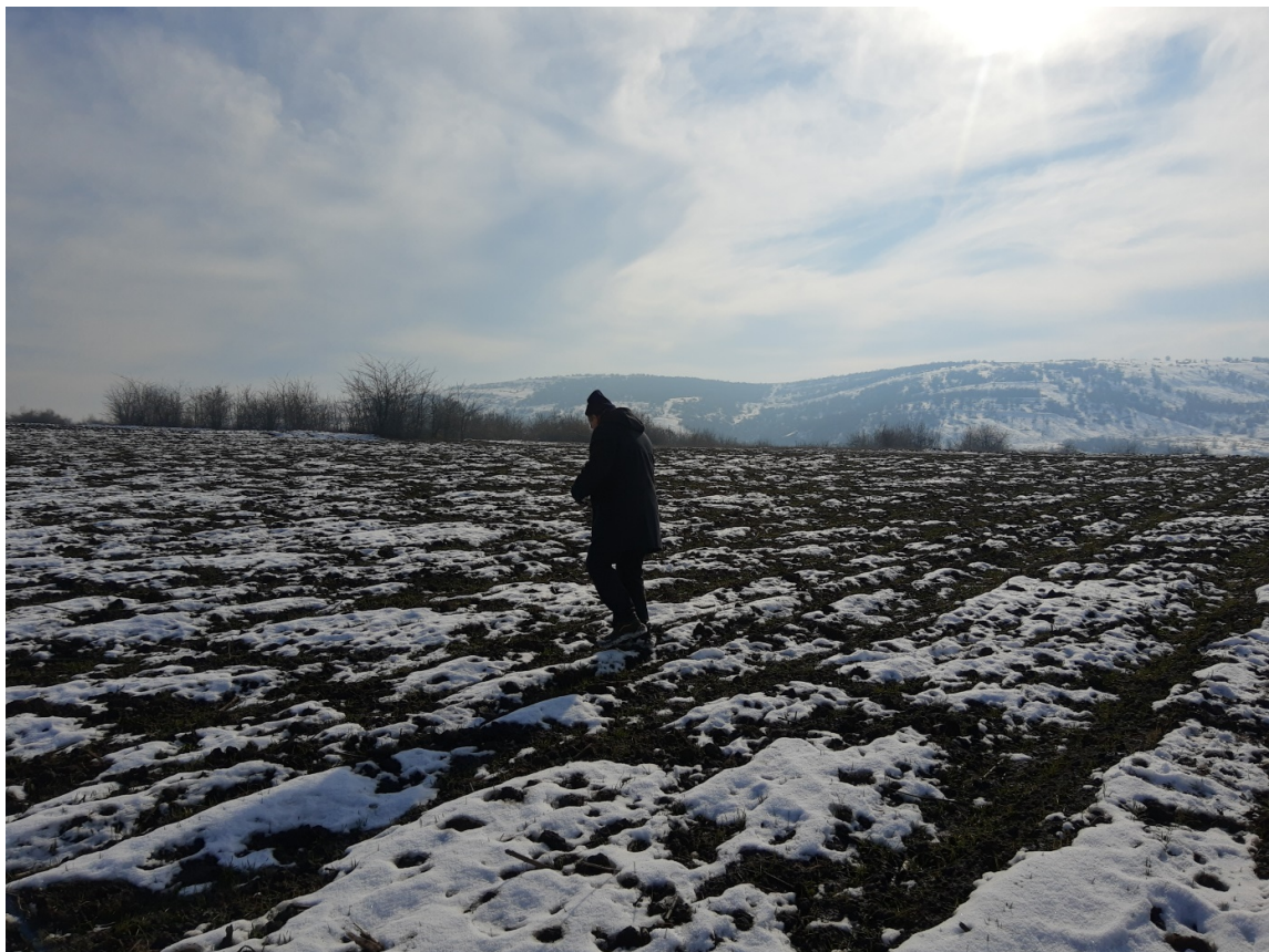
Pl. 17. Situl Stoîșești-„Răduleț”.