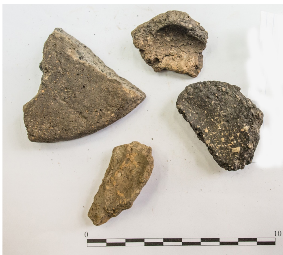
Pl. 16. Materiale descoperite în situl Țifu-„Scriptănești”.