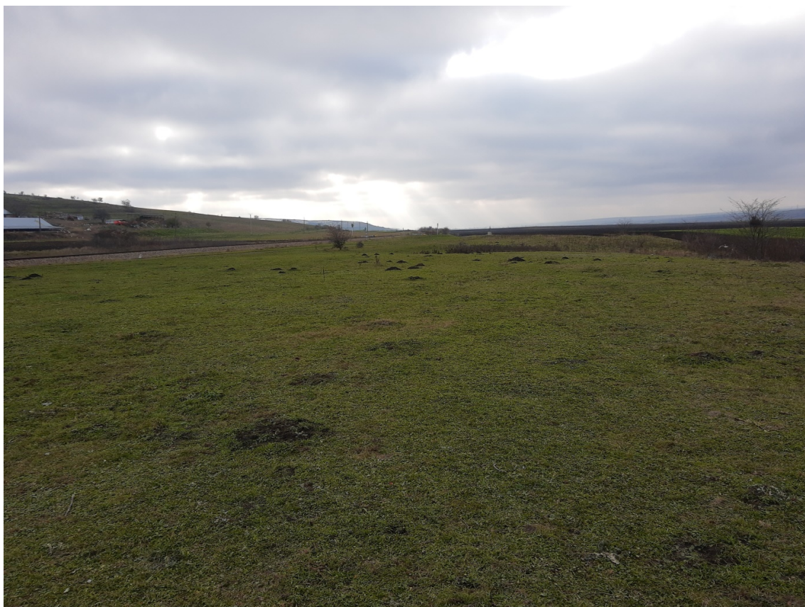
Pl. 10. Situl Gara Banca-„Magnina”.