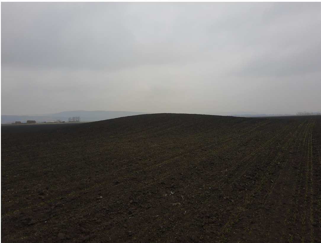
Pl. 24. Situl Sârbi-Tumul 2 „Arămoasa”.