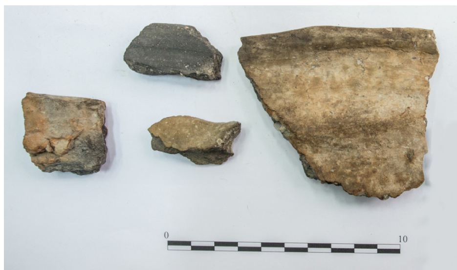
Pl. 11. Materiale descoperite în situl Gara Banca-„Magnina”.