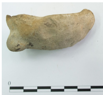
Pl. 21. Materiale descoperite în situl Ghermănești-„La Biserică”.