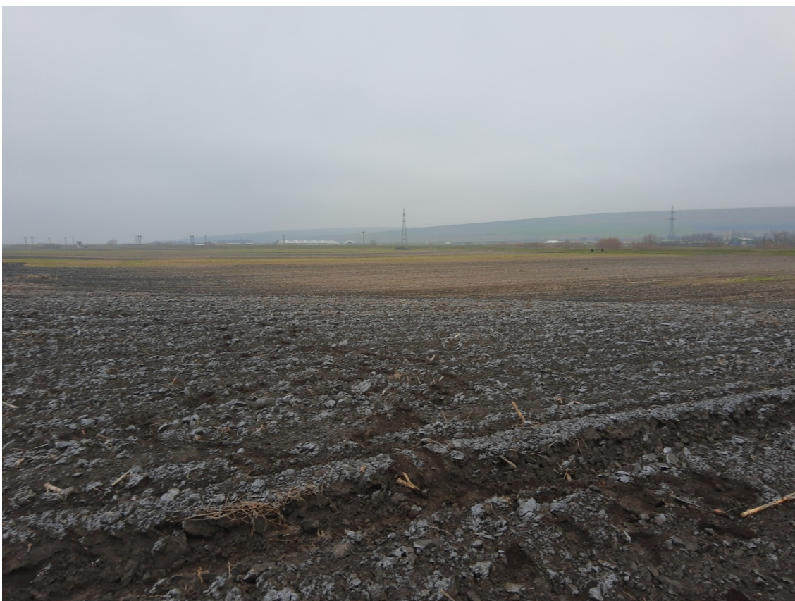
Pl. 3. Situl Gara Banca-„Șapte case”.