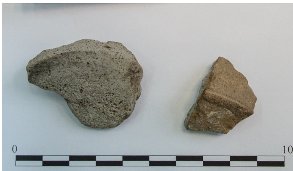
Pl. 7. Materiale descoperite în situl Sălcioara-„La Fermă”.