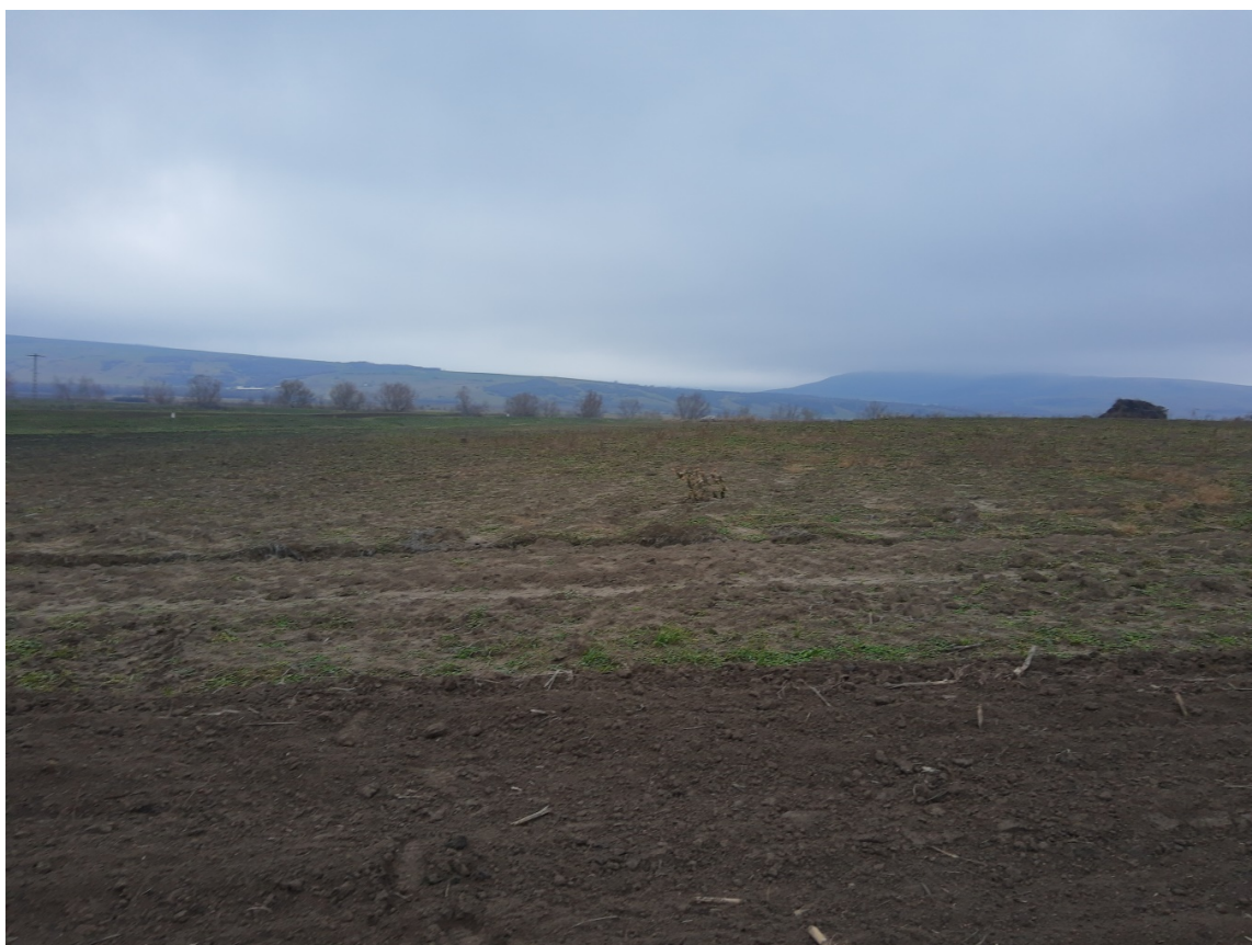
Pl. 6. Situl Sălcioara-„La Fermă”.