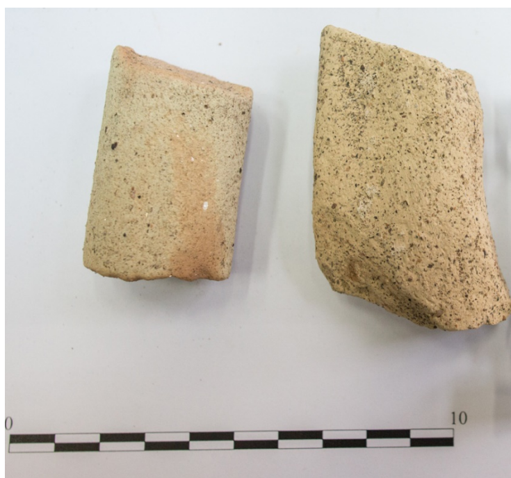
Pl. 20. Materiale descoperite în situl Ghermănești-„La Biserică”.