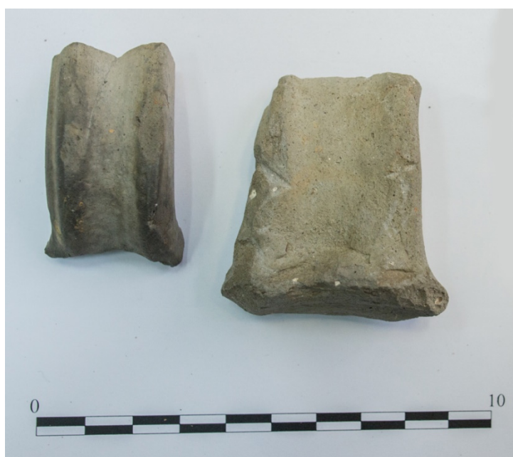
Pl. 14. Materiale descoperite în situl Banca-„Dealul Podișului”.