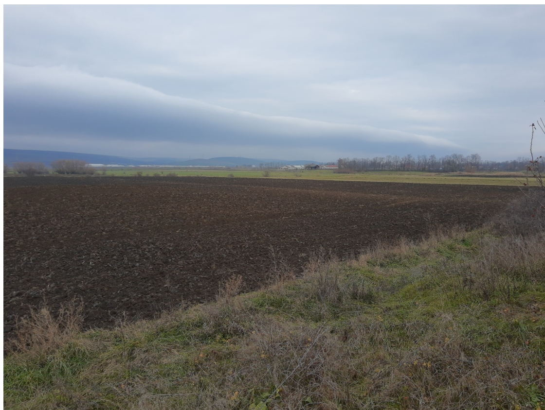
Pl. 22. Situl 1 Decembrie-Tumul „Petrișoara”.