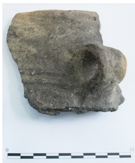
Pl. 9. Materiale descoperite în situl Gara Banca-„Gura Băncii”.