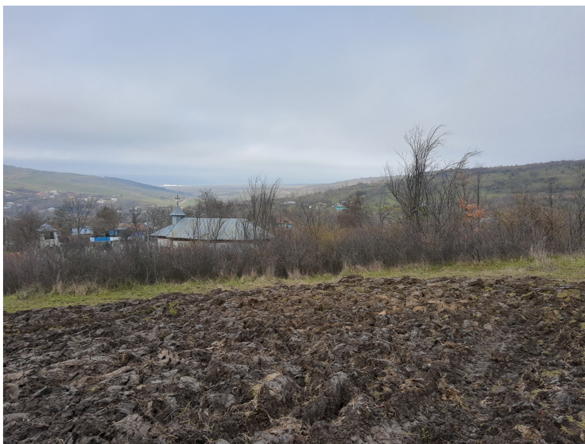
Pl. 19. Situl Ghermănești-„La Biserică”.