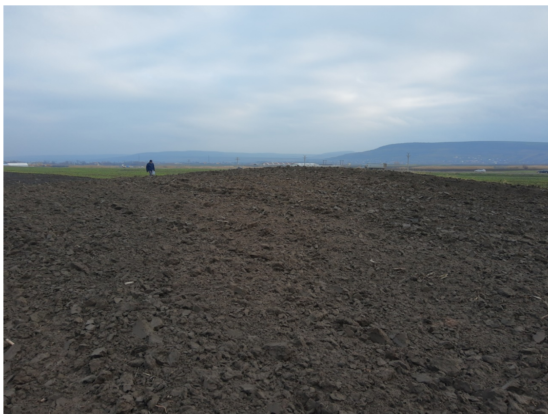
Pl. 5. Situl Tumulul de la Sălcioara – Lot 1-Tum 05.