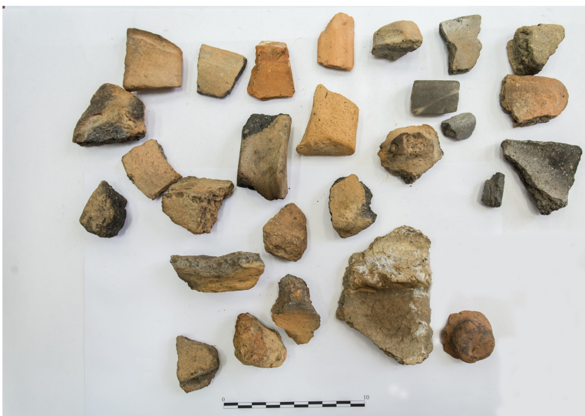
Pl. 18. Materiale descoperite în situl Stoişeşti-„Răduleţ”.