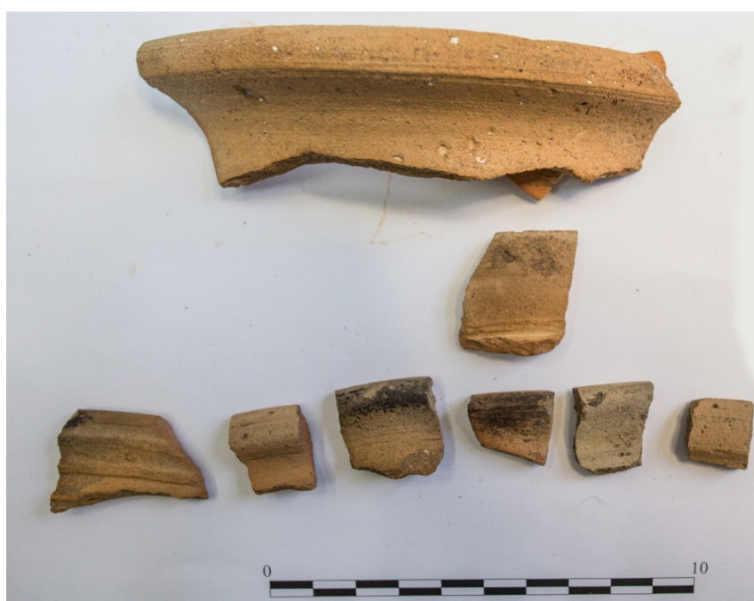
Pl. 13. Materiale descoperite în situl Banca-„Dealul Podișului”.