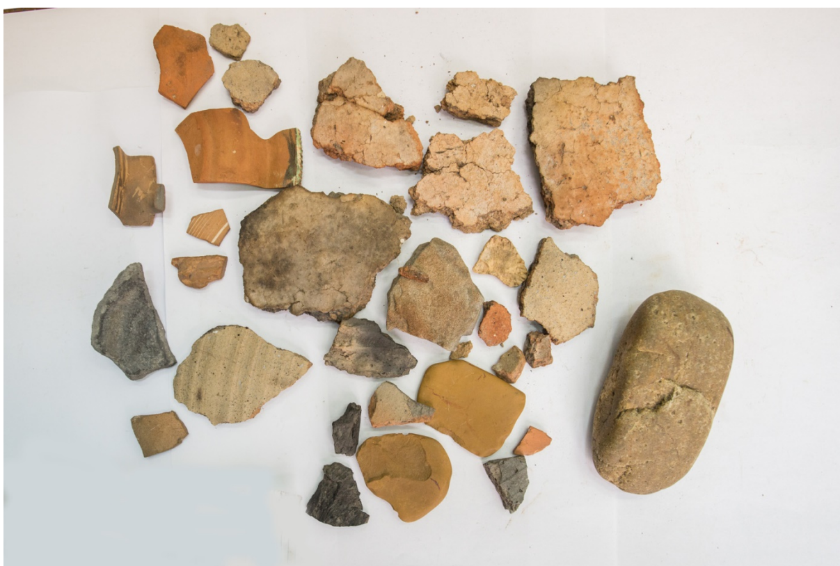
Pl. 4. Materiale din situl Gara Banca-„Șapte case”.