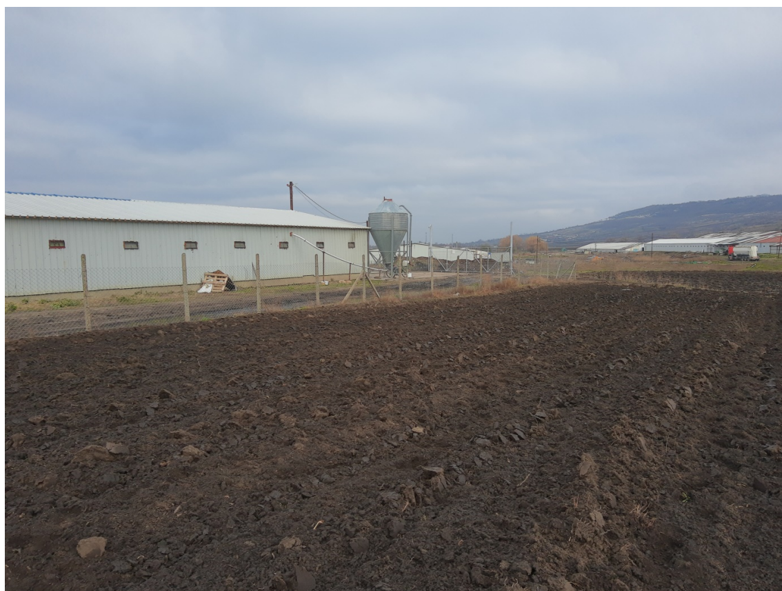
Pl. 8. Situl Gara Banca-„Gura Băncii”.