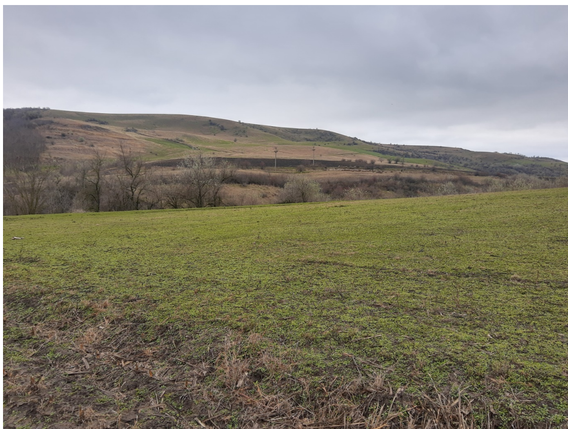
Pl. 12. Situl Banca-„Dealul Podișului”.