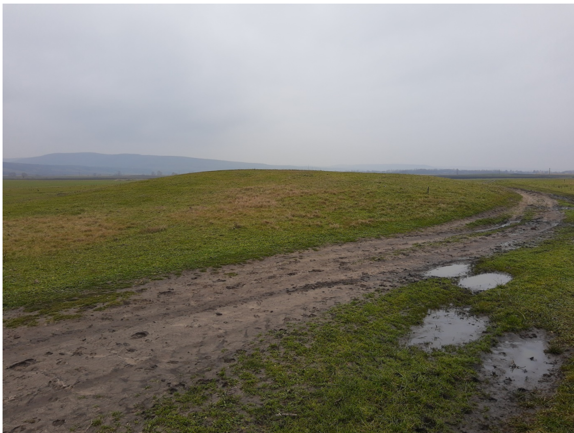
Pl. 23. Situl Sârbi-Tumul 1, „Arămoasa”.