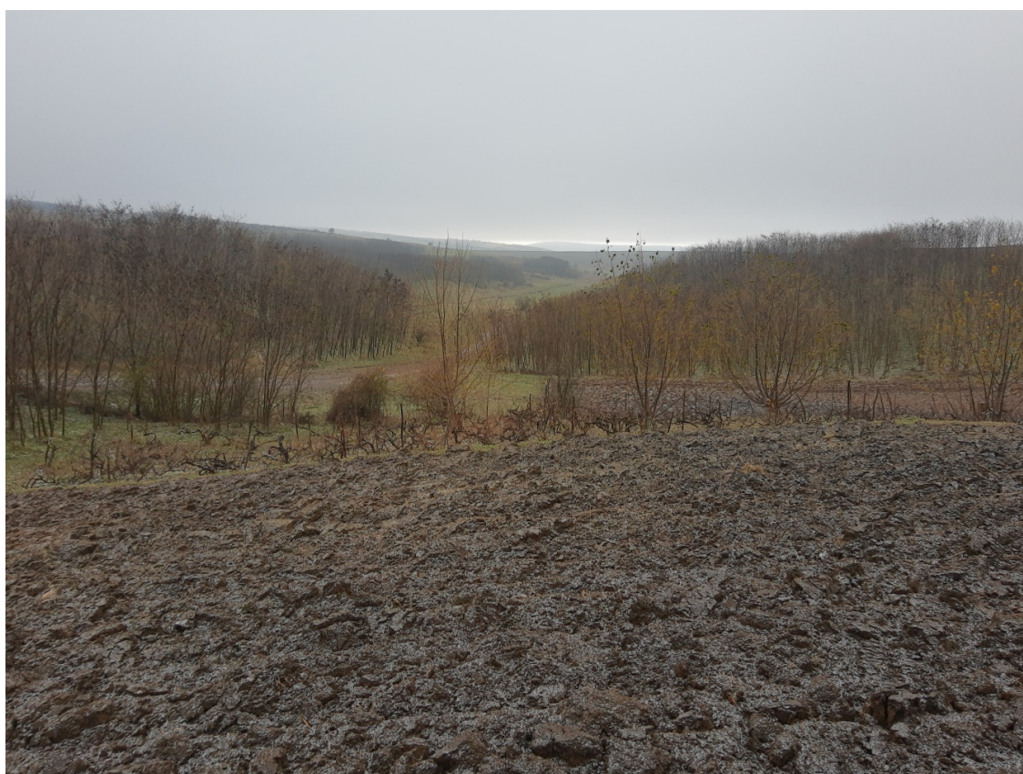
Pl. 15. Situl Țifu-„Scriptănești”.