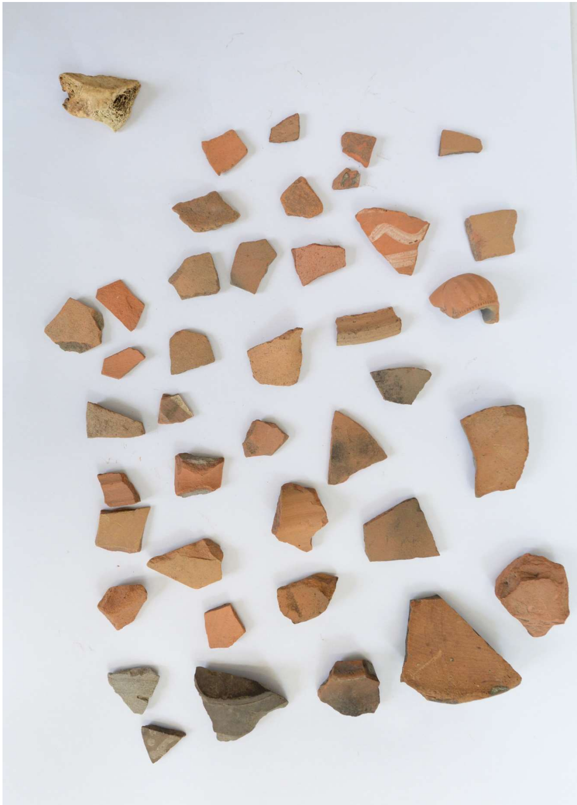
Pl. 14. Materiale din situl arheologic Gura Idrici - „La Coșere 2”.