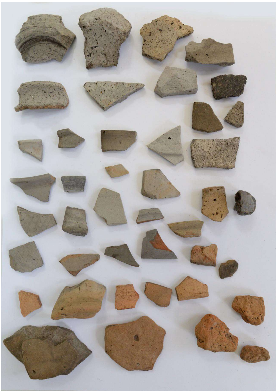
Pl. 11. Materiale din situl arheologic Roșiești - „La Baraj 2”.