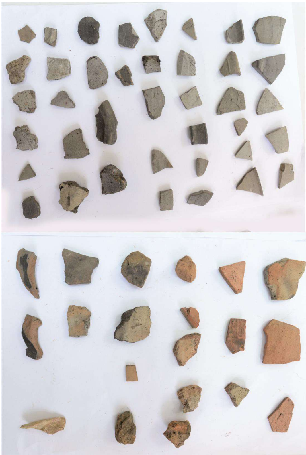
Pl. 10. Materiale din situl arheologic Roşieşti - „La Baraj 1”.