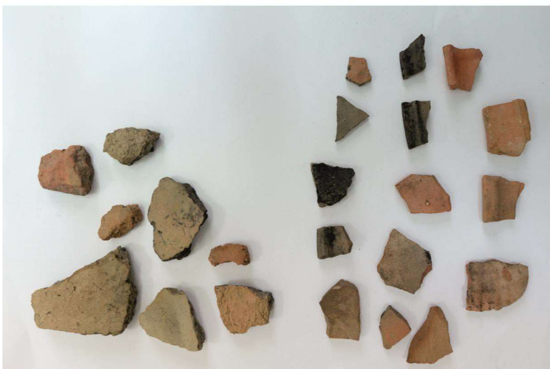
Pl. 13. Materiale din situl arheologic Gura Idrici - „Ciunta”.