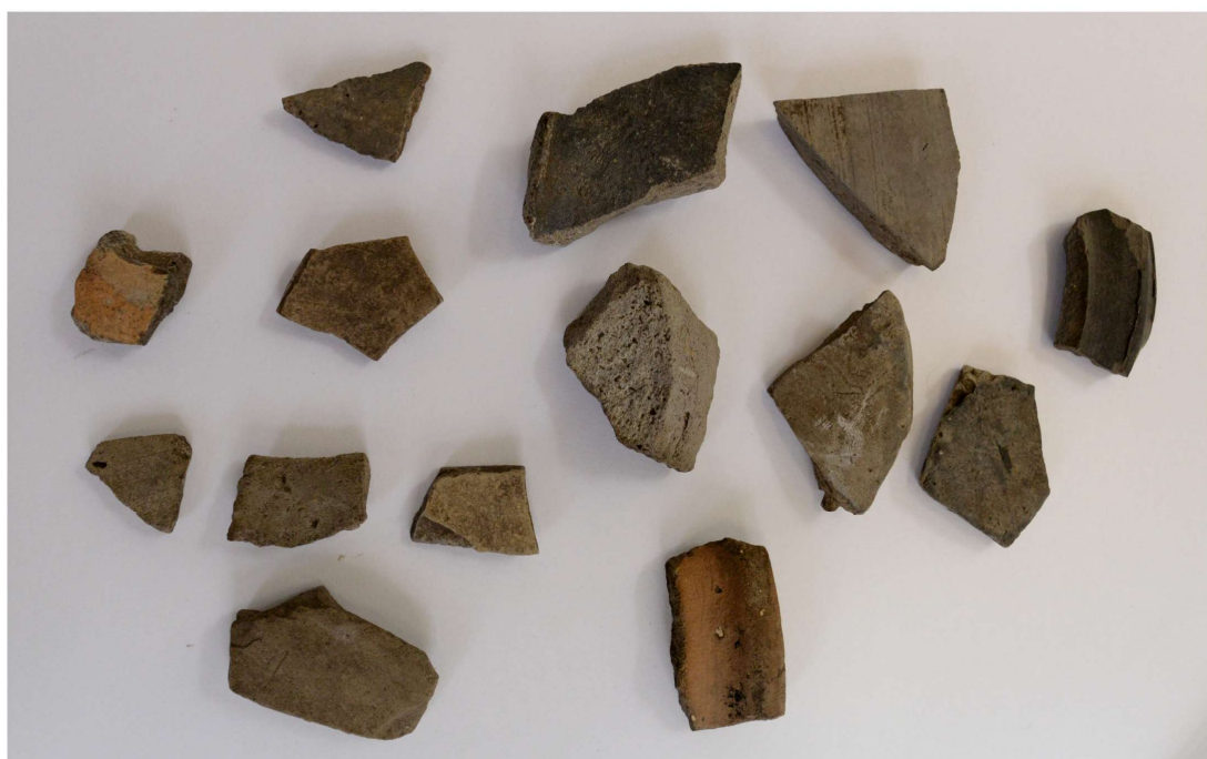
Pl. 4. Materiale din situl arheologic Roșiești Gară - „Curtea Bisericii”.