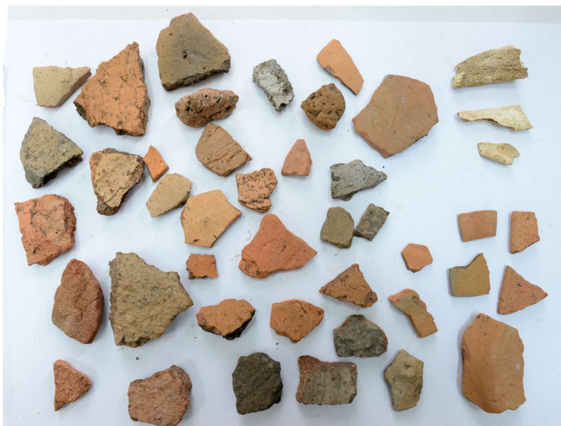
Pl. 7. Materiale din situl arheologic Codreni -„La Loturi”.