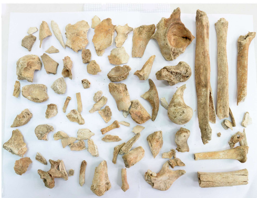
Pl. 2. Materiale din situl arheologic Rosiești Gară - „Groapa ecologică” cod RAN: 165844.01.