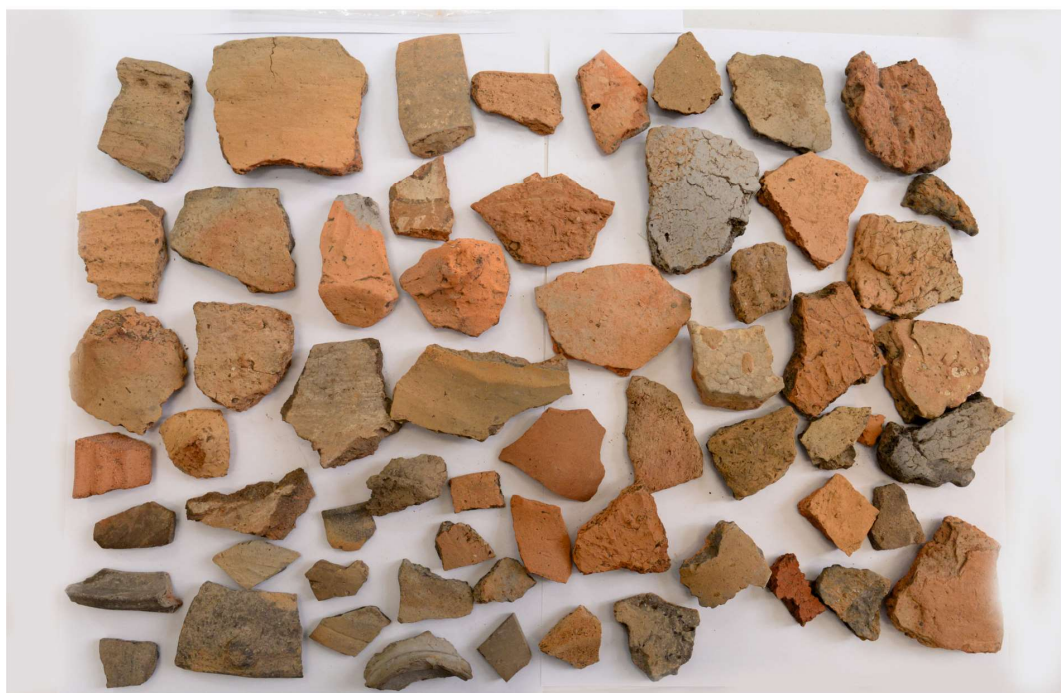
Pl. 6. Materiale din situl arheologic Codreni - „La Loturi”.