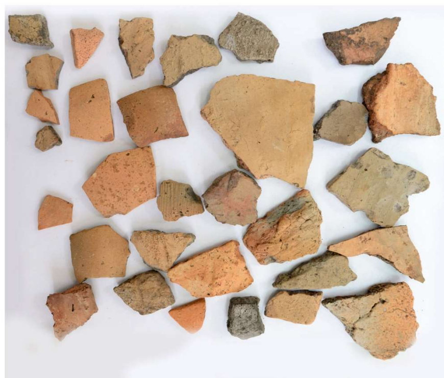
Pl. 3. Materiale din situl arheologic Gura Idrici - „La Coșere”, cod RAN: 165853.01; Cod LMI: VS-I-s-B-06675.