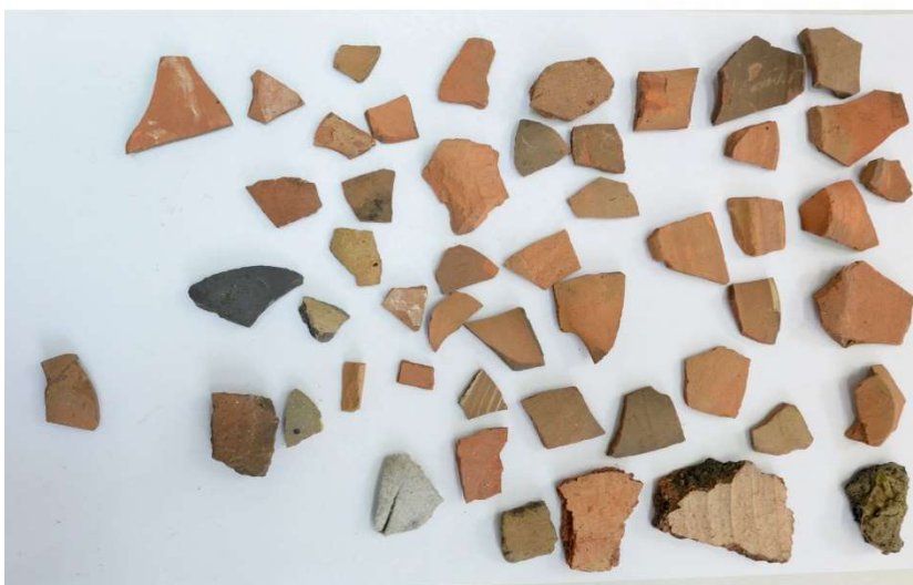
Pl. 8. Materiale din situl arheologic Roșiești - „Curtea bisericii”.