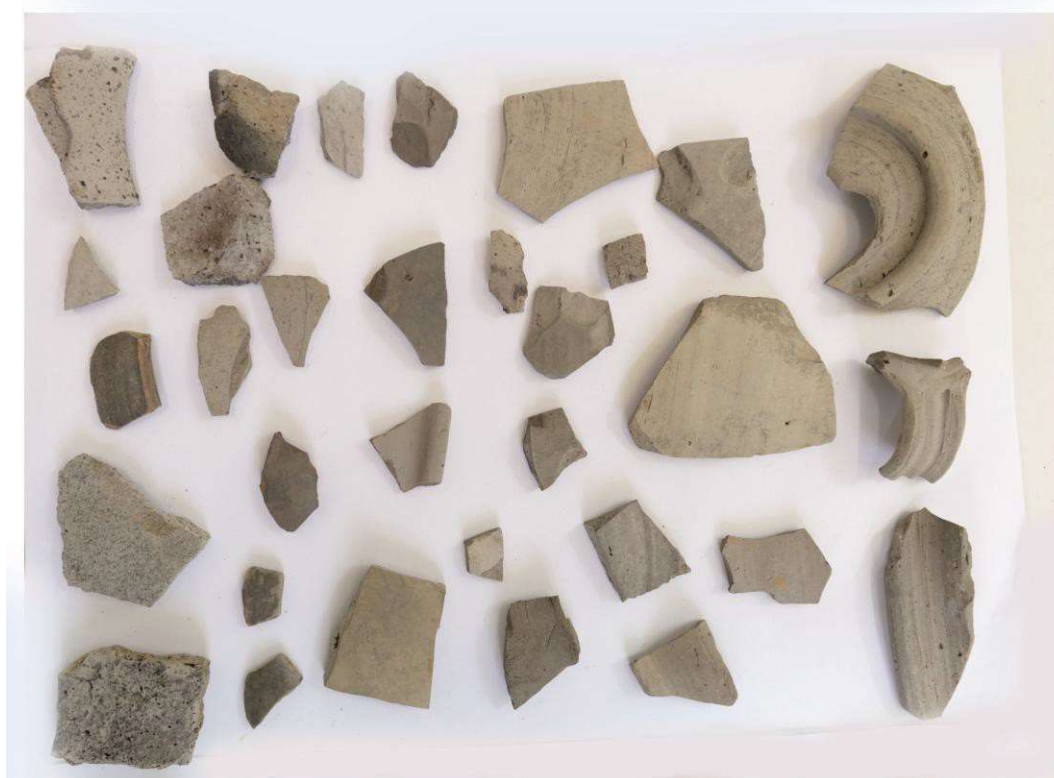
Pl. 9. Materiale din situl arheologic Roșiești - „La Baraj 1”.