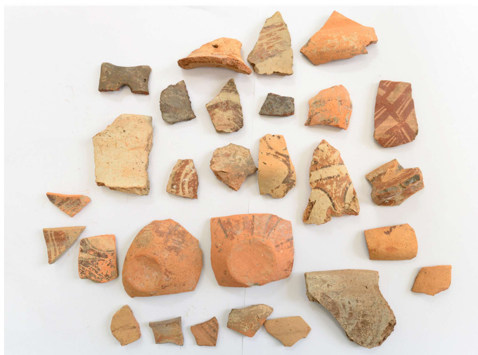
Pl. 5. Materiale din situl arheologic Codreni - „La Loturi”.