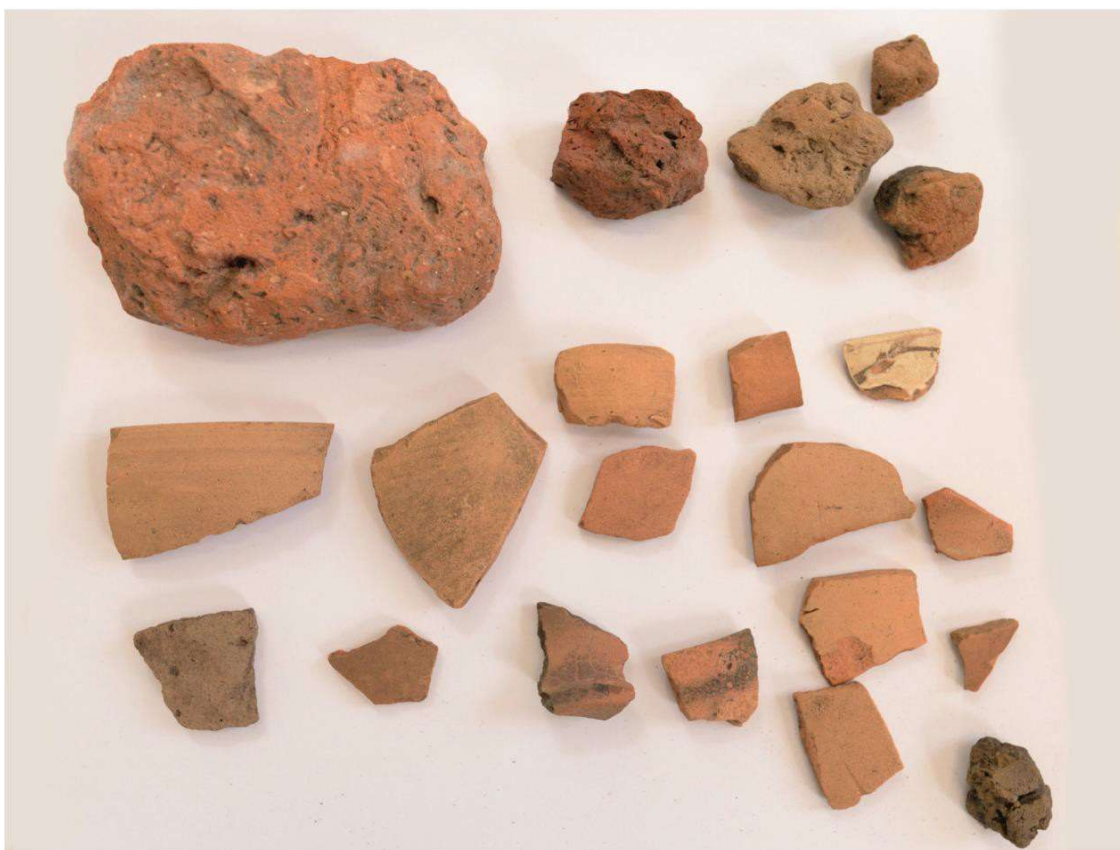
Pl. 12. Aspecte de teren din situl arheologic Idrici - „Stâna lui Zlatan”.