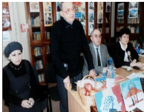
Foto nr. 7 - La Biblioteca Județeană Botoșani - Cabinetul de Numismatică