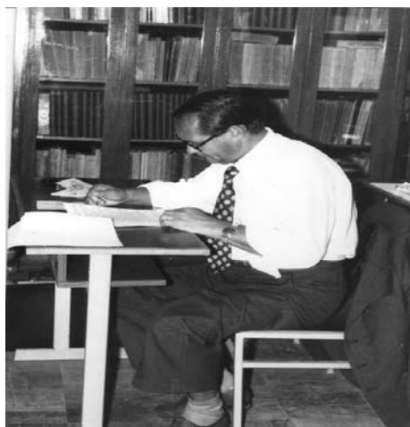
Foto nr. 3 - În sala de studiu a Arhivelor Naționale – București, iunie 1983