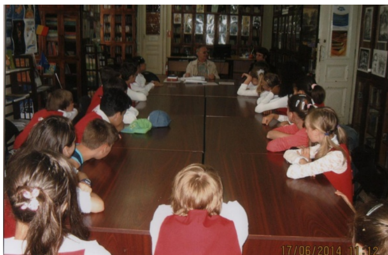
Foto nr. 9 - La Biblioteca Județeană Botoșani - Cabinetul de Numismatică, într-o discuție cu elevii