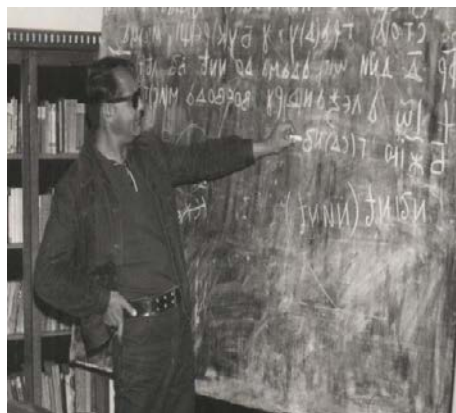
Foto nr. 6 - Cursul de slavă de la Arhivele Naționale – București,