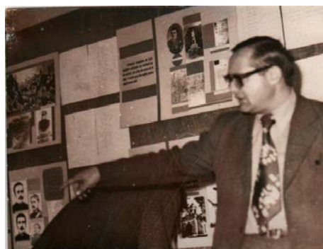
Foto nr. 4 - București, iunie 1981 - Cursul de slavă