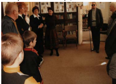
Foto nr. 5 - La Biblioteca Județeană Botoșani – Cabinetul de Numismatică