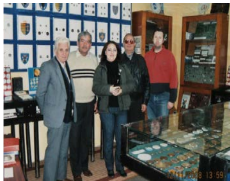
Foto nr. 8 - La Biblioteca Județeană Botoșani - Cabinetul de Numismatică