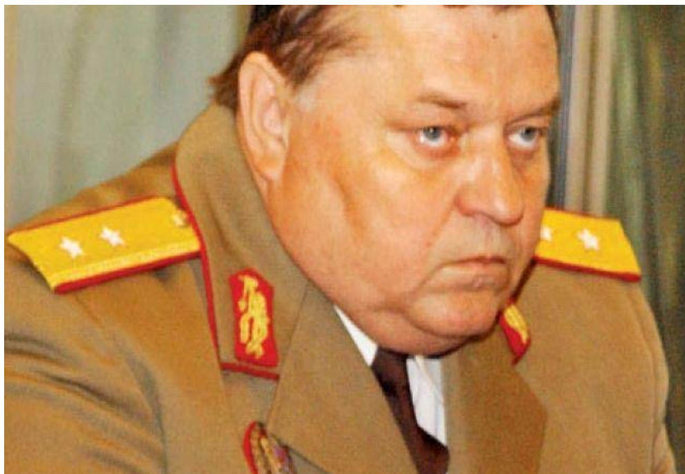
General Palaghia Mihai – doctor în științe militare