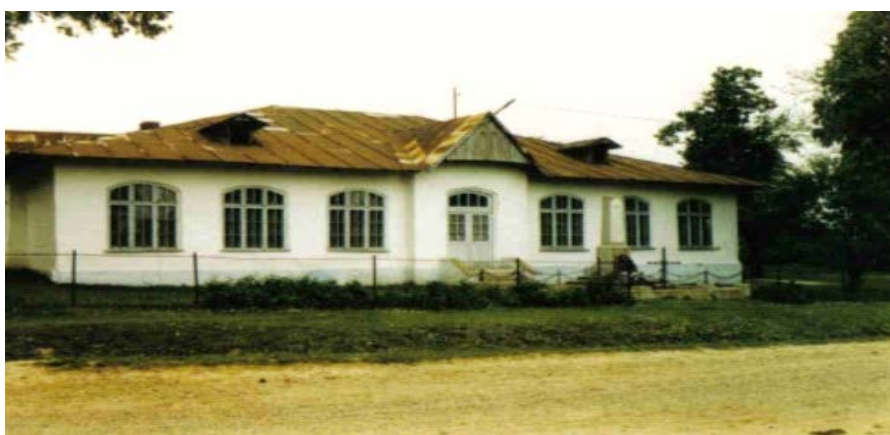
Localul școlii de la vale dat în funcțiune în anul 1930