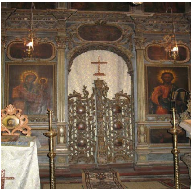
Detaliu catapeteasma bisericii „DUMINICA TUTUROR SFINȚILOR”