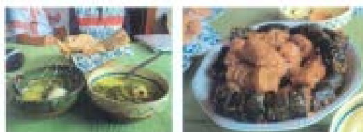
Cărnău de porc – Văracie și mămăligă