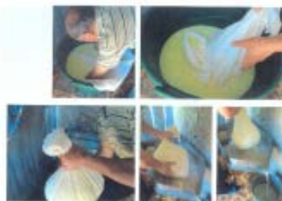
Cărnău de porc – Văracie și mămăligă