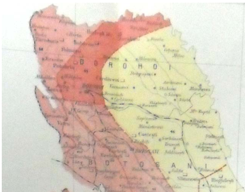
Harta 1. Densitatea demografică a nordului Moldovei la început de secol XX

O imagine generală asupra densității geografice a zonei de nord a Moldovei de la începutul secolului al XX-lea ne este prezentată de studiul lui Alexandru Gh. Dimitrescu, harta demografică de mai jos fiind un fragment din cea întocmită de acesta: