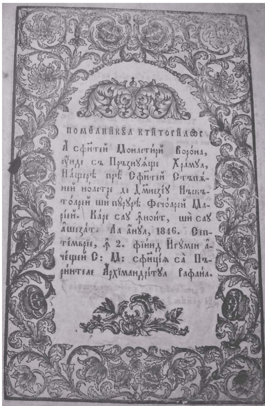
Fig. 1 – Pomelnicul mănăstirii Vorona (pagina de titlu) – ANBt